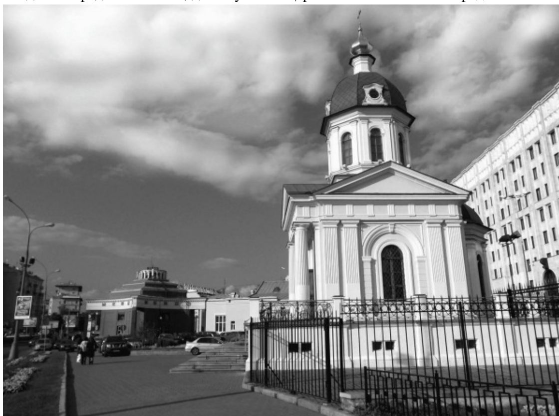
Арбатская площадь между Гоголевским и Никитским бульварами

Название Белый город до сих пор вызывает споры. Дело в том, что наименование этого оборонительного рубежа может быть связано как с белым цветом самой каменной стены, так и с «белыми землями» (освобожденными от земских податей), находившимися внутри укреплений. В конце XIV века часть Москвы с «белыми землями» была обнесена валом и рвом. Стена Белого города возводилась позднее – с 1585 по 1593 год. Строительство шло в годы правления царя Фёдора I Ивановича, второго сына царя Ивана IV Грозного. Царь Фёдор «повеле на Москве делати град Каменный», дав ему имя «Царев Белый Каменный город».