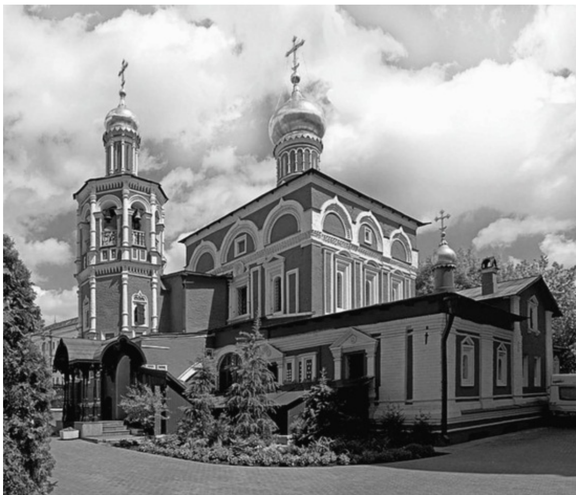
Церковь Всех Святых на Кулишках

Возможно, что для первых местных жителей церковь Всех Святых могла быть обычным приходским храмом. А в 1380 году князь Дмитрий Донской приказал перестроить её в честь победы и памяти убиенных воинов – как храм-памятник.