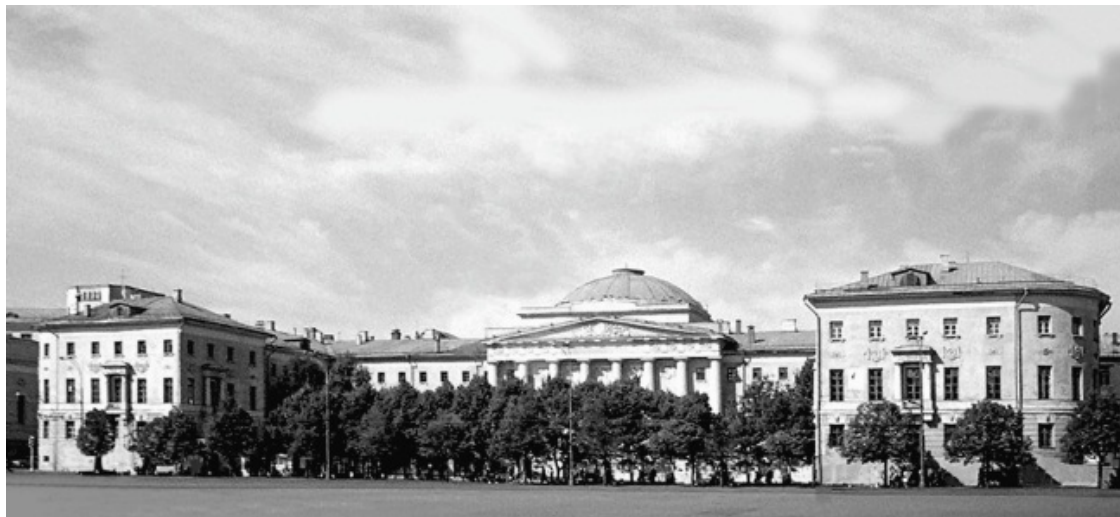
Старое здание МГУ

В 1770 году руководство Московского университета обратилось с просьбой к императрице Екатерине II передать царское урочище на Воробьевых горах «для строительства университетского городка». Но был получен высочайший отказ и выговор за «проектирование на месте собственности высочайшего двора». А в 1780-х годах кирпич для строительства Главного корпуса на Моховой поставлялся с завода у Воробьевых гор. Поэтому в том, что в середине XX века на Воробьевых горах было возведено новое здание МГУ, была некая историческая закономерность.