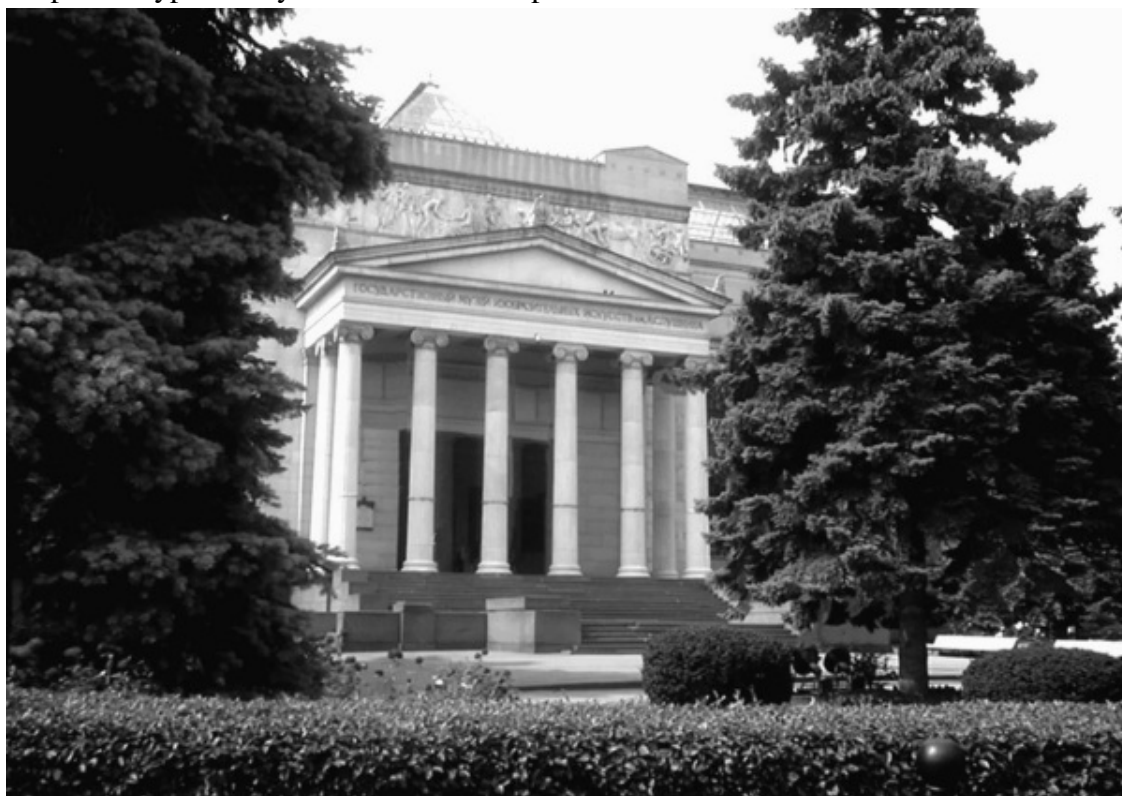
Государственный музей изобразительных искусств имени А.С. Пушкина