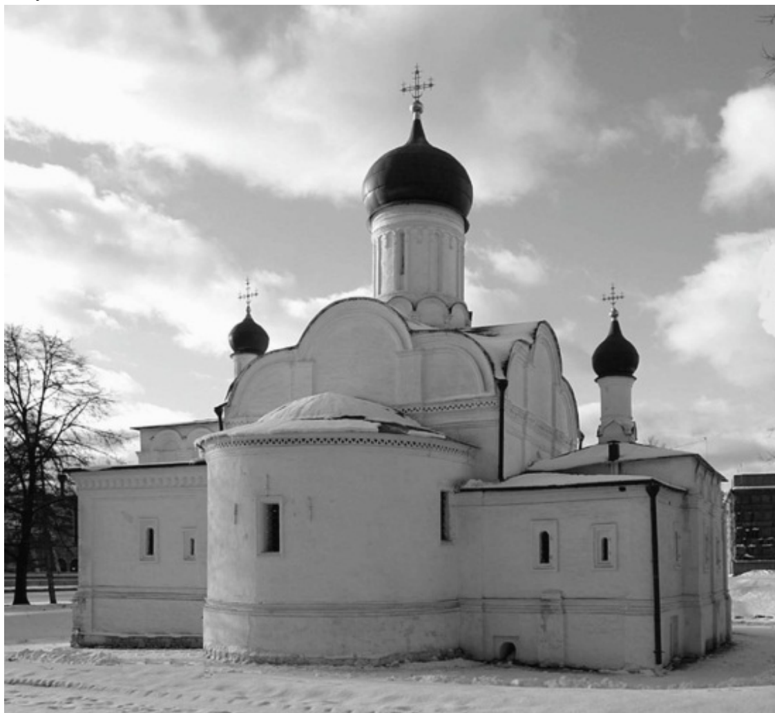
Церковь Зачатия Анны, что в Углу

Летописцы называли Ивана III Васильевича «собирателем земли Русской». При нём было окончательно свергнуто ордынское иго. Принятый ещё своим отцом Василием Васильевичем Тёмным в соправители, Иван III Васильевич вступил на Московский престол после смерти отца полным властителем Руси. Ещё при жизни он был назван современниками Великим. Это при нём началась перестройка обветшавшего Кремля: взамен белокаменных стен и башен стали подниматься кирпичные. Стены и башни Кремля возводили итальянские архитекторы Антон Фрязин (Антонио Джиларди), Марко Фрязин (Марко Руффо), Пётр Фрязин (Пьетро Антонио Солари), Алевиз Фрязин Старый (Алоизио да Каркано). С этого времени Кремль начал обрёл существующий ныне облик.