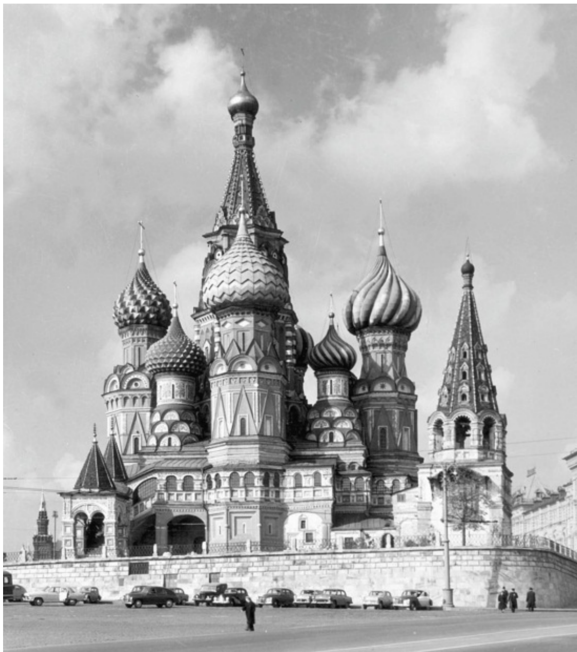
Храм Василия Блаженного

В середине XVI века у каменной Троицкой церкви был погребён блаженный Василий, московский «Христа ради юродивый». Считалось, что он был наделён даром ясновидения. Мол, это он предсказал страшный пожар Москвы в 1547 году, уничтоживший почти всю столицу. Блаженного чтит и даже побаивался Иван Грозный. По легенде, Василий первым начал собирать деньги на этот храм. Перед своей смертью Василий Блаженный отдал все накопленные средства царю Ивану Васильевичу, который и приказал заложить на Красной площади собор. После кончины Василий Блаженный был погребён на кладбище при Троицкой церкви. А вскоре после этого там и началось грандиозное строительство нового Покровского собора. Позднее к собору перенесли мощи Василия, на чьей могиле стали совершаться чудесные исцеления.