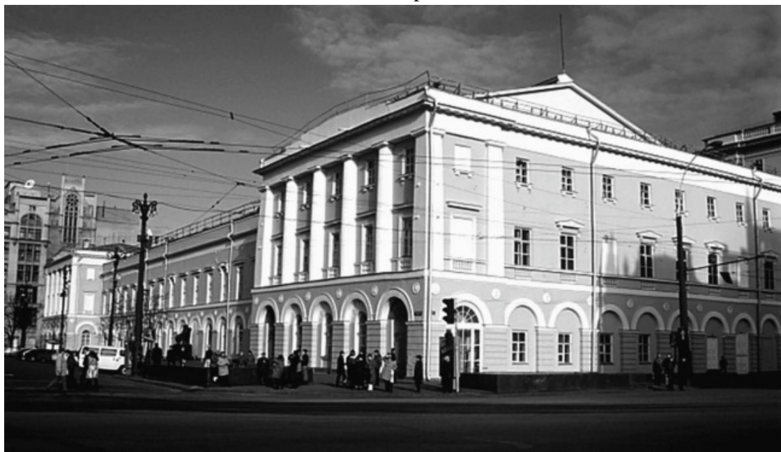
Государственный академический Малый театр

Труппа Малого театра была создана при Московском университете в 1756 году, сразу после известного указа императрицы Елизаветы Петровны об учреждении «Русского для представления трагедий и комедий театра». Именно этот указ ознаменовал рождение в России профессионального театра. Вольный русский театр при университете возглавил известный поэт и драматург Михаил Матвеевич Херасков. С 1759 года театр получил название Университетского. В 1760-е годы, претерпев некоторые изменения и объединившись с другими труппами, он стал называться московским Российским театром.