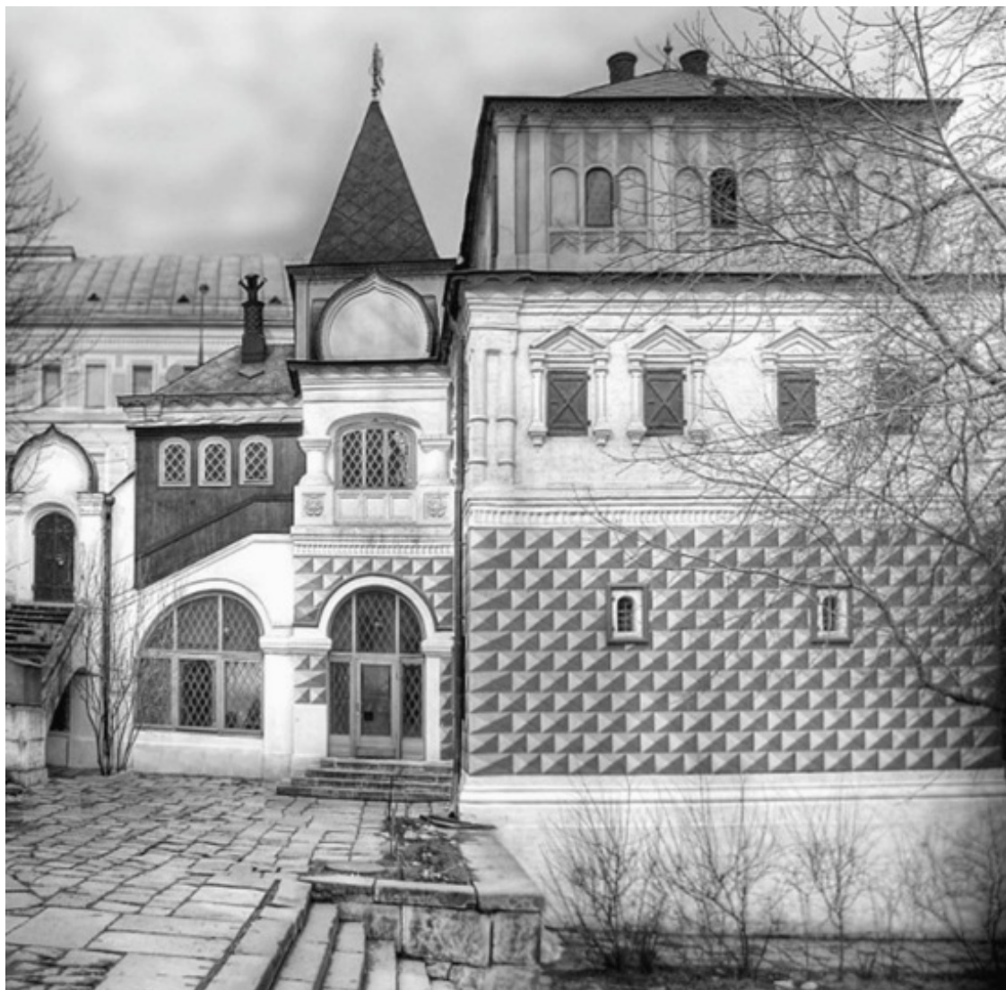
Палаты Романовых в Зарядье

Основным жилым помещением боярской семьи служили более обширные Палаты на нижних погребках, стоявшие в центре усадьбы. После воцарения Романовых Палаты вместе со всей усадьбой стали называть Старым государевым двором.