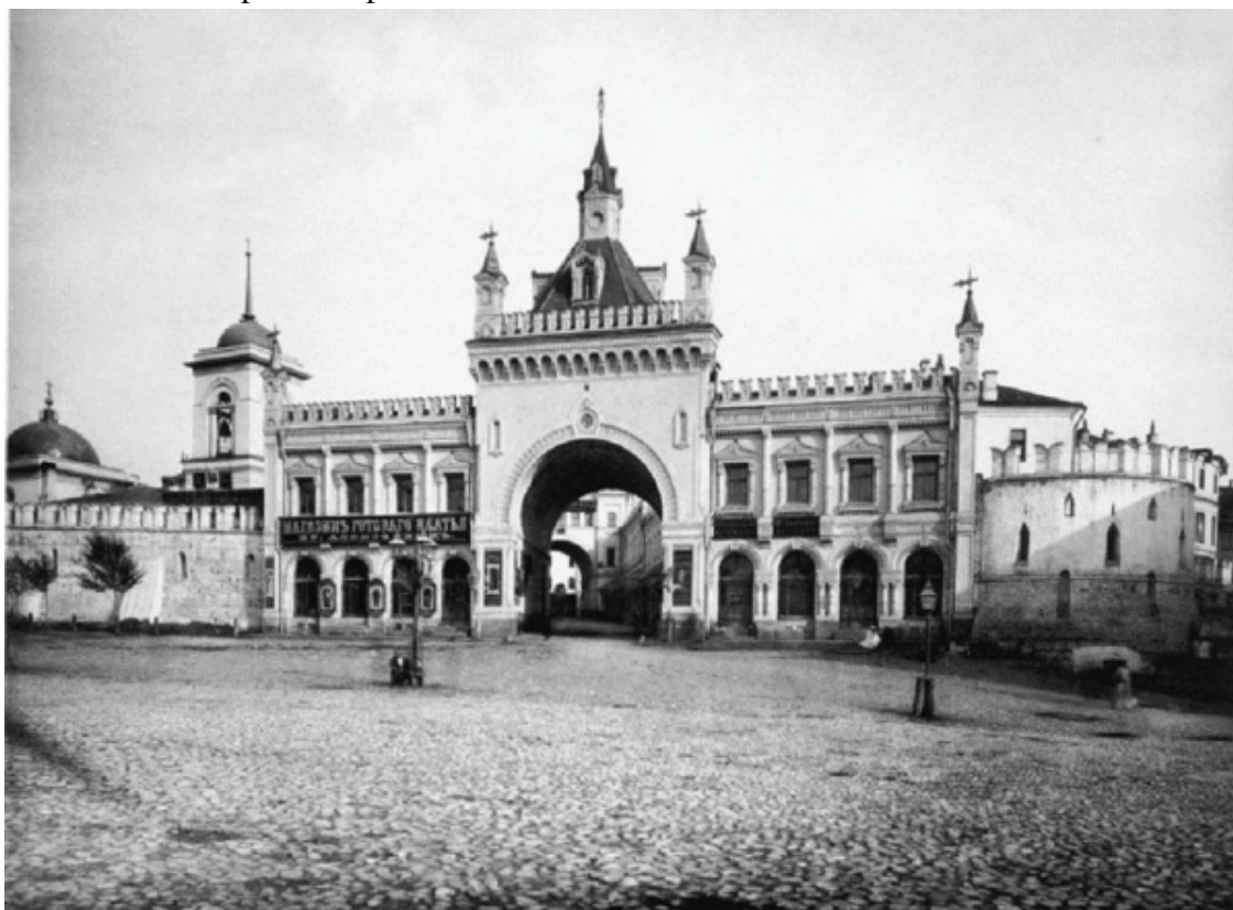
Китай-город. Третьяковский проезд

Интересно, что одно время Великий посад занимал и часть Кремля. Это уже после расширения Кремля при Иване Калите и Дмитрии Донском часть посада была вытеснена с Боровицкого холма. Тогда-то посад разросся на восток и занял почти всю территорию нынешнего Китай-города. Три улицы, образовав своего оврага трезубец, стали основными осями Китай-города. Они протянулись от Кремля на восток, к основанию мыса между Москвой-рекой и Неглинной. От Никольских ворот пролегла Никольская, от Спасских – Ильинка, от несуществующих сейчас Константино-Еленинских – Варварка. Названия улицы получили по стоявшим на них монастырям и церквям.