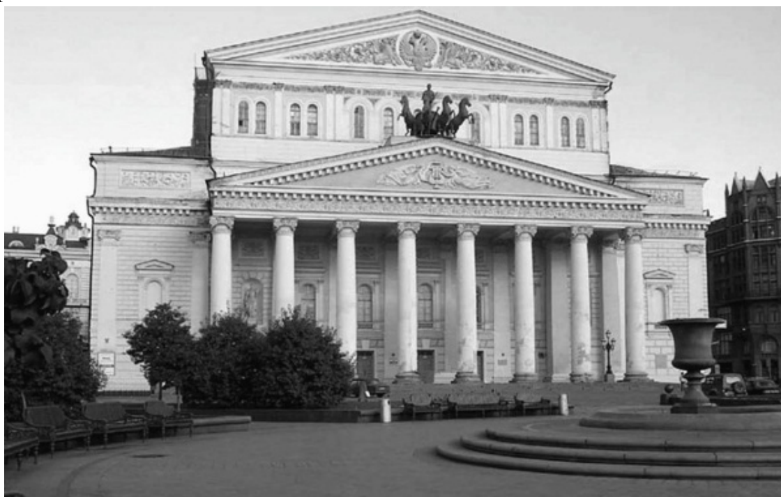
Государственный академический Большой театр России (ГАБТ)

Для постройки здания театра Медокс выкупил земельный участок в начале Петровской улицы. Каменное трёхэтажное, с тёсовой крышей здание так называемого Театра Медокса, или Петровский театр, было возведено за пять месяцев. Строил театр архитектор Христиан Иванович Розберг, который в московской полицейской конторе занимался проектированием и строительством зданий.