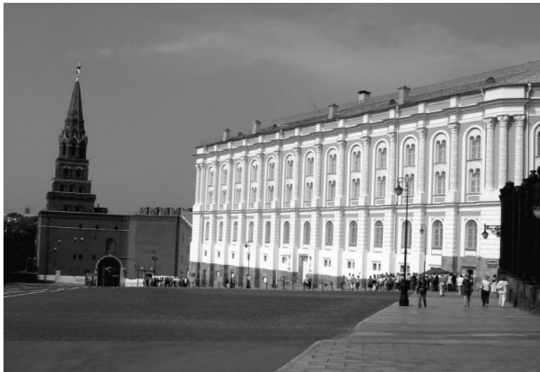
Оружейная палата – музей-сокровищница

Аппартаментов были построены в 1851 году. Они были соединены воздушным переходом с дворцовым комплексом. Так образовался единый ансамбль Большого Кремлевского дворца, связанного композиционно и стилистически. Оружейная палата изначально предназначалась для хранения и экспонирования сокровищ царской казны. Она сменила старую Оружейную палату и стала одним из первых в России зданий специального музейного назначения.