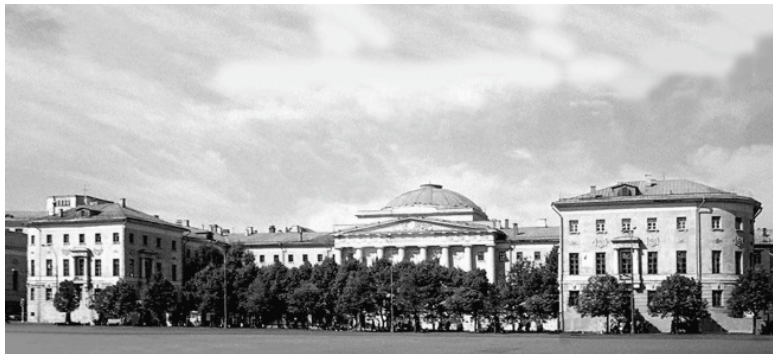
Старое здание МГУ

С МГУ связаны имена многих выдающихся деятелей российской науки и культуры. Начиная с основателей московского университета – Михаила Васильевича Ломоносова и Ивана Ивановича Шувалова. Известно, что Ломоносов не раз предлагал в письмах графу Шувалову, фавориту императрицы Елизаветы Петровны, открыть «полноправный Университет» в Москве. И вот 12 января (25 по новому стилю) 1755 года императрица подписала указ «об учреждении Московского университета». Но официально университет открылся 26 апреля 1755 года.