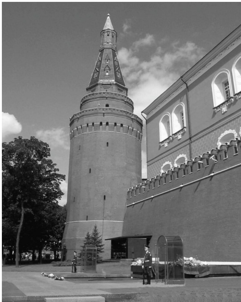
Мемориальный архитектурный ансамбль «Могила Неизвестного Солдата»