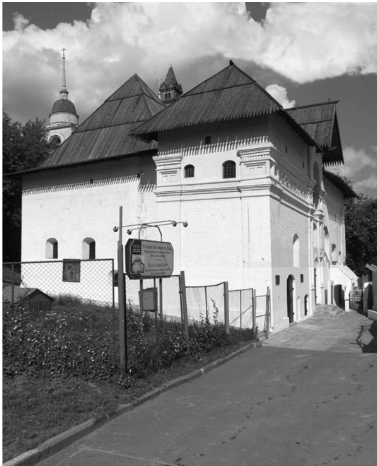
Старый Английский Двор