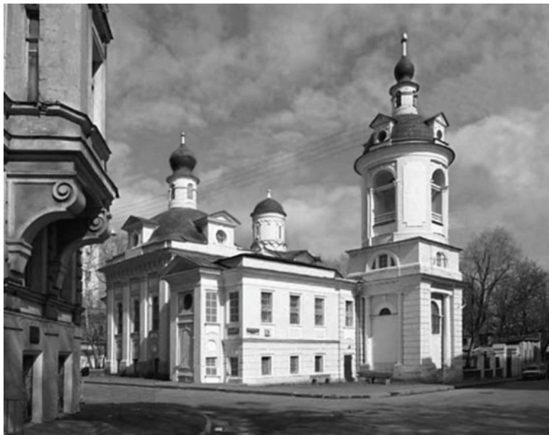
Церковь Антипия на Колымажном дворе (Храм Священномученика Антипы на Колымажном дворе)

Другая загадка – это время возведения церкви. Историки датируют её строительство 1530-ми годами. Но есть версия, что первую деревянную церковь на этом месте выстроил итальянский архитектор Алевиз Фрязин в 1514 или 1519 году. Иногда считают, что он построил здесь другой храм, во имя митрополита Петра, а на его месте позднее построили (или перестроили) новую Антипьевскую церковь. Сохранив-