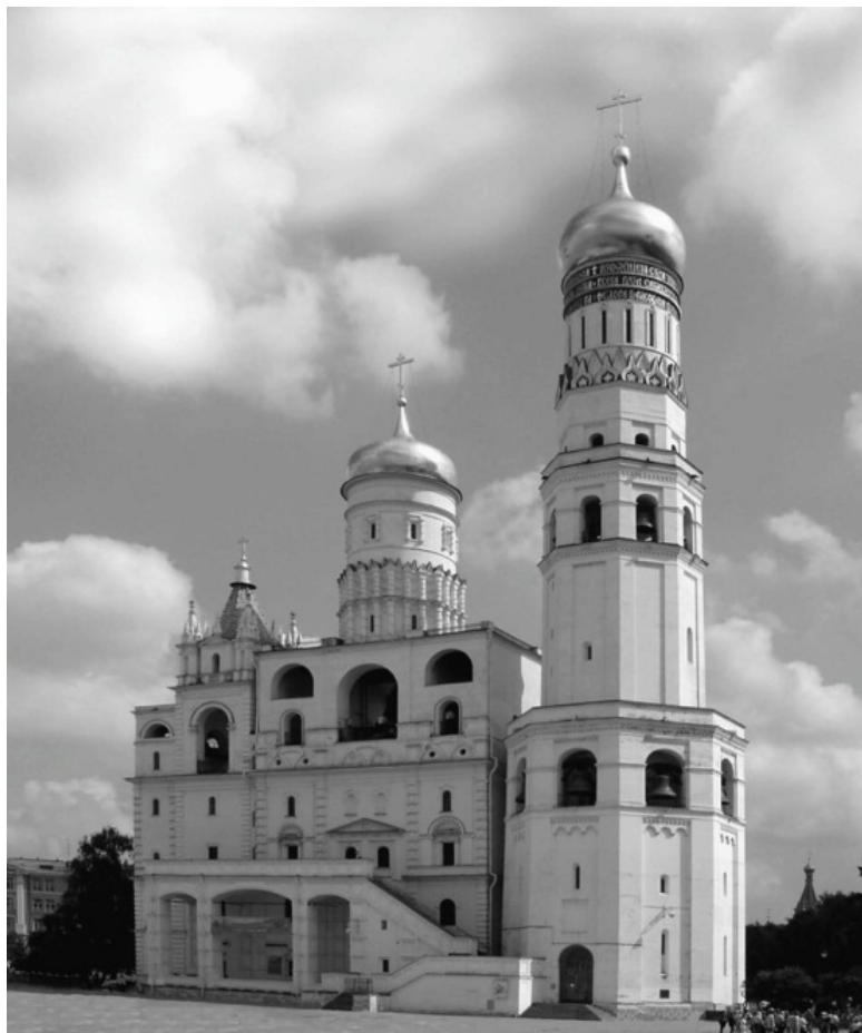
Колокольня «Иван Великий»

Многолепестковый храм в основании колокольни — ше-