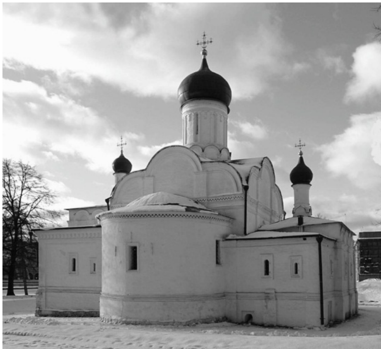
Церковь Зачатия Анны, что в Углу

Церковь Зачатия Анны на Востром конце была построена сразу после панических настроений, связанных с ожиданием конца света. По христианскому летосчислению в 1492 году наступала седьмая тысяча лет от библейского Сотворения мира (5508 лет до рождения Христова плюс 1492 года после