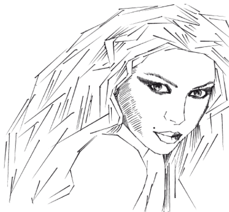
Рис. 1. Макияж в Древнем Египте

Украшали свое лицо и древние египтяне. Особенно интересно то, что многие приемы их макияжа используются и по сей день. Так, традиционный макияж египтянки включал в себя подведенные темной краской глаза, покрашенные в бирюзовый цвет веки и нарумяненные порошком из красной глины щеки (рис. 1). Конечно, сегодня используются совершенно иные косметические средства, но эта мода возвращается.