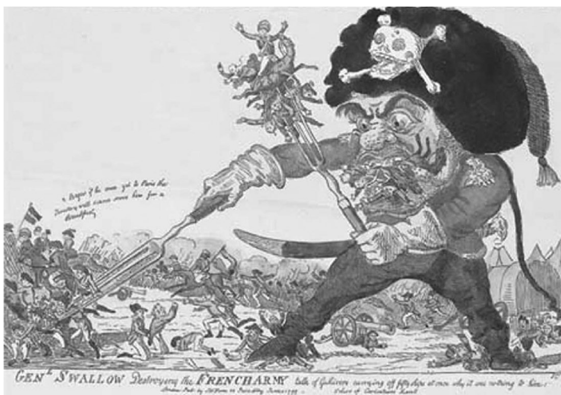
Суворов пожирает французскую армию

С окончанием наполеоновских войн Россия стала противником №1 Великобритании на континенте, и британцы начали готовиться к устранению этого конкурента. В 1820-е годы была запущена психоисторическая (информационная) программа «русофобия», которая должна была морально и идейно подготовить всех западноевропейцев к участию в британской борьбе против России, кульминацией которой в XIX в. стала Крымская война – первая общезападная война против России. Ее результатом стало уменьшение влияния России в Европе и некоторое укрепление позиций Франции Наполеона III, но при этом Россия сохранила статус одной из пяти великих европейских держав и продолжала противостоять Великобритании в Центральной Азии. Чтобы изменить эту ситуацию британцы озаботились созданием континентального противовеса России, который в то же время мог бы подсесть и Наполеону III, проявлявшего все большую самостоятельность. Таким противовесом должна была стать объединившаяся вокруг Пруссии Германия.