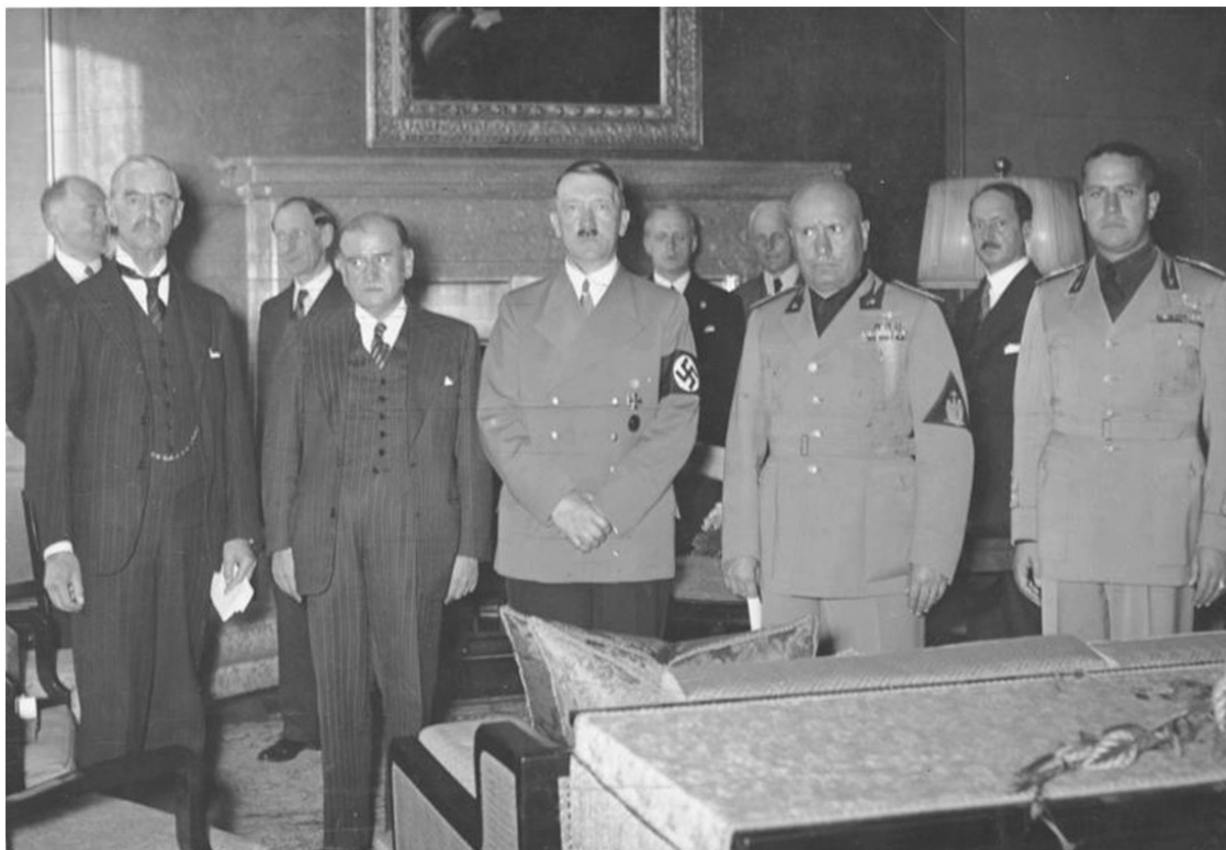
Во время подписания Мюнхенского соглашения (30 сентября 1938 г.) (Слева направо: Чемберлен, Даладьё, Гитлер, Муссолини и Чиано)

Нередко в ответ на обвинения в том, что СССР виновен в разжигании Второй мировой войны не менее Гитлера, наша сторона идет по пути простого реагирования, т.е. опровержения нечистоплотных конкретных тезисов оппонентов. Этого явно недостаточно. Речь должна идти о другом – о фиксации того факта (благо доказательств – избыток, причем об этом много написано серьезными и честными западными учеными), что, во-первых, именно британцы и американцы привели Гитлера к власти, создав «Гитлер инкорпорейтед», что именно англосаксы накачали фюрера деньгами и обеспечили (британцы) Мюнхеном тот военный потенциал, без которого Гитлер не мог бы начать войну против СССР; во-вторых, что именно Великобритания «Мюнхеном-38» сорвала заговор немецких генералов, готовых свергнуть Гитлера, – этого британцы допустить не могли; в-третьих, что именно позиция Великобритании в мае-июне 1941 г. (тайные переговоры с Гессом и другими) создала у Гитлера впечатление, что британцы либо замирятся с ним в случае его нападения на СССР, либо, как минимум, останутся де факто нейтральными, продолжая «Странную войну»: блицкриг против СССР был возможен только при гарантии ненанесения удара британцами на западе.