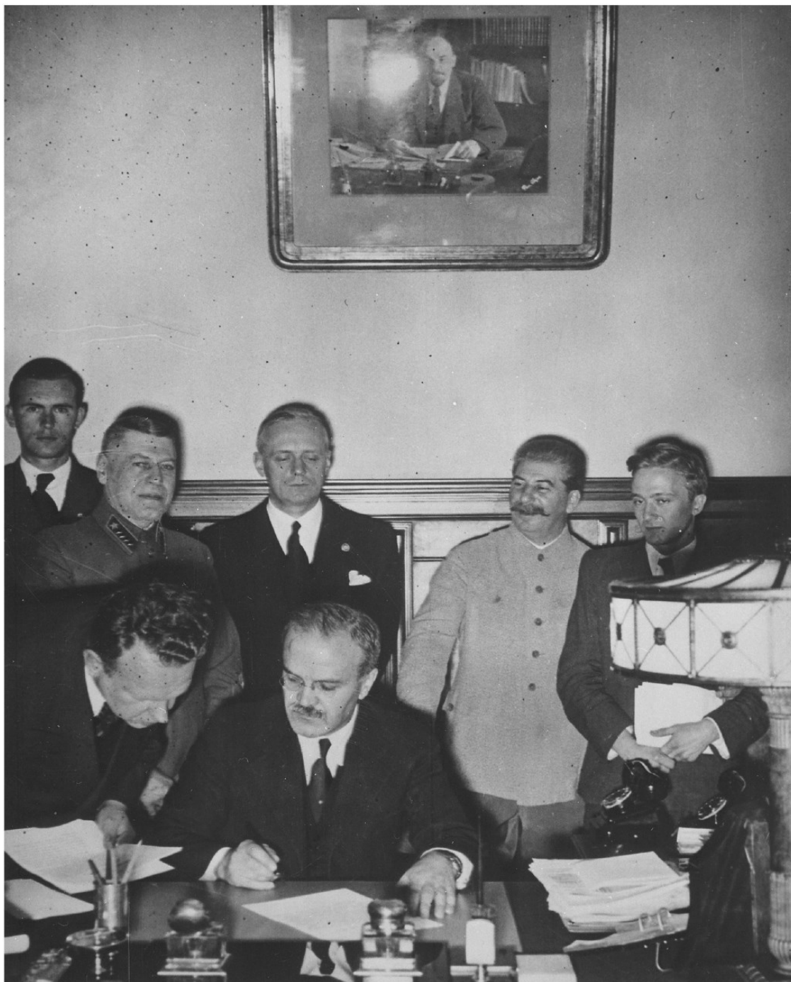
Молотов подписывает Договор о ненападении между Германией и Советским Союзом (за ним Риббентроп, справа Сталин) (23 августа 1939 г.)

Искажение, фальсификация истории – мощное оружие в сфере психоисторической войны вообще и информационной войны в частности. Материализованная в виде институтов, образовательных структур, систем грантов и т.п. фальсификация истории есть один из элементов глобального управления, которое в качестве факта и процесса, как правило, отрицается конвенциональной (профессорско-профанной) наукой, квалифицирующей попытку серьезного изучения наднациональных структур мирового согласования и управления как «конспирологию», «теории заговора» и т.п. Ясно, что наука, обслуживающая субъекта глобального управления, должна отрицать факт его существования. Поэтому сам по себе анализ наднационального управления, его структур, форм, этапов развития, методов и т.п. как ПОЛИ-