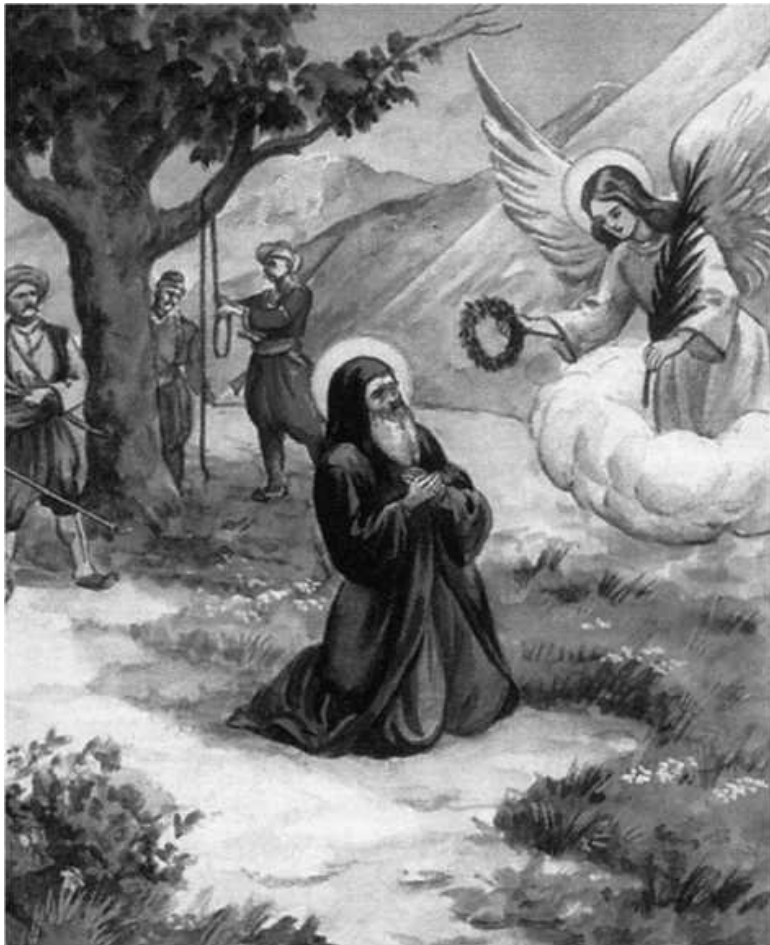
Мученическая кончина св. прмч. Космы Этоайского