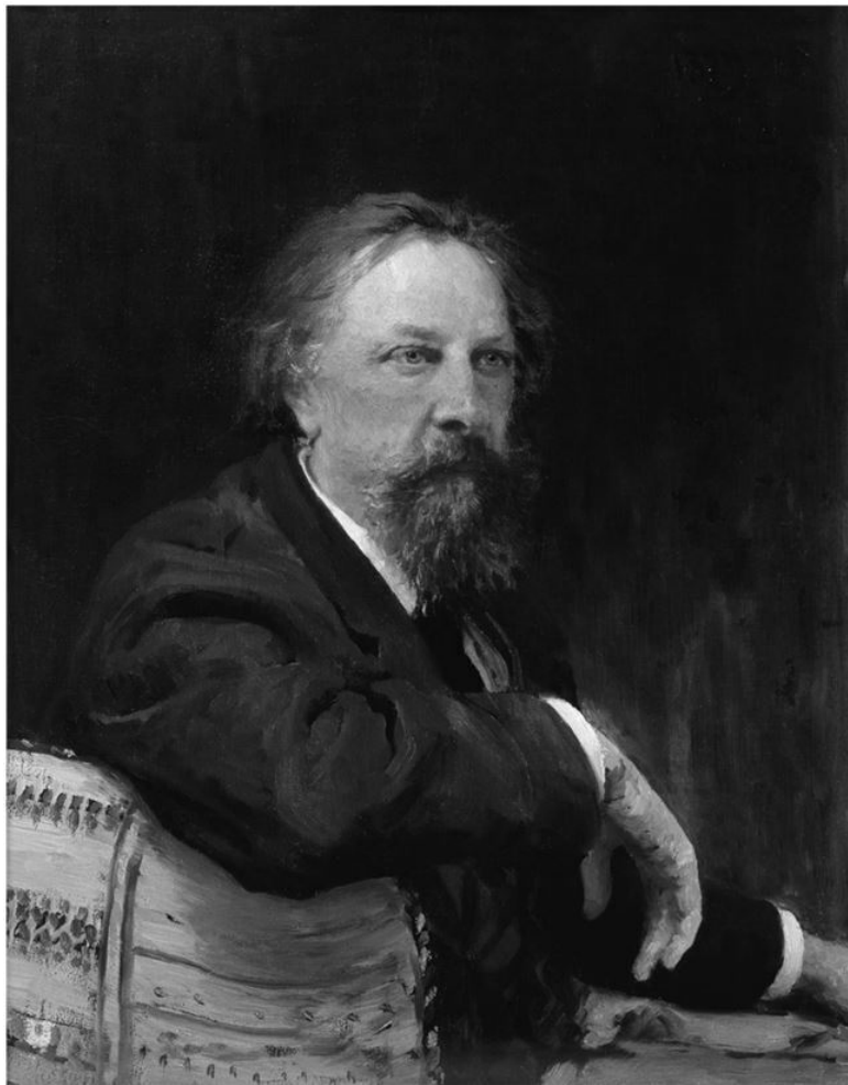
И.Е. Репин. Портрет А.К. Толстого