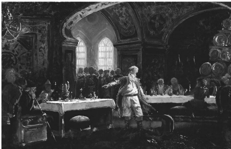
К.Е. Маковский. Князь Репнин на пиру у Ивана Грозного

За мной, мои тиуны, опричники мои! Вы ж громче бейте в струны, баяны-соловьи!»