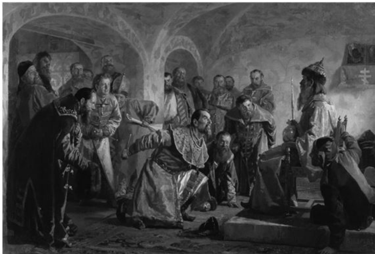
Н.В. Неврев. Опричники