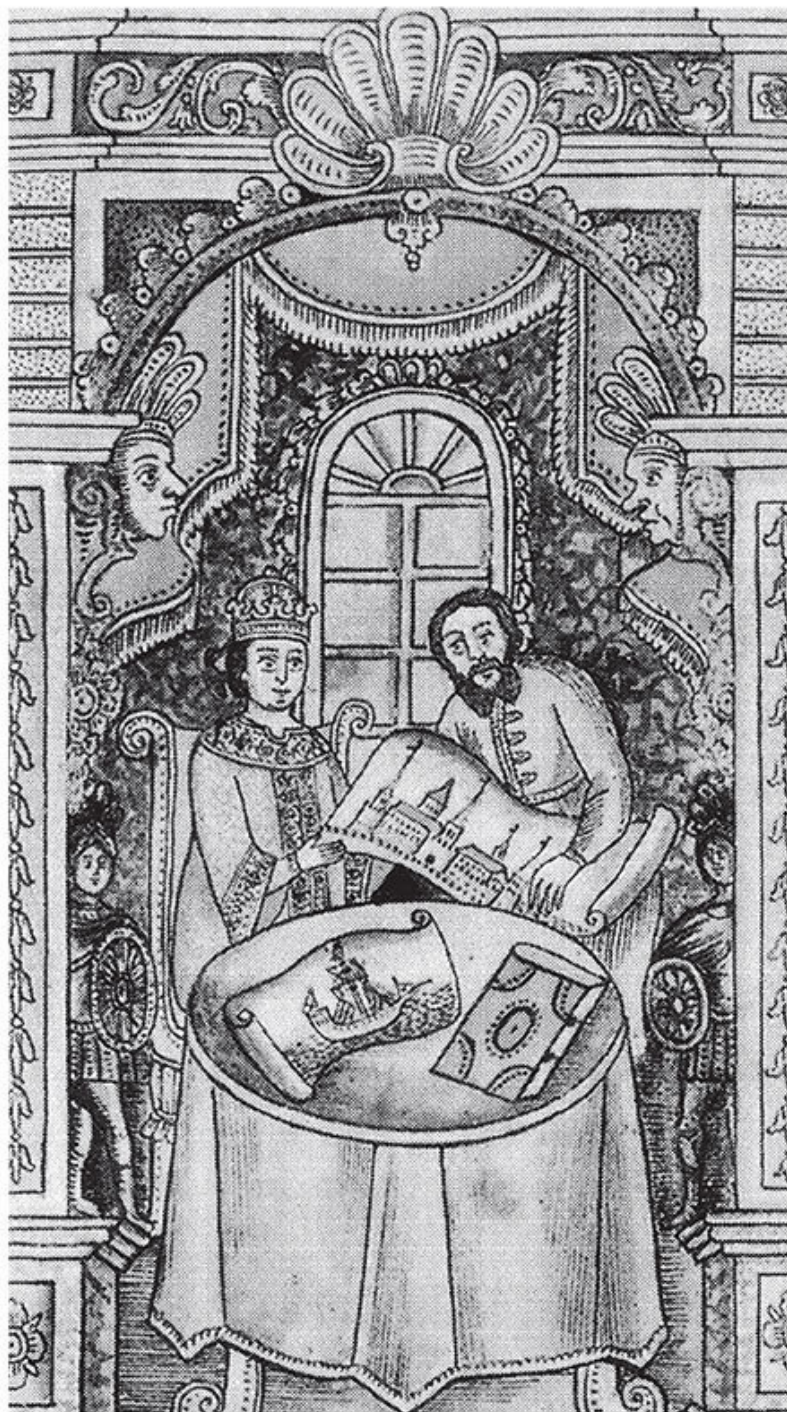
Никита Зотов обучает царевича Петра. Список первой половины XVIII в.

Историк Сергей Соловьев назвал Зотова “старым, опытным излагателем царской воли в указах”, а потому Никита получил титул “ближнего советника”. Особенно он отличился в