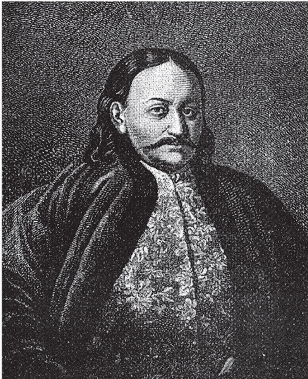
Портрет Ф. Ю. Ромодановского.

Уточним: “дедушкой” именовался не кто иной, как князь Федор Юрьевич Ромодановский (1640–1717) – глава зловещего Преображенского приказа, князь-кесарь Всешутейшего,