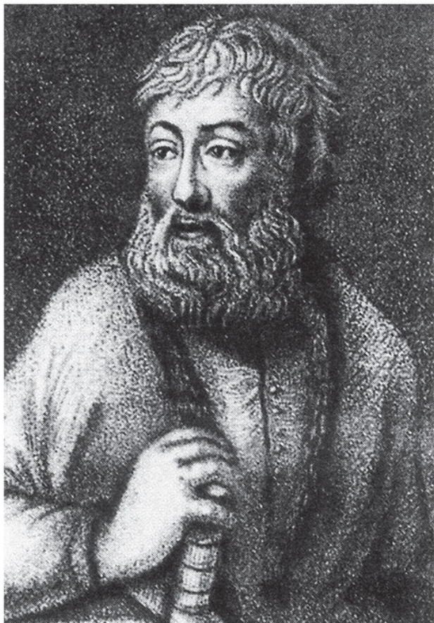
Портрет дъака Н. М. Зотова. Гравюра.