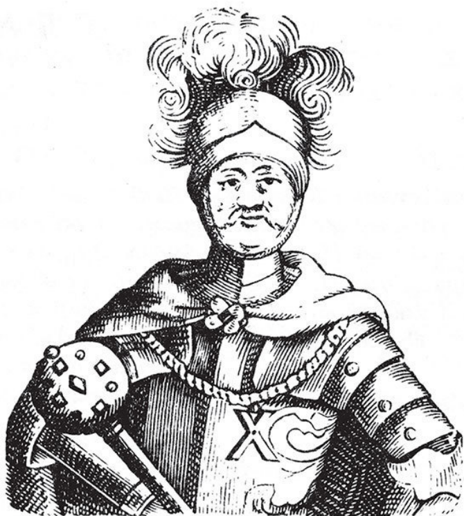
И. С. Мазепа. С аллегорического портрета дьякона Мишуры. Нач. XVIII в.