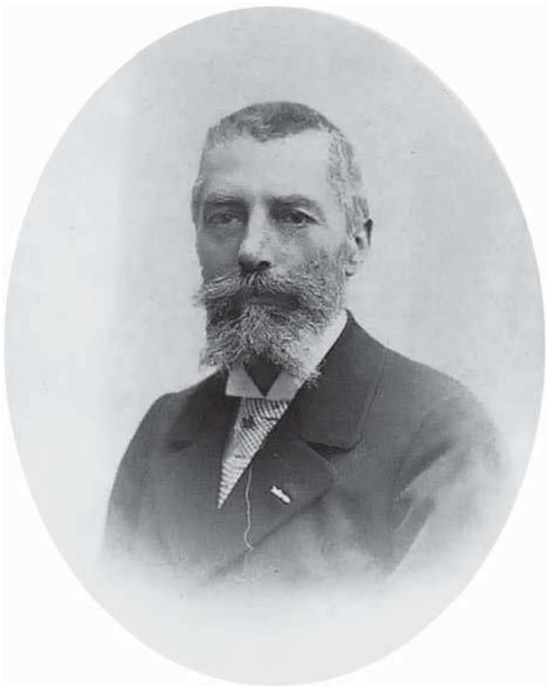
Отец, 1870-е годы

Отец был добрым человеком, хотя с виду казался сухим и нелюбезным, а мать – очаровательная женщина, полная кротости и нежности, и по воспитанию и образованию она была гораздо выше людей ее круга. Я был свидетелем, как росло благосостояние моих родителей, как они радовались, покупая новую обстановку и украшая свое жилище. Все вещи, впоследствии составившее наше имущество, приобретались на выставках 1878, 1889 и 1900 годов.