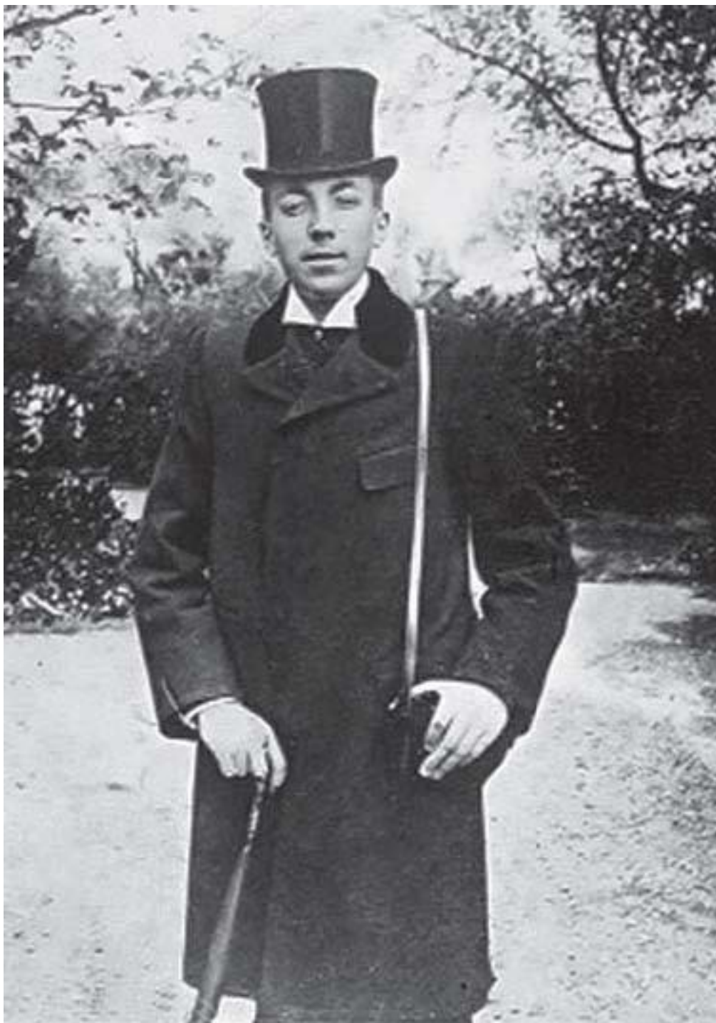
Поль Пуаре, 1898