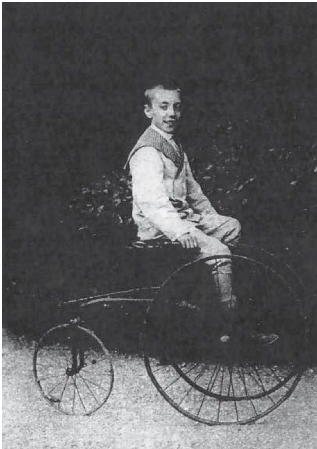
Поль Пуаре в Бийанкуре, 9 лет

На выставке я увидел и другие чудеса: различные области применения электричества, фонограф и так далее... Я хотел лично познакомиться с Эдисоном 9 или написать ему письмо, чтобы от себя поздравить и поблагодарить за то, что он сделал для человечества. Переносная