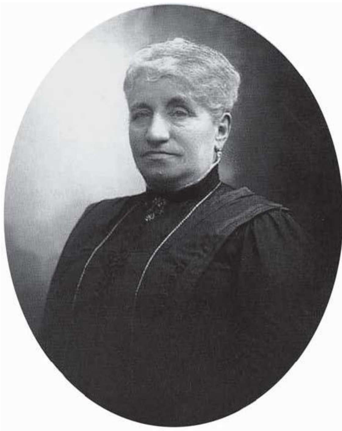
Мать, 1890-е годы