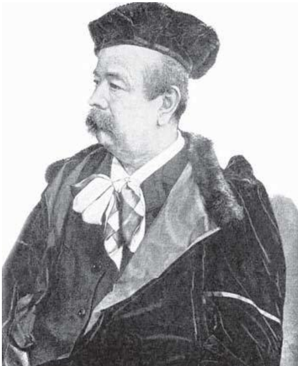
Чарльз-Фредерик Ворт в 1890 г.

Однажды (это было в 1896 году) месье Дусе предложил мне работать только на него, а не пристраивать свои эскизы куда придется. Он взял меня в свой Дом моды и стал покупать все мои работы. Когда я сообщил об этом отцу, он сказал, что этого не может быть: до какой степени он не понимал моего призвания и не верил в мой успех! Отец захотел сопровождать меня к месье Дусе, согласно тогдашней традиции, которая требовала, чтобы работника представляли нанимателю его родители. Хорошо помню, как мы с отцом явились к Дусе, в его изысканно обставленный дом на улице Виль-л'Эвек. Какое ошеломляющее впечатление произвел на меня мой будущий хозяин!