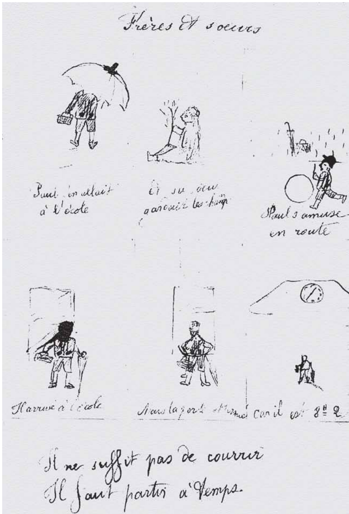
Школьные рисунки Поля Пуаре

Невозможно: мне хотелось произвести впечатление хорошо воспитанного мальчика, поразить учителей изысканными манерами за столом.