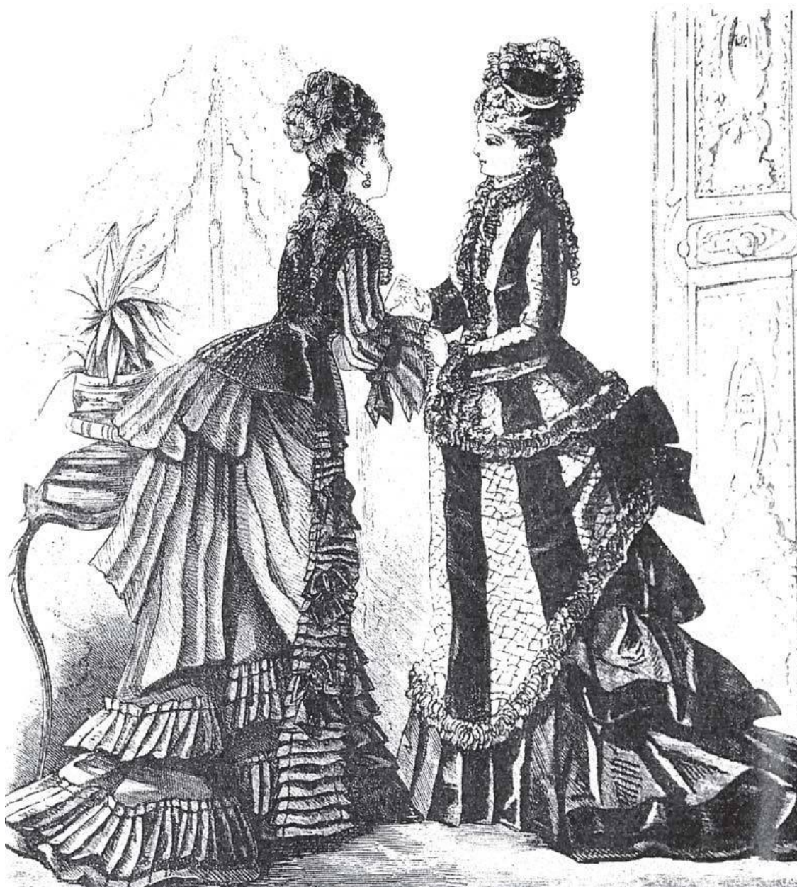
Две модели с турнюрами, 1874

Разве женщины не вправе носить все что угодно, и разве они не владеют секретом, который делает их красивыми.