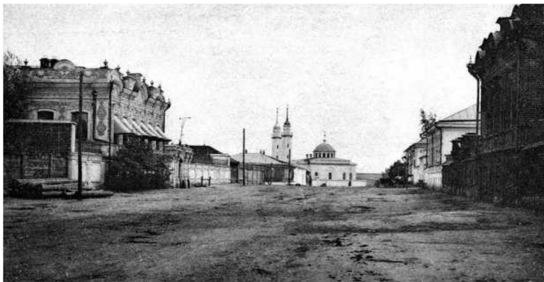
Фото 6. Татарский пер. Вид на 2-ю соборную мечеть г. Троицка. Начало XX в.