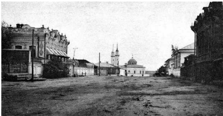
Фото 6. Татарский пер. Вид на 2-ю соборную мечеть г. Троицка. Начало XX в.