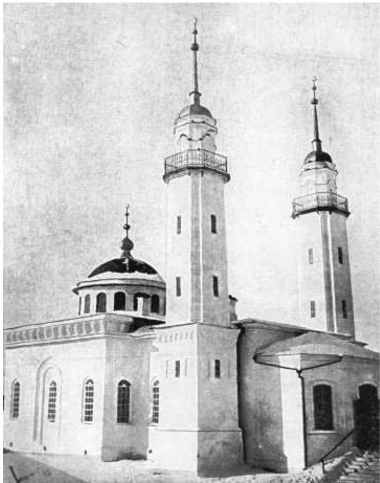
Фото 5. 2-я соборная мечеть г. Троицка. 1911 г.