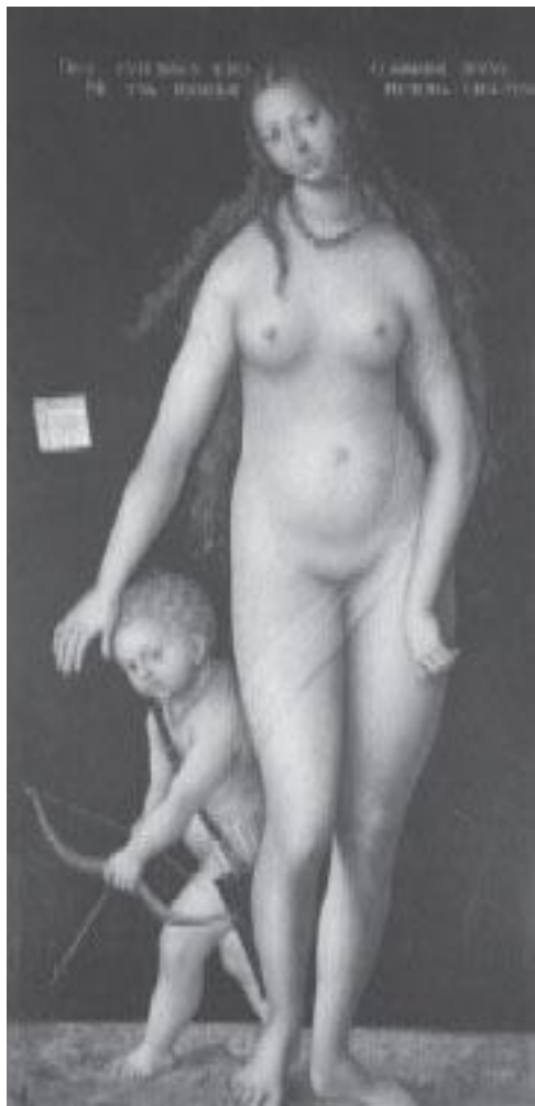
Рис. 1–1. Откровенно любуясь обнаженным женским те-