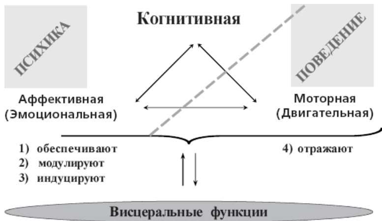
Рис. 1–4. Связь психики, поведения и висцеральных функций у человека и животных

неожиданны для непосвященного. Например, тема диссертации великого отечественного психиатра В. М. Бехтерева «Опыт клинического исследования температуры тела при некоторых душевных заболеваниях» (1881). 11 Многие психические состояния, в том числе и болезненные, характеризуются особой температурной кривой, т. е. измерение температуры помогает уточнить диагноз. Это пример первого аспекта психосоматического взаимодействия: висцеральные реакции отражают психические процессы.