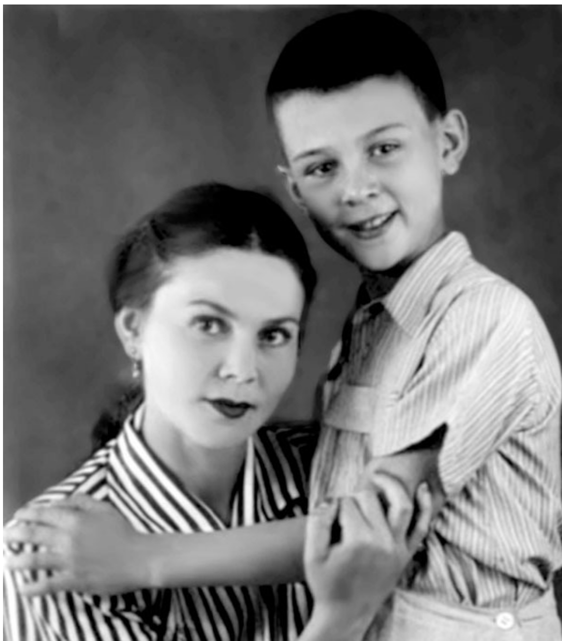
Муслим с мамой

Маленький Абдул Муслим раскрывал и проявлял свои таланты еще во времена существования Российской империи; мальчик обучался в Грозненской городской школе, где начал играть на скрипке, затем в Закавказской учительской семинарии в Гори. Освоив игру на гобое, Магомаев стал солистом семинарского оркестра и иногда выступал с ним как дирижёр. В это же время он изучает азербайджанскую народную музыку. Окончив семинарию, начал работать в училище в Ленкорани, где организовывал музыкальные вечера и театральные представления. В 1911 году Магомаев перебрался в Баку, где стал солистом оркестра Азербайджанского музыкального театра, а вскоре – и его дирижёром.