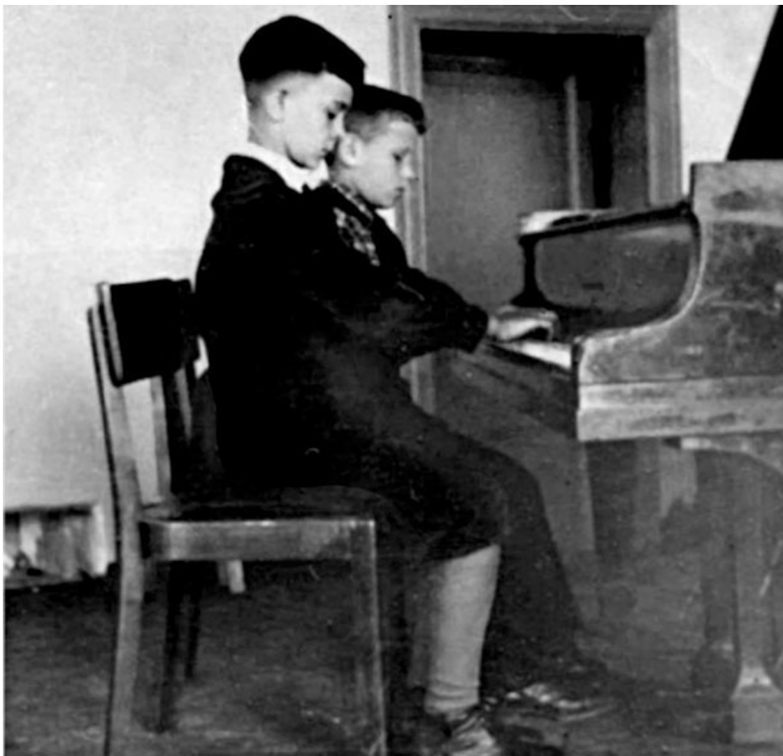
Дуэт за роялем

– Рояль был большой, я маленький, но мы с ним ладили: лет с трех-четырех я уже подбирал мелодии.