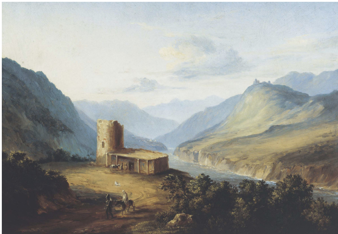
М.Ю. Лермонтов. Военно-Грузинская дорога близ Мцхеты

Третью часть альбома составляют рисунки М.Ю. Лермонтова, иллюстрирующие его литературные произведения.