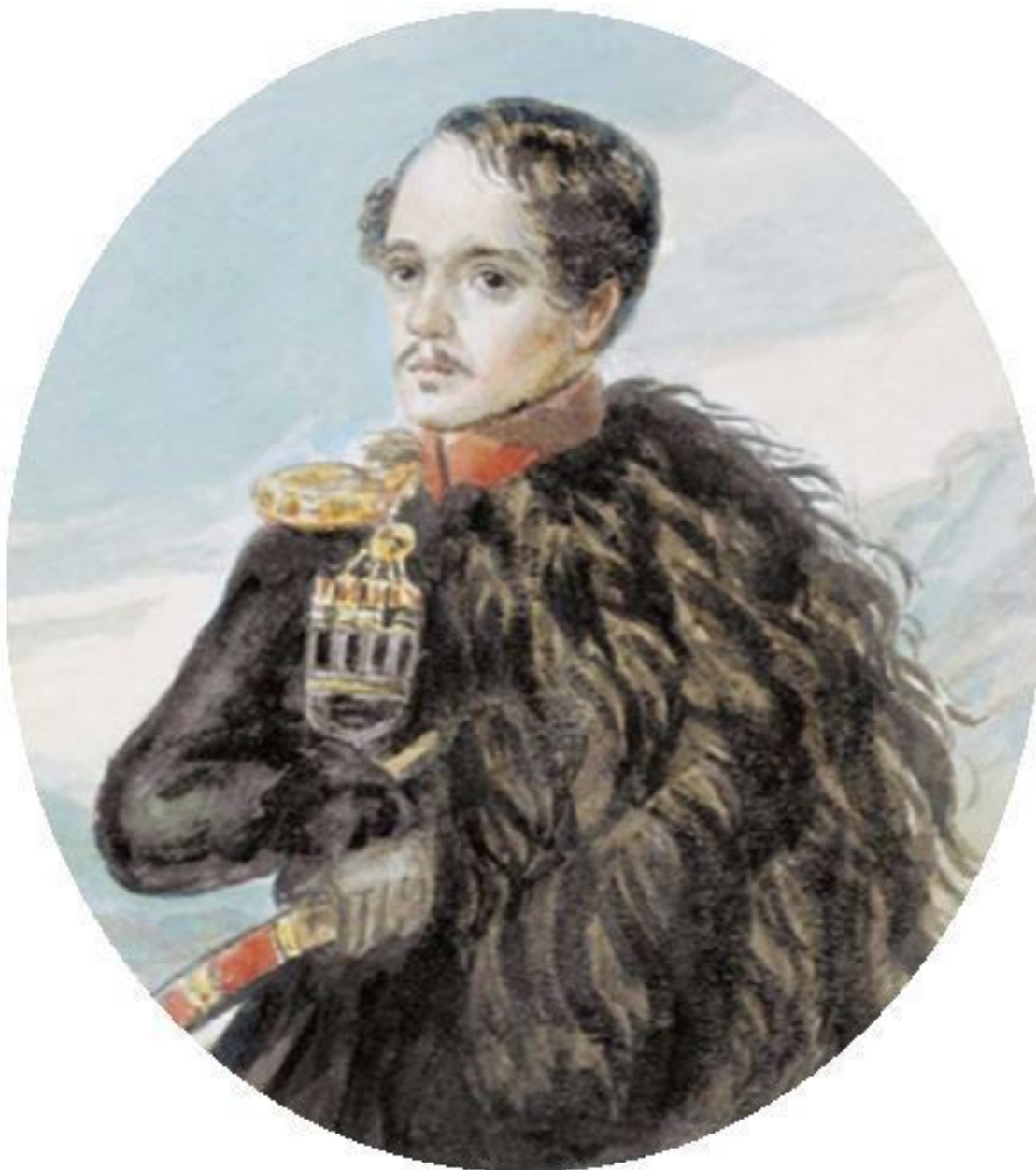
М.Ю. Лермонтов. Автопортрет