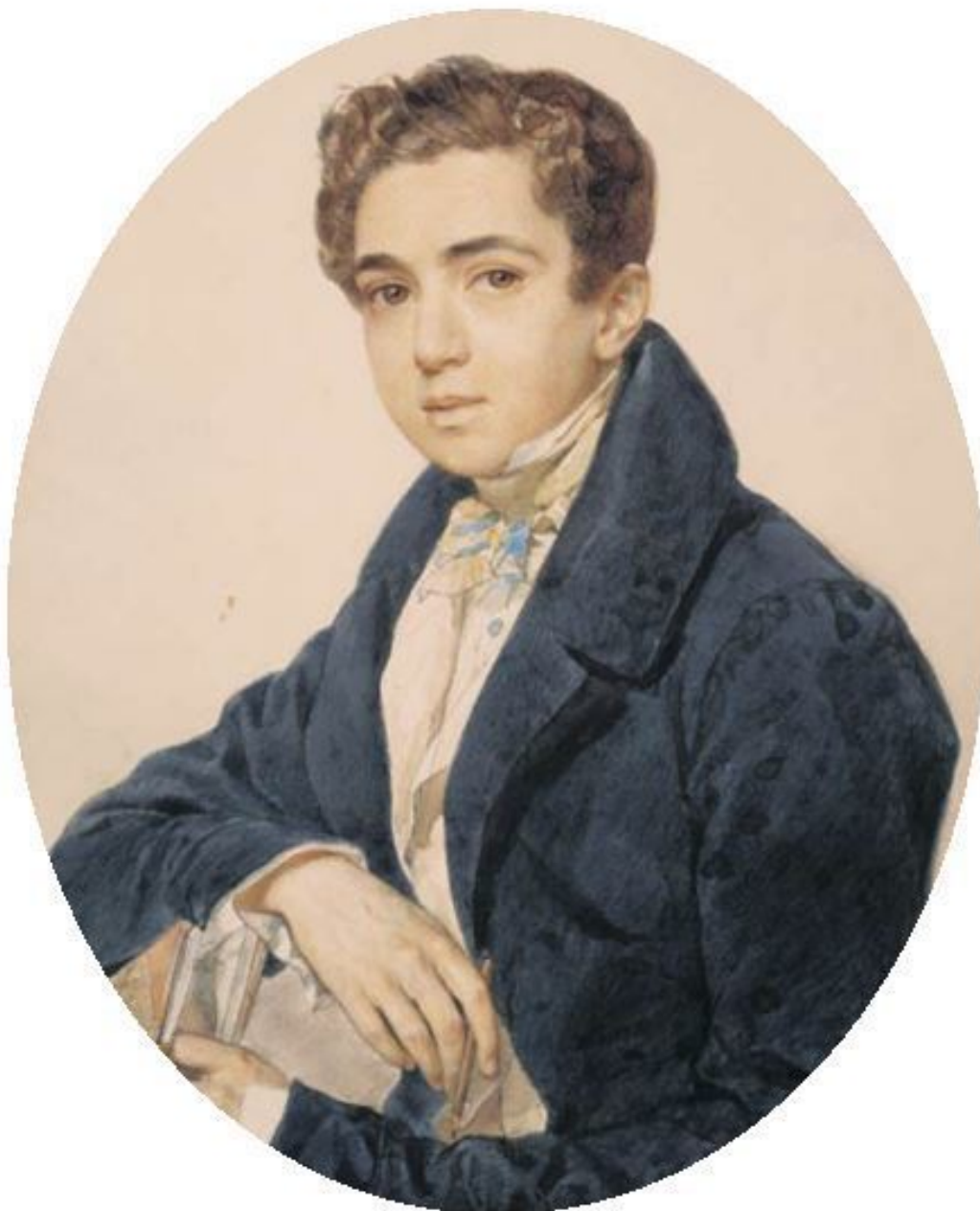
К.П. Брюллов Портрет князя Г.Г. Гагарина