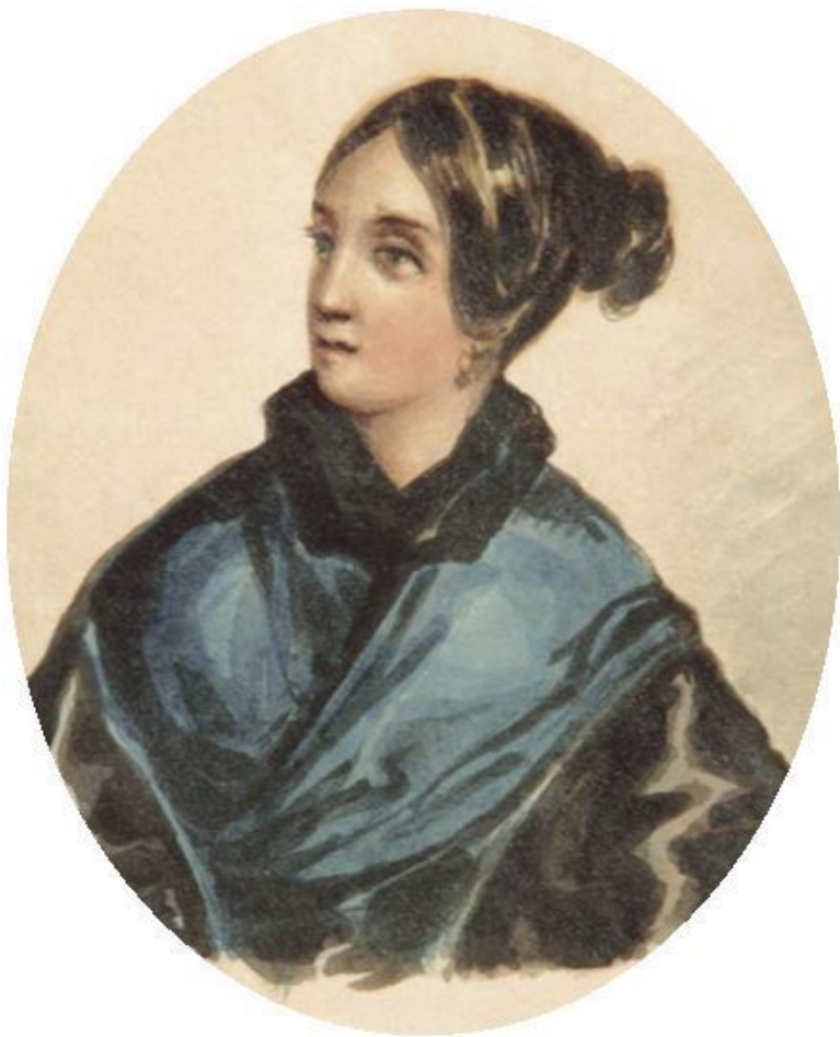
Портрет князя Г.Г. Гагарина