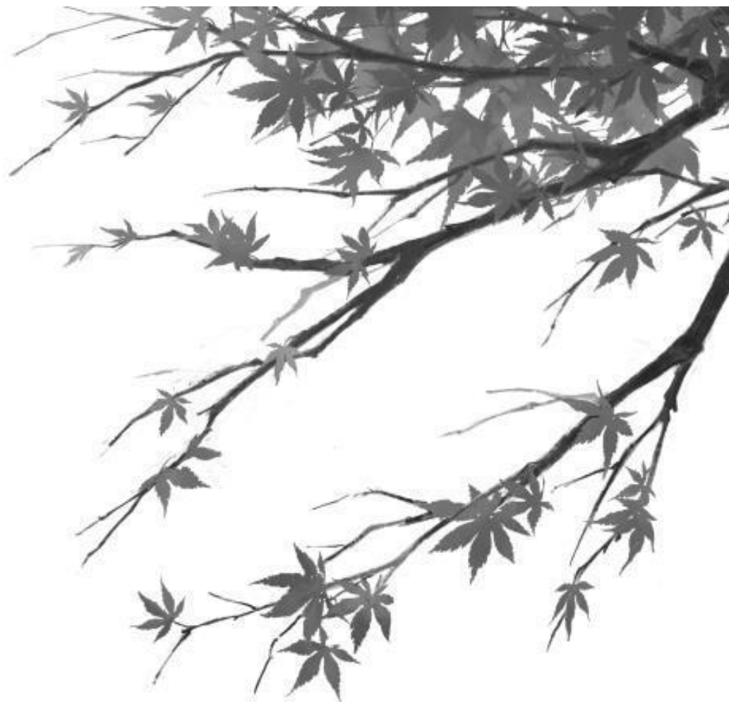
Иллюстрация на обложку – Otraenna