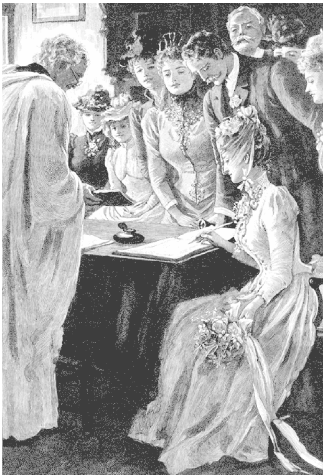
Подписание свидетельства о браке. Рисунок из журнала «Кэсселс», 1890.