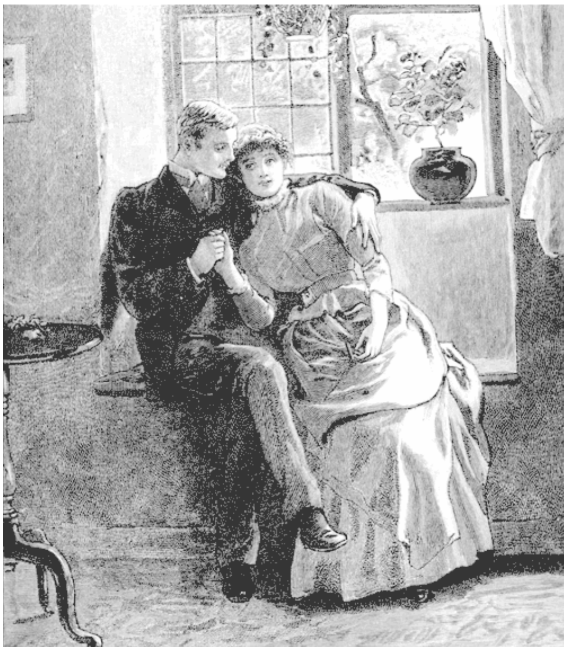
Объятия. Иллюстрация из журнала «Кэсселлс», 1887.

Образованные представительницы среднего класса пытались бороться с вездесущим ханжеством. Так, в 1885 году был сформирован Клуб мужчин и женщин, члены которого обсуждали такие животрепещущие вопросы, как отношения между полами, сексуальность, проституция. Основателем клуба стал Карл Пирсон, математик и сторонник евгеники (науки об улучшении расы и предотвращении вырождения). Не все женщины, примкнувшие к обществу, разделяли его взгляды, скорее уж им хотелось поговорить о сексуальности в спокойной обстановке, не краснея и не бормоча себе под нос. Среди дам, посещавших дебаты, была известная в те годы писательница Оливия Шрайнер, уроженка Южной Африки, в романах которой часто поднимается тема бесправия женщин.