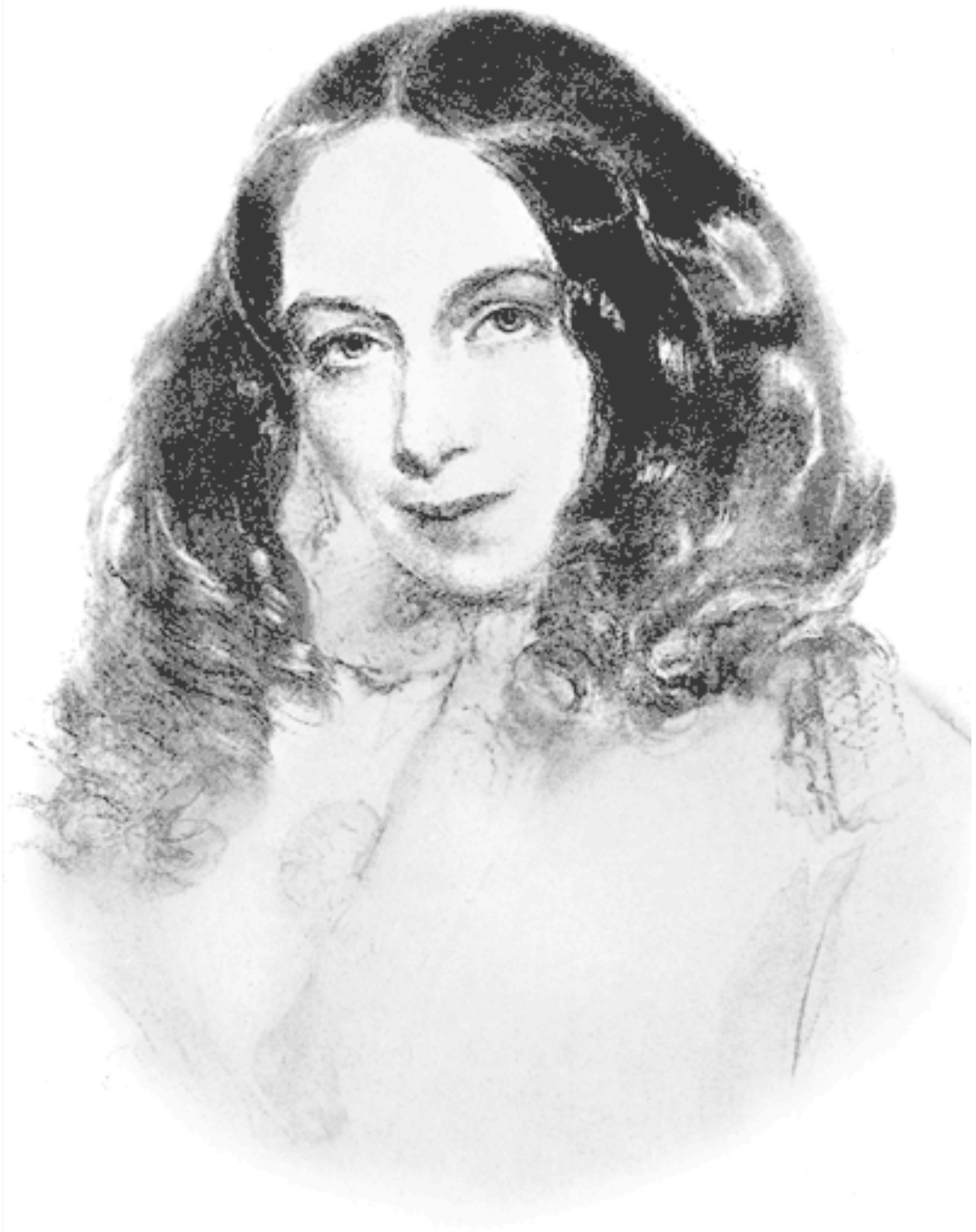
Элизабет Барретт Браунинг.

В 1840-х Лондон был очарован стихами загадочной поэтессы, которая, по слухам, была прикована к постели и не выходила из дома. Заинтересовался ею и начинающий поэт Роберт Браунинг, тем более что Элизабет несколько раз лестно отзывалась о его творениях. Между коллегами завязалась переписка, и в 1845 году они наконец встретились. Элизабет приняла