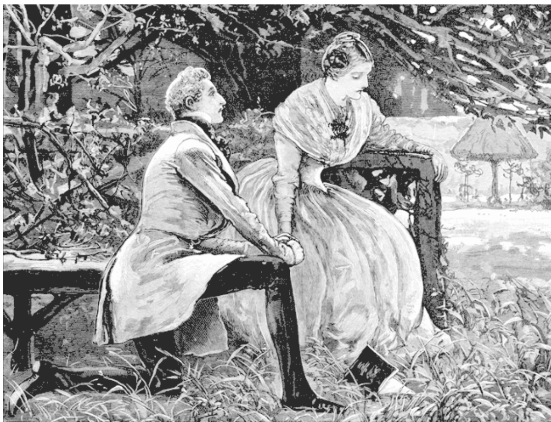
Предложение руки и сердца. Рисунок из журнала «Иллюстрированные лондонские новости», 1884.

Хотя идеалом брака был союз любящих сердец, огромную роль в выборе партнера играла классовая принадлежность. Книга советов «Этикет любви, ухаживаний и брака» (1847) утверждала: «Женщины не поднимают мужчину до того положения, которое она занимала до брака, а опускается на его уровень. Однако мужчина поднимает женщину за собой, как бы низко она ни стояла ранее» . Забавно, что подобные книги описывали все что угодно, аккуратно обходя главную тему – любовь. «Оставим ее писателям, поэтам и моралистам» , – писалось в подобных справочниках, и разговор вновь возвращался к хорошим манерам. «Этикет любви, ухаживаний и брака» ясно дает понять: любовь – вещь серьезная и обдуманная и не имеет ничего общего с кокетством, флиртом и прочими «ошибочными представлениями» , которые девушки могли почерпнуть в «неестественной философской системе, представленной в сентиментальных романах» .