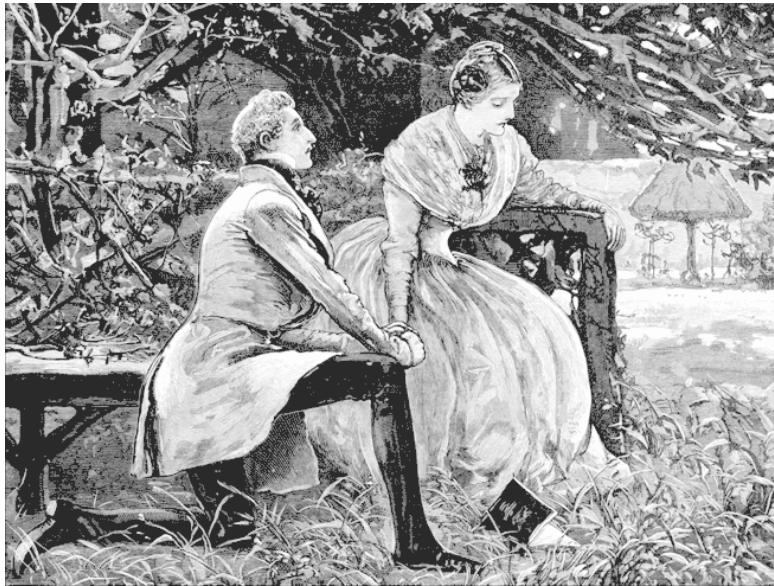
Предложение руки и сердца. Рисунок из журнала «Иллюстрированные лондонские новости», 1884.

Со всех сторон влюбленных настраивали против тайных браков. Прежде чем сделать свой свободный выбор, им настоятельно рекомендовалось спросить совета у родителей. Ведь леди «встретив кавалера на балу или на другом общественном мероприятии, видит все в розовых красках», и ей крайне необходим «совет и внимательное отношение к ее чувствам», которые может обеспечить только мать. Роди-