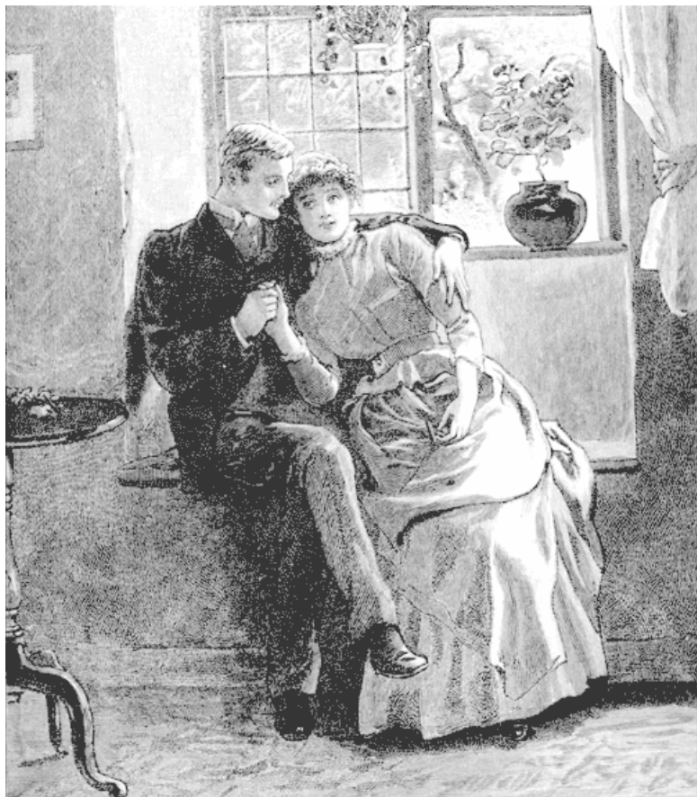
Объятия. Иллюстрация из журнала «Кэсселлс», 1887.