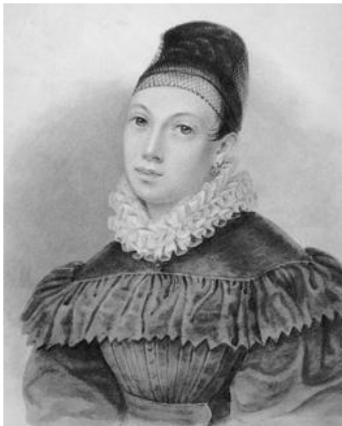
Н. А. Бестужев. Е. П. Нарышкина. 1832 г.

В Нерчинске, небольшом поселке рядом с рудниками, где работали каторжники, она встретила с Марией Волконской – дочерью генерала Раевского, прославленного героя Отечественной войны 1812 года. Некогда Пушкин посвящал ей стихи... Все это осталось в прошлом. Она отправилась в дорогу из Петербурга 21 декабря 1826 года, в канун Нового года, полубольная, перенесла тяжелые роды. В ночь перед отъездом ее невестка Зинаида, зная страсть Марии к музыке, пригласила в дом лучших итальянских певцов, и Мария все никак не могла их отпустить. «Еще, еще, подумайте, ведь я больше никогда не услышу музыки», – просила она. Ей только-только исполнилось 20 лет.