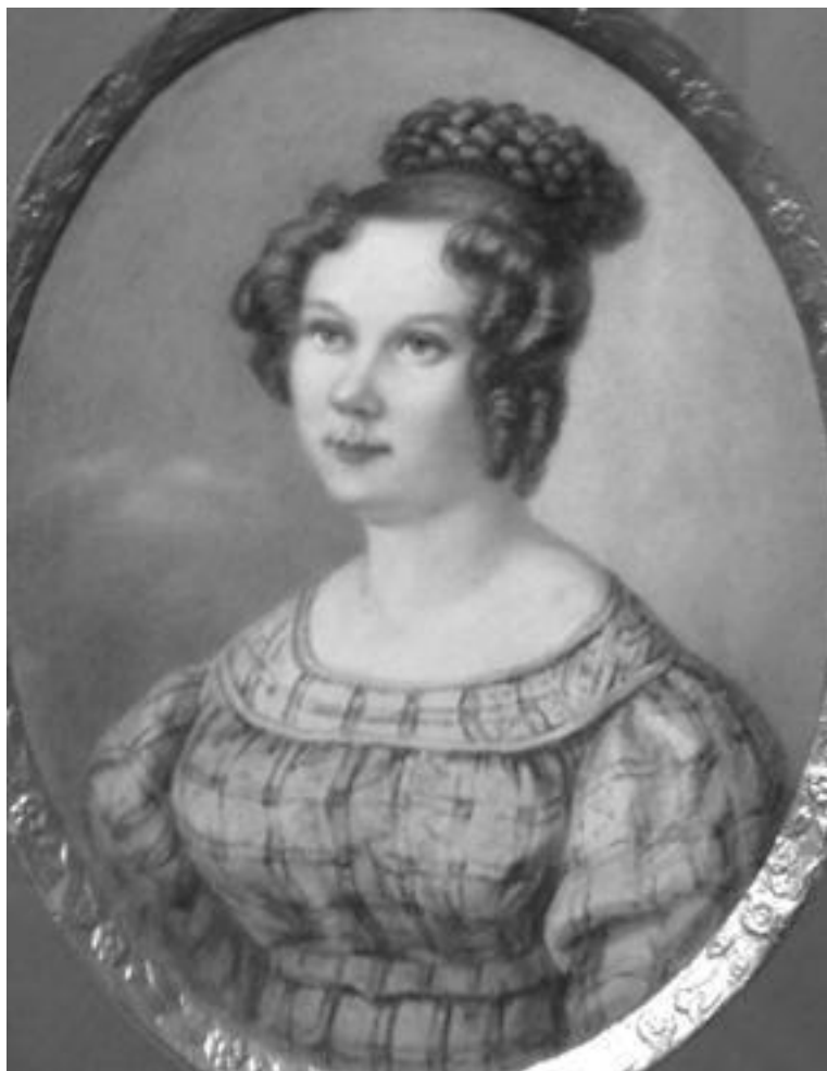
Н. А. Бестужев. Е. И. Трубецкая. 1828 г.