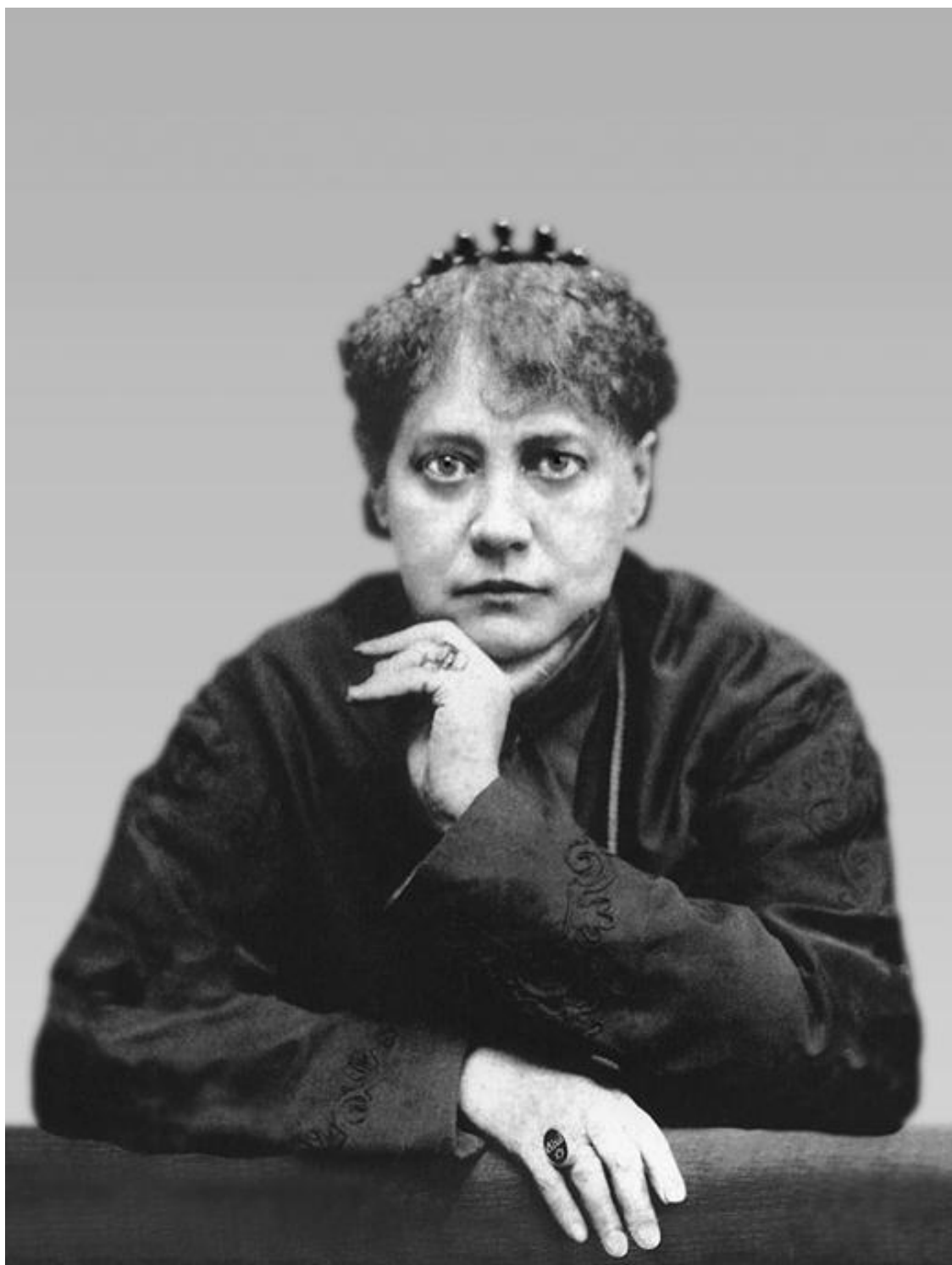
Елена Петровна Блаватская

В эпоху, когда транспортные коммуникации не были развиты так, как сейчас, Елена Петровна объезжает чуть ли не весь мир, терпит два серьезных кораблекрушения, участвует в сражениях за освобождение Италии и получает тяжелые ранения, несколько раз заболевает странными, неизвестными болезнями, грозившими ей смертью, да и вообще нередко оказывается между жизнью и смертью и всегда чудом спасается. Ей удастся проникнуть в Тибет, прожить там несколько лет, получить удивительные познания и стать ученицей Великих Учителей – Махатм Мудрости, чтобы потом вернуться в «западный мир», передать ему давно забытые учения и вновь рассказать о существовании Братства Мудрецов, хранителей этих учений,