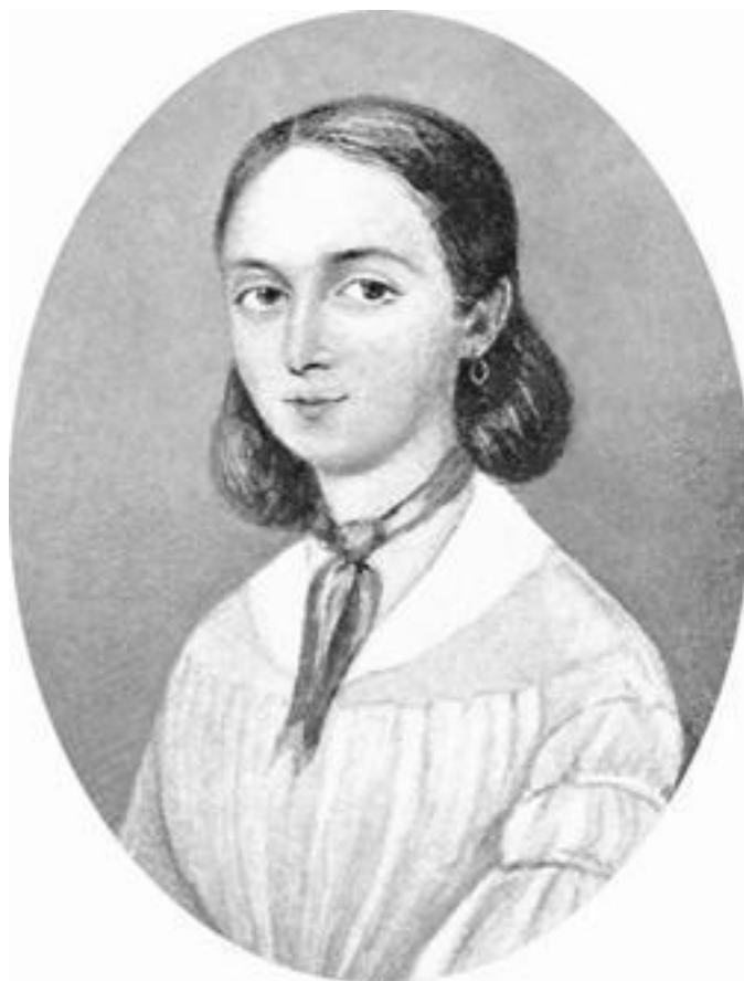
Елена Андреевна Ган (Фадеева) (1814–1842)

Например, философия говорит о чрезвычайной важности таких периодов жизни, как детство и юность. Именно в это время могут проявиться богатства нашей души и внутреннего мира, спящие в нас загадочные потенциалы, стремления и таланты, вокруг которых будут строиться наше предназначение и весь наш жизненный путь, – но только если рядом будут чуткие родители, воспитатели или близкие, которые смогут все это увидеть и оценить. Елене Петровне повезло, но оттого ей не было легче... Она родилась в ночь на 12 августа (по старому стилю 31 июля) 1831 года в Екатеринославе – городе, основанном графом Потемкиным на Днепре, в землях Новороссии, – где служил ее отец. Она происходила из русской аристократической семьи, но никогда не любила говорить о своей весьма примечательной родословной.