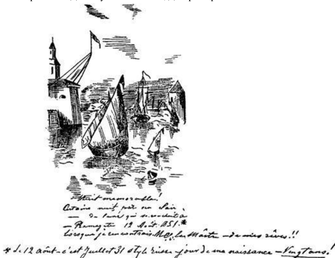
Рисунок Е. П. Блаватской из записной книжки

Юная Блаватская с матерью. Автор картины, предположительно, сама Елена Петровна. Оригинал хранится в Доме-музее Блаватской, Днепропетровск