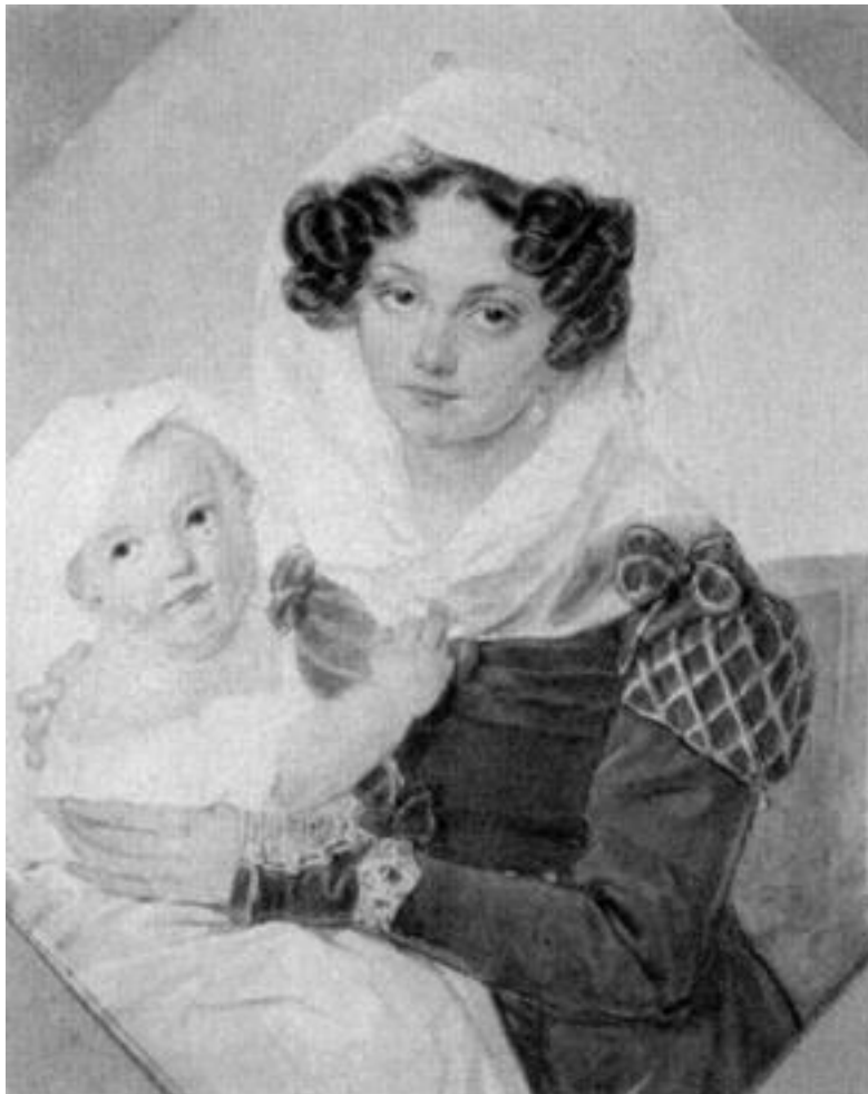
П. Ф. Соколов. Портрет М. Н. Волконской с сыном Николенькой. 1826 г.

Все разрушилось в один миг: ее муж, Сергей Трубецкой, был лишен всех чинов, заслуг, званий и приговорен к каторжным работам на рудниках и пожизненной ссылке. На второй день после того, как Сергея в кандалах отправили по этапу, Екатерина поехала за ним в далекую Сибирь. Граф Лаваль страшно беспокоился за дочь и умолил ее хотя бы взять провожатого, однако тот вернулся, заболев, с полдороги, а молодая женщина продолжила путь одна.