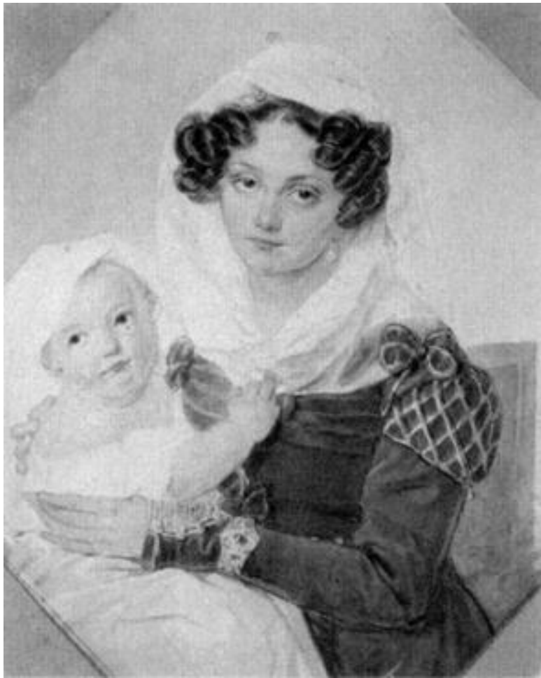
П. Ф. Соколов. Портрет М. Н. Волконской с сыном Николенькой. 1826 г.