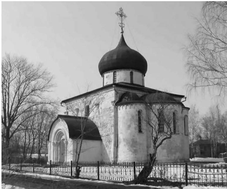
Георгиевский собор в Юрьеве-Польском