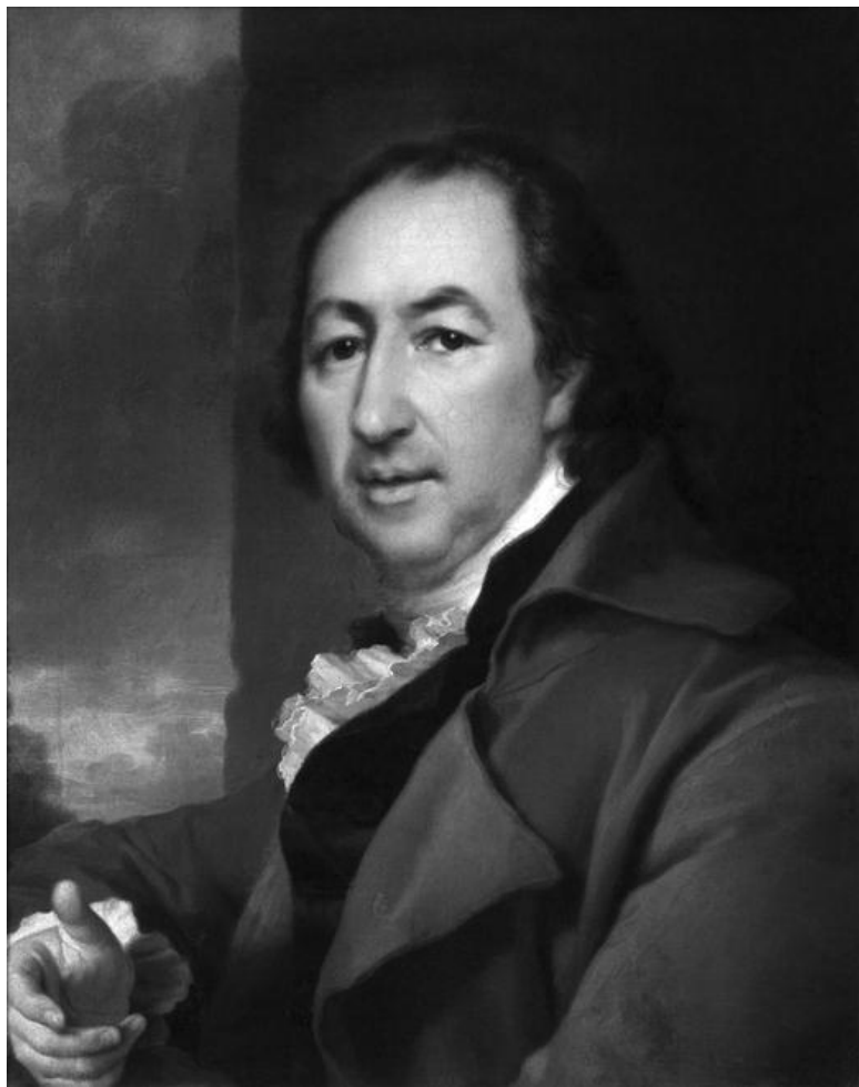
Д. Г. Левицкий. Портрет Н. И. Новикова. 1797 г.