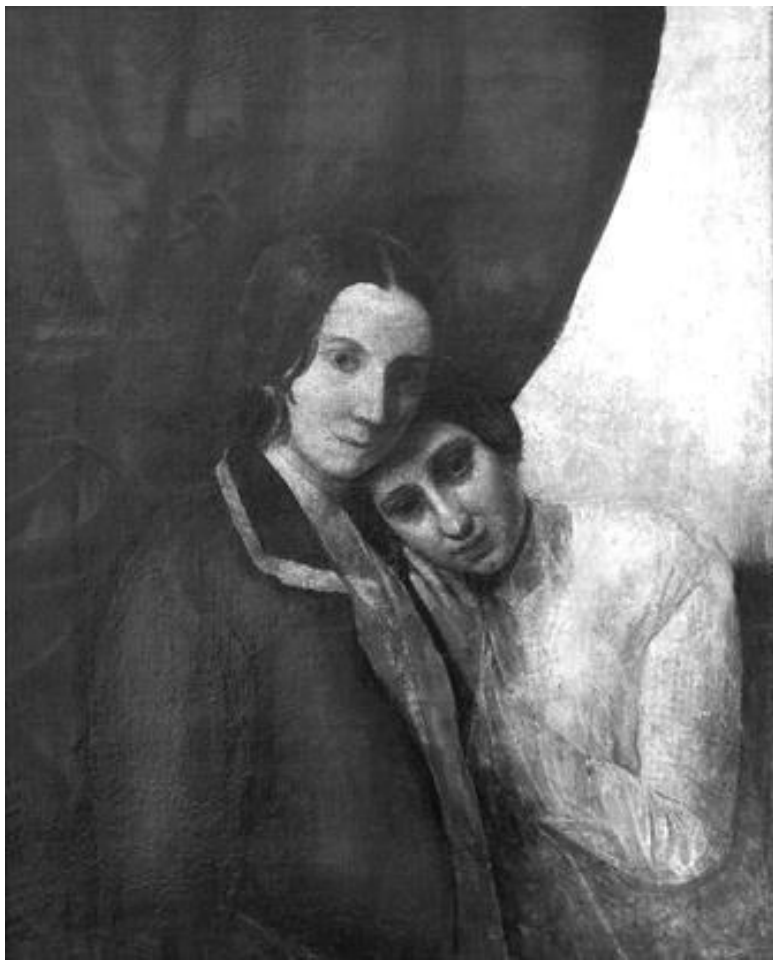
Юная Блаватская с матерью. Автор картины, предположительно, сама Елена Петровна. Оригинал хранится в До-