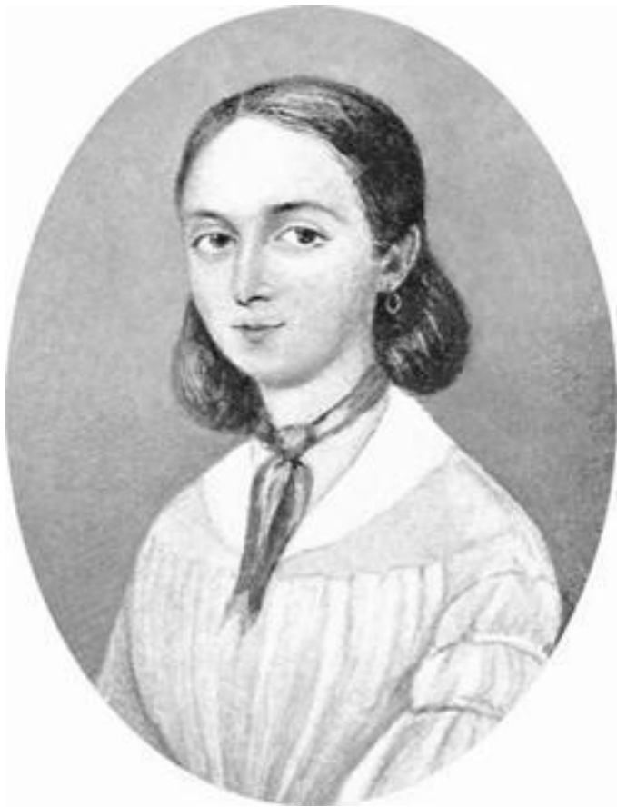
Елена Андреевна Ган (Фадеева) (1814–1842)

Например, философия говорит о чрезвычайной важности таких периодов жизни, как детство и юность. Именно в это