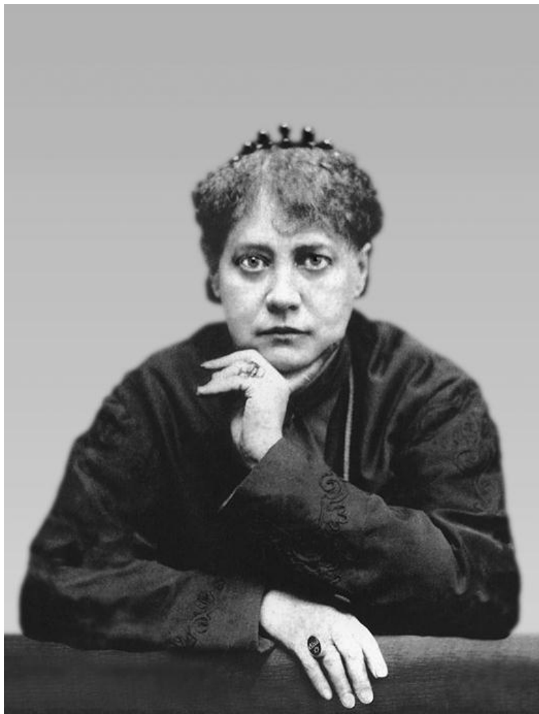
Елена Петровна Блаватская