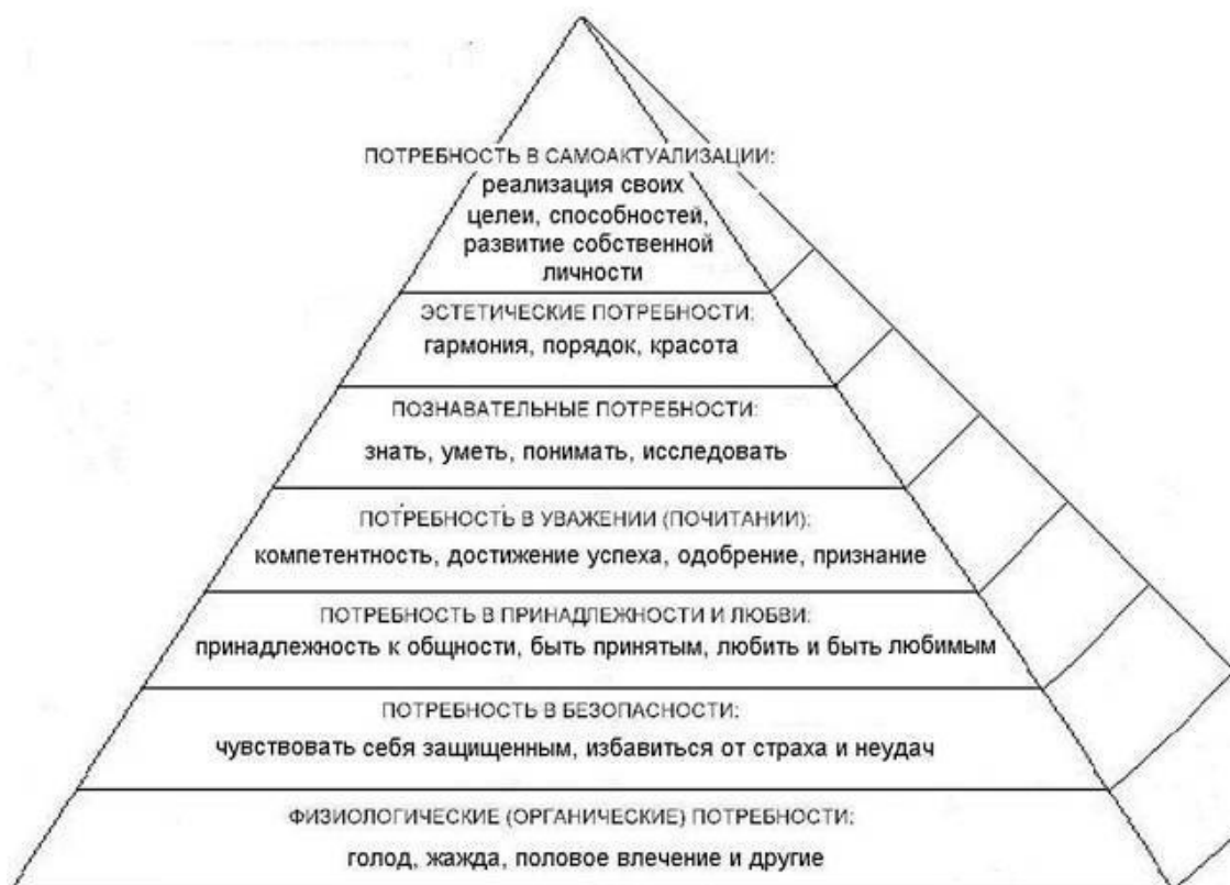
Пирамида потребностей по Маслоу

Итак, Человек живет. Он ест, спит, дышит, болеет, занимается спортом, сексом, а еще он работает, старается любить свою семью, воспитывает детей, покупает машины, квартиры, строит дом, поднимается вверх по карьерной лестнице, и много еще чего делает. Все, описанное мной, находится на первых четырех ступенях «пирамиды Маслоу» – это пирамида потребностей, которые есть у каждого человека, но не каждый поднимается выше. Наверное, Вы согласитесь, что когда человеку надо каждый день думать о хлебе насущном, то ему не до карьеры или какого-то там уважения. А те люди, которые многого добились в жизни, и вроде бы у них все есть для счастья: дом, семья, работа и даже, скорее всего, руководящая должность, вот как раз такие люди и попадают в «зону риска». У них начинаются вопросы . А начинаются вопросы тогда, когда этот вроде бы успешный человек доходит до так называемой точки - « кризис смысла жизни ». Давайте разберем подробнее, как это происходит. Сразу оговоримся, что он возникает у тех, кто застрял на 3 – 4 ступени той самой пирамиды Маслоу. Давайте вспомним, что это за пирамида и какие потребности, и в каком порядке она освещает, какое поведение на каждом этапе объясняет.