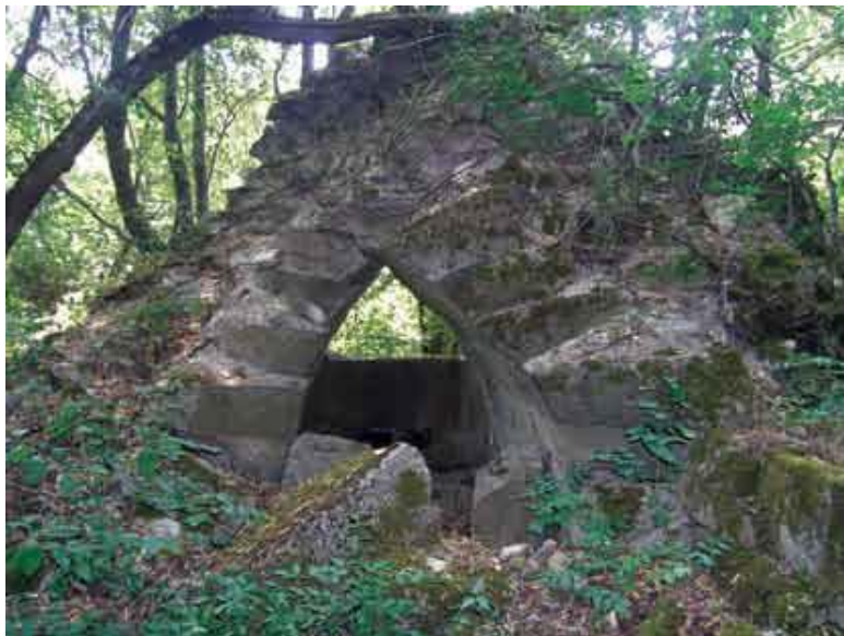
Руины одной из башен Горной стены.

В сведениях восточных авторов обозначены основные противники, против которых был возведен и противостоял Дербентский оборонительный комплекс. Причем, если в позднесасанидский период (VI-сер.VII в.) они представлены, главным образом, объединениями кочевников – это тюрки, хазары, аланы, абхазы (савиры), банджары (булгары), баланджары, то в арабский и последующий периоды (сер.VII–XI вв.), помимо хазар и алан, к ним добавляются русы, начав-