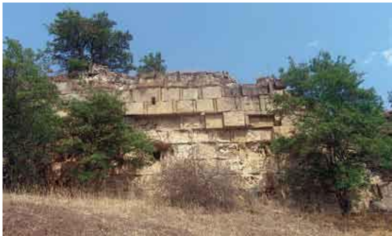
Руины форта Шелкени-кала.

ал-Масуди, Хосров «с внутренней стороны у каждого ворот поселил отдельные племена, чтобы охранять ворота и при- мыкающую часть стены; все это для отражения опасности со стороны народов, живущих по соседству с этой горой, а именно от хазар, аланов, различных тюрков, сарирцев и других неверных».