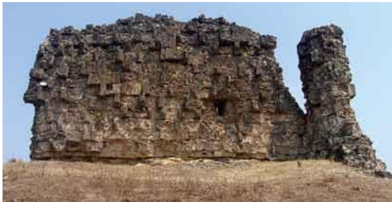
Руины Горной стены у сел. Камах.

Также и «Дербенд-наме», рассказывая о деятельности Хосрова на Восточном Кавказе, сообщает, что «он построил город Сул (т. е. Дербент. – М.Г.) и воздвиг над ним длинную стену, длина которой 92 расстояния (араб, масафа ; тюрк. агач . – М.Г.)». В некоторых арабских и тюркских списках поясняется: «близ Дербента», «в трех агачах от Дербенда». Несомненно, что под этой «длинной стеной» понимается Даг-бары .