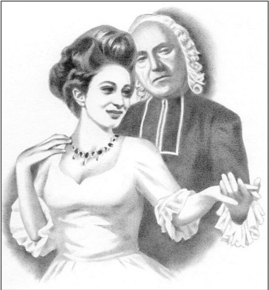
Аббат и княжна

В упадке сил я часто пребываю, Духовного целения моля.