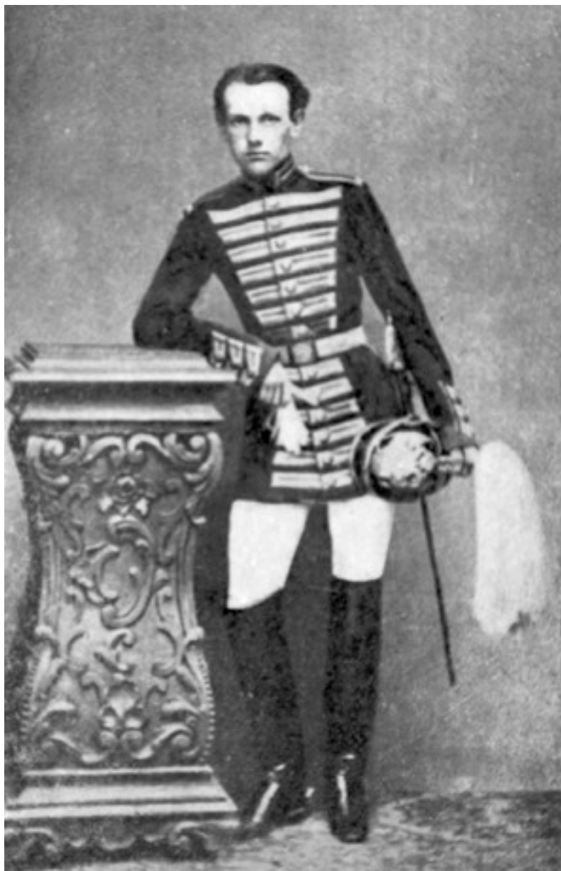
Пётр Кропоткин в Пажеском корпусе