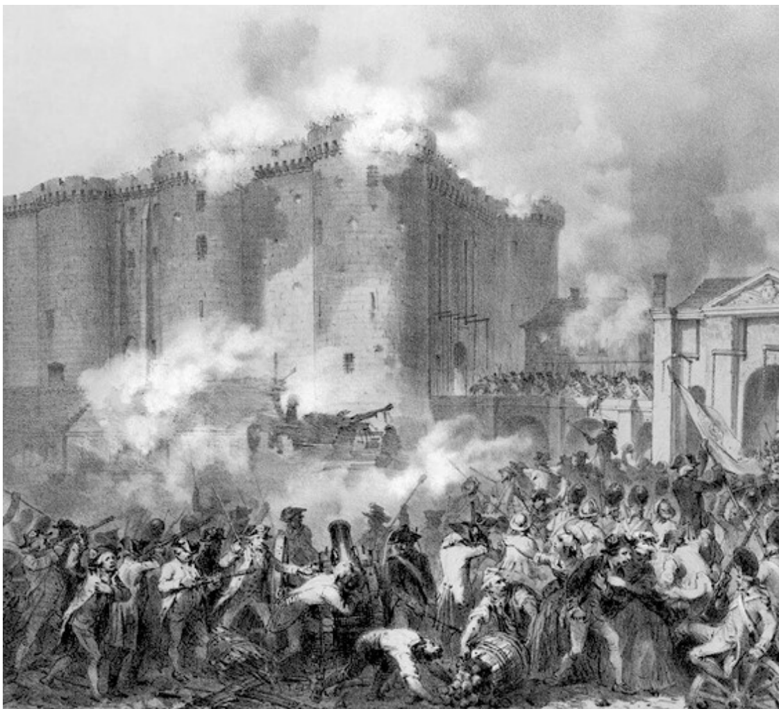
Взятие Бастилии – символ Великой Французской революции