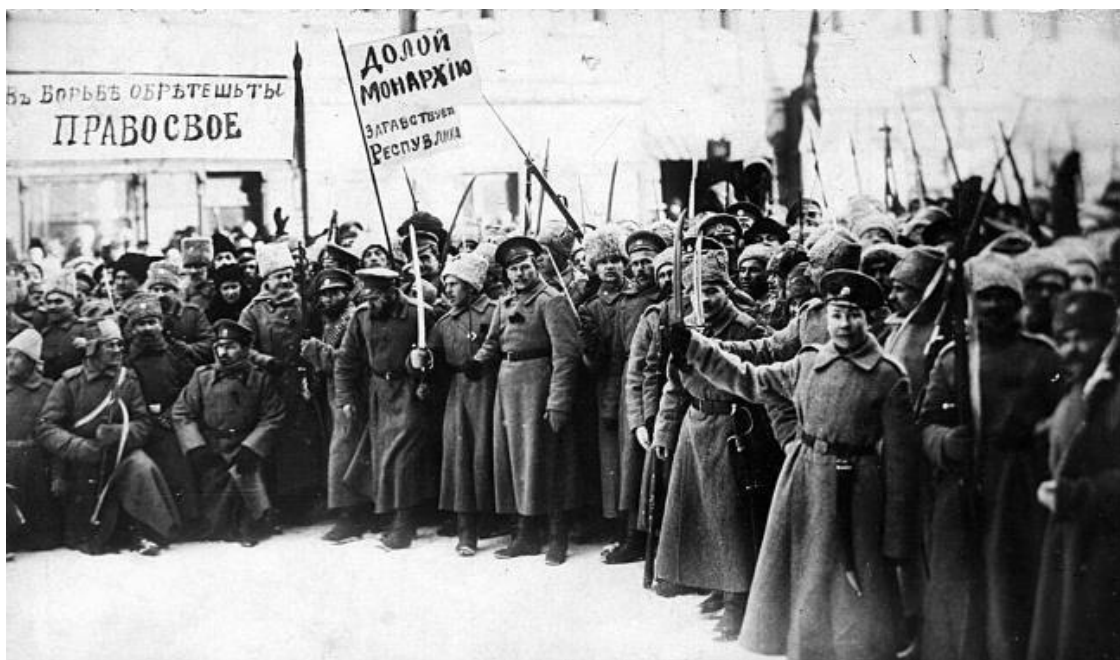
Первые дни Революции

Мы отринули все, что было чисто личным, все, что было делом класса или касты, и стали на мгновение просто людьми, осознающими нашу общую человечность. Это был момент, когда каждый человек соприкоснулся с универсальными и общечеловеческими ценностями. Было очень волнующе видеть вокруг меня этих людей, столь преображенных, работающих вместе с возвышенной преданностью на общее благо. Историки, социологи и теоретики всех мастей учено и мудро опишут события 27 февраля 1917 г. в России, в Петрограде, в Таврическом дворце. Они найдут научное, историческое (и весьма прозаическое) объяснение тому, как сыграл каждый актер в первой сцене этой великой трагедии смерти и возрождения. Они могут называть драму и актеров так, как им заблагорассудится.