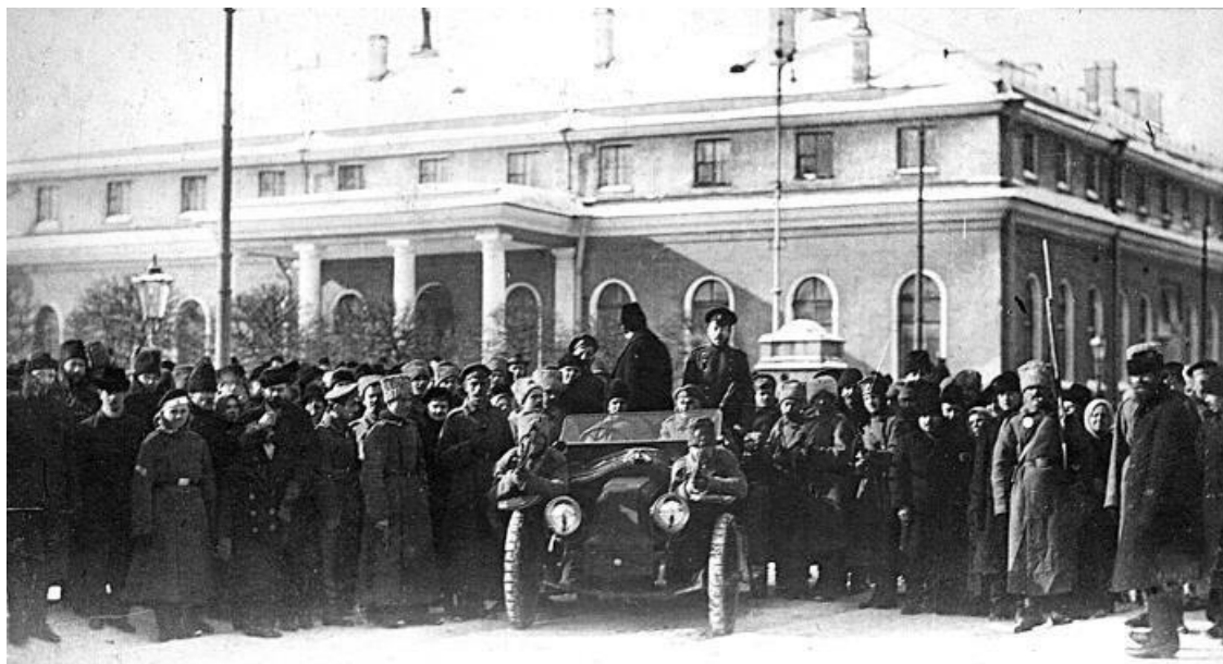
Очередной арестованный доставлен в Думу

Я никогда не забуду атмосферу Таврического дворца в те напряженные критические дни. Всех воодушевлял дух единства, братства, взаимного доверия и самопожертвования, сплавивший всех нас в единое боевое тело. Потом, когда революция победила, когда наш триумф стала очевидной, среди нас все больше оказывалось людей с личными амбициями, людей нацеленных поймать главный шанс их жизни или попросту авантюристов. Но в эти первые два дня и в первую ночь все мы в Думе подвергались серьезному риску. Если требовалось мужество и решимость бежать в Думу сквозь ружейный и пулеметный огонь на улицах, то много силы духа требовалось от людей, проживших жизнь в обычаях и традициях старой России, чтобы всем сердцем повернуться к Революции. Должно быть, им дорого стоило порвать со всем своим прошлым и выступить против всего того, ради чего они жили накануне и без чего, по их мнению, страна не выдержит. Ибо они повернулись против царя, потребовали его отречения и призвали брататься с мятежными войсками. Это было для них очень мучительно, и я ясно видел глубокое страдание и неподдельные слезы тех людей, которые сжигали все, чему они поклонялись, ради спасения России.