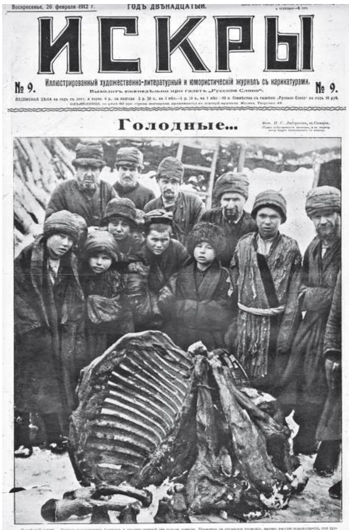
Голодные. Февраль 1912 г.

На фото – группа голодающих башкир у скелета павшей от голода лошади. Село Медведка (ныне – Оренбургская область). «Несмотря на страшное зловоние, – говорится в тек-