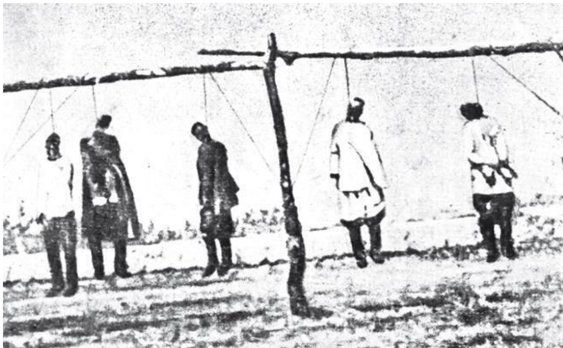
Знаменитые «столыпинские галстуки». Военно-полевой суд в действии