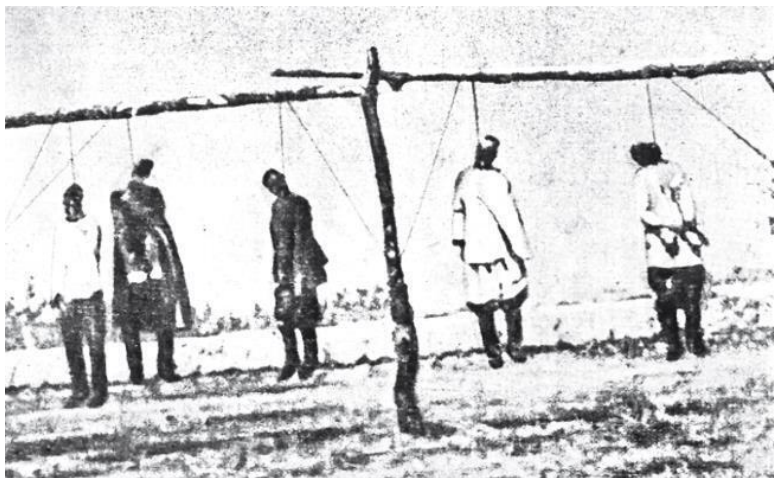
Знаменитые «столыпинские галстуки». Военно-полевой суд в действии

Утром 28 октября бунтовщики разграбили и сожгли имения помещицы Бон (Червяковой), находившееся в 320 метрах от железнодорожного разъезда Платицинский (возможно, Софьино), и Дружинина, имение которого располагалось близ деревни Песковатки. Всего зерном и мукой загрузили 500 подвод. Кроме того, из господских конюшен безлошадным крестьянам раздали лошадей. В имении Бон бунтовщики также захватили много огнестрельного оружия. Разграбление имения Бон происходило на глазах шестерых солдат, присланных для охраны разъезда. Солдаты хотели дать по бунтовщикам залп, однако им запретил это делать ун-