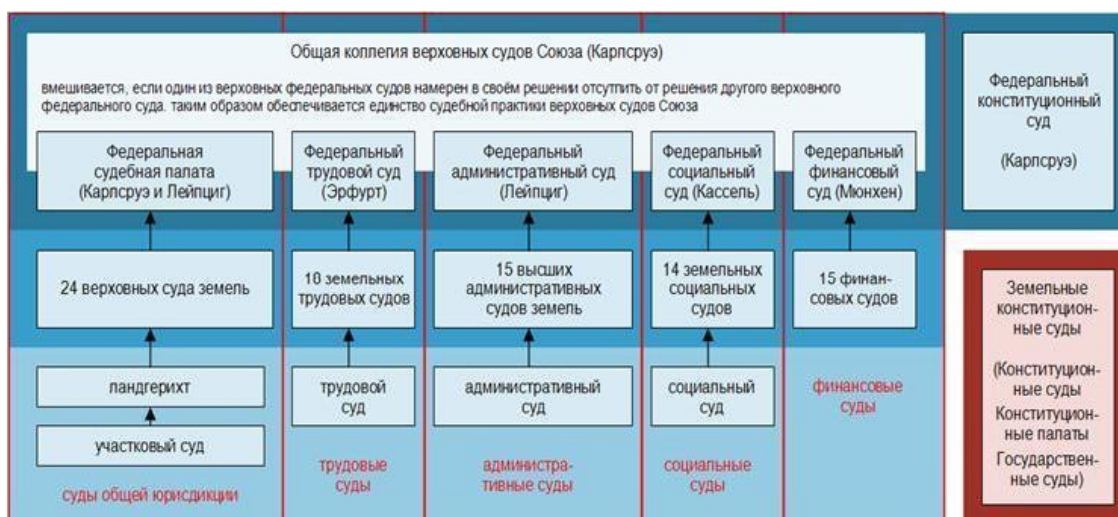
Рис. 3. Германия. Судебная система. Политический атлас. http://www.pe-a.ru/de/courts )