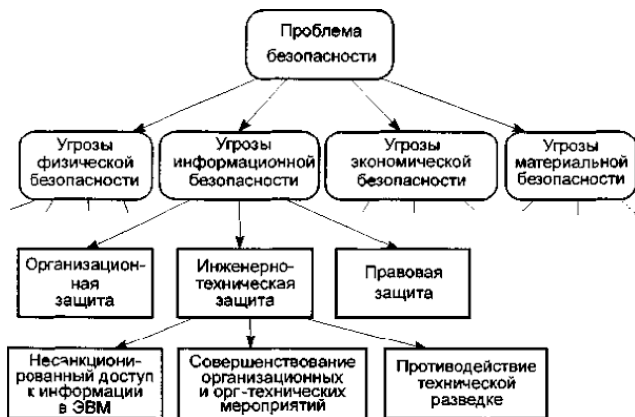
Рис 1. Проблемы и направления обеспечения безопасности

зование ЗЛ средств вычислительной техники, что породило новый вид преступлений – компьютерные преступления, т. е. несанкционированный доступ к информации (НСД), обрабатываемый в ЭВМ.