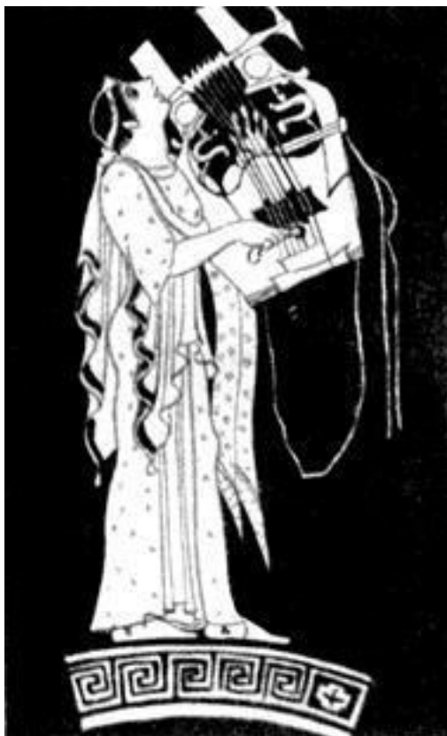
Аполлон с кифарой.