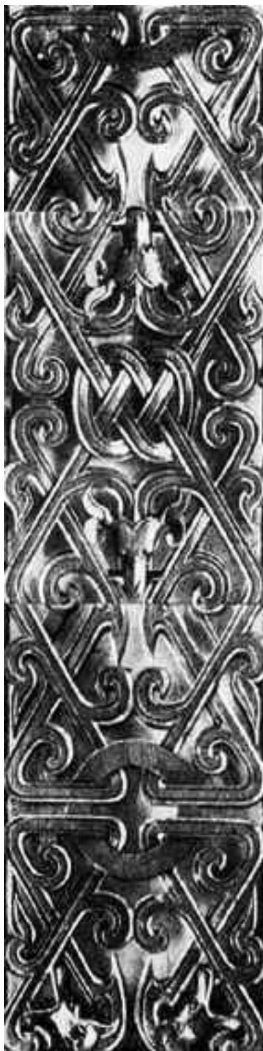
Резная деревянная решетка, эпоха Враждующих царств

Междоусобицы несколько не помешали, а напротив, усилили развитие страны. В сражающихся царствах разрастались старые города и возникали новые, формировались центры оружейного дела, шелкоткачества и производства керамики. Философы активно углублялись в исследования, выдвигая теории идеального человека, гуманного правителя; самые утонченные умы погружались в сферу истории, музыки, поэзии, рисования красками на шелке. Именно тогда возник знаменитый «Чжоули» – первый китайский труд по архитектуре.