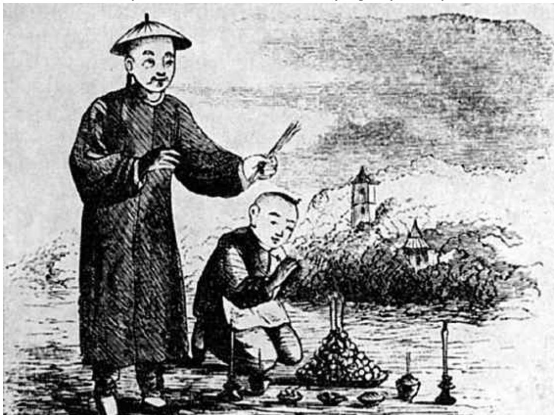
Молодой Конфуций приносит жертву

В середине V века до н. э. одним из таких учителей был Кун Фуцзы, более известный под латинским именем Конфуций. Великий мыслитель, родоначальник одной из трех официальных религий Китая в молодости охранял стада и управлял складами города Цзоу в княжестве Лу. Получив место помощника при совершении жертвоприношений в главном святилище, он оставался на этой должности до 50 лет, пока не занял пост советника при дворе правителя. Однако государственная служба не подходила умудренному опытом старцу, интересовавшемуся только прошлым. Оставив выгодный пост, чиновник Кун Фуцзы преобразился в учителя Куна, оттого что стал обучать всех желающих за очень умеренную плату.