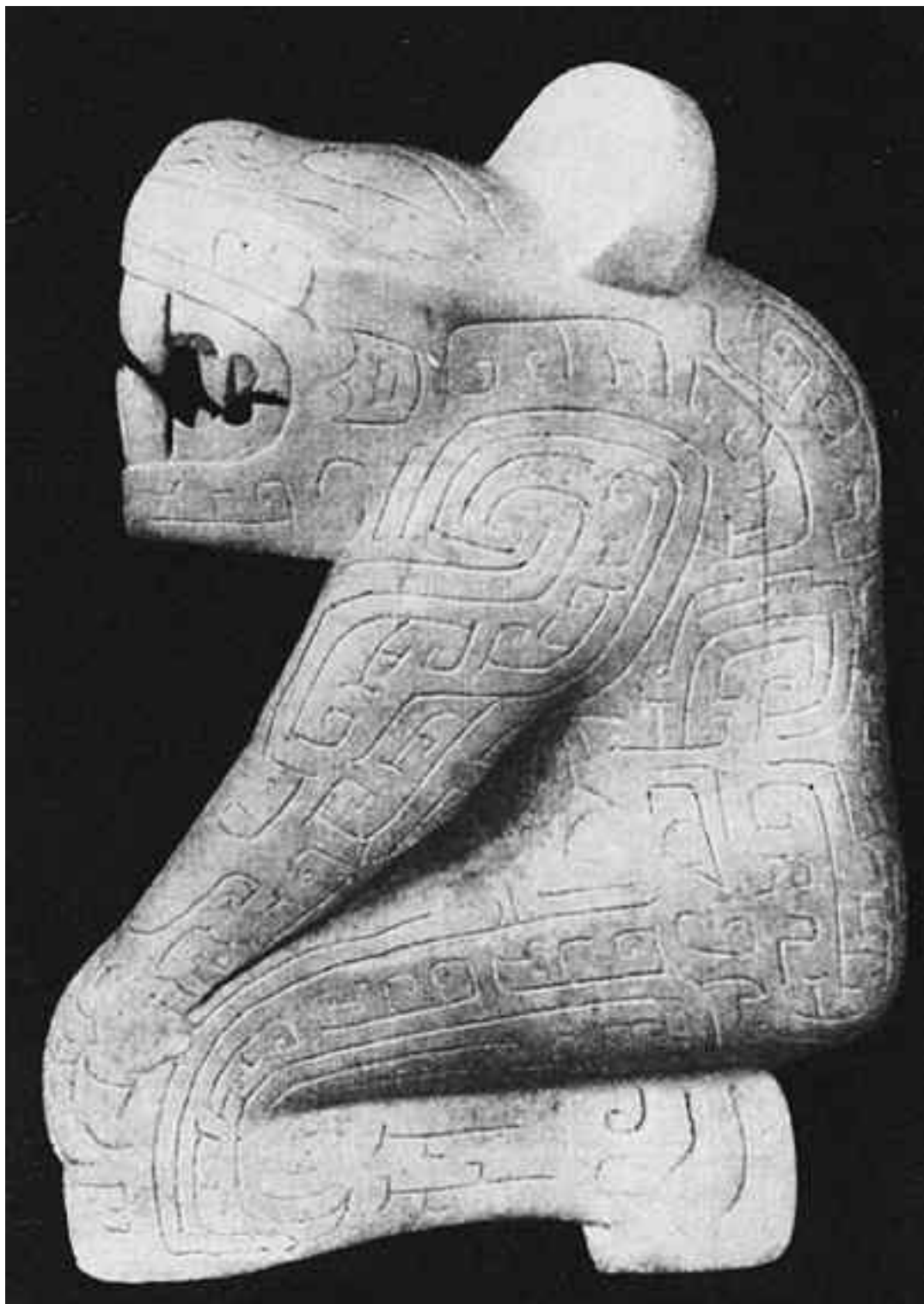
Человек с головой тигра. Мраморная статуя, эпоха Инь

В обширных погребениях города, некогда существовавшего на месте современного Аньяна, найдены великолепные мраморные скульптуры с изображением совы и человека с головой тигра. Выполненные условно, они демонстрируют наблюдательность автора и его умение выразить в реальном образе религиозную идею, связанную с культом предков. «Мы пашем на твоих полях, десять тысяч нас работают попарно...», – записано в древнем трактате Шицзин о самых тяжелых временах в истории Китая. Местным жителям арии отводили участь неволь-