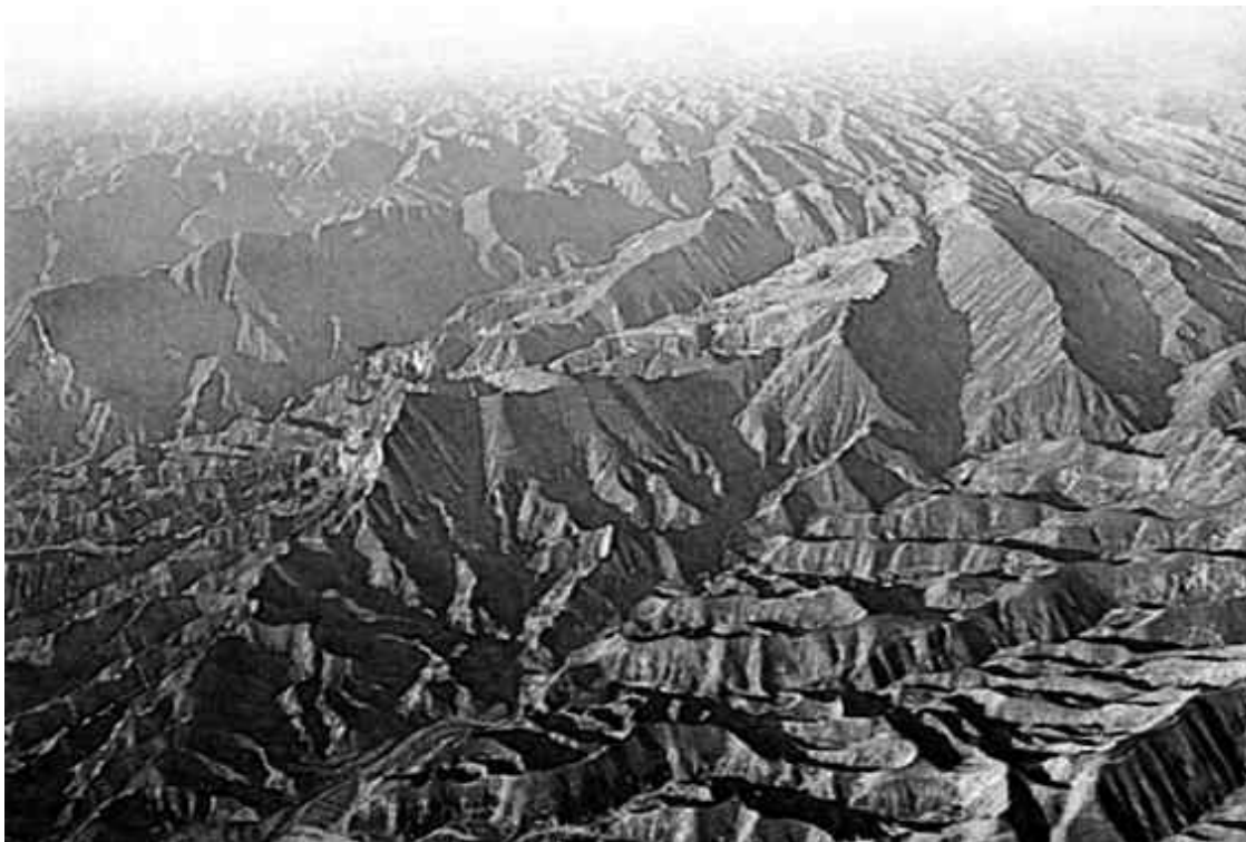
Лессовое плато в северо-западной части Китая

порошок, земля этого края была такой легкой, что «солнце едва просвечивало сквозь поднятую пыль». Дожди смывали грунт в две большие реки – Хуанхэ и Вейхэ, превращая их в мутные желтые потоки.