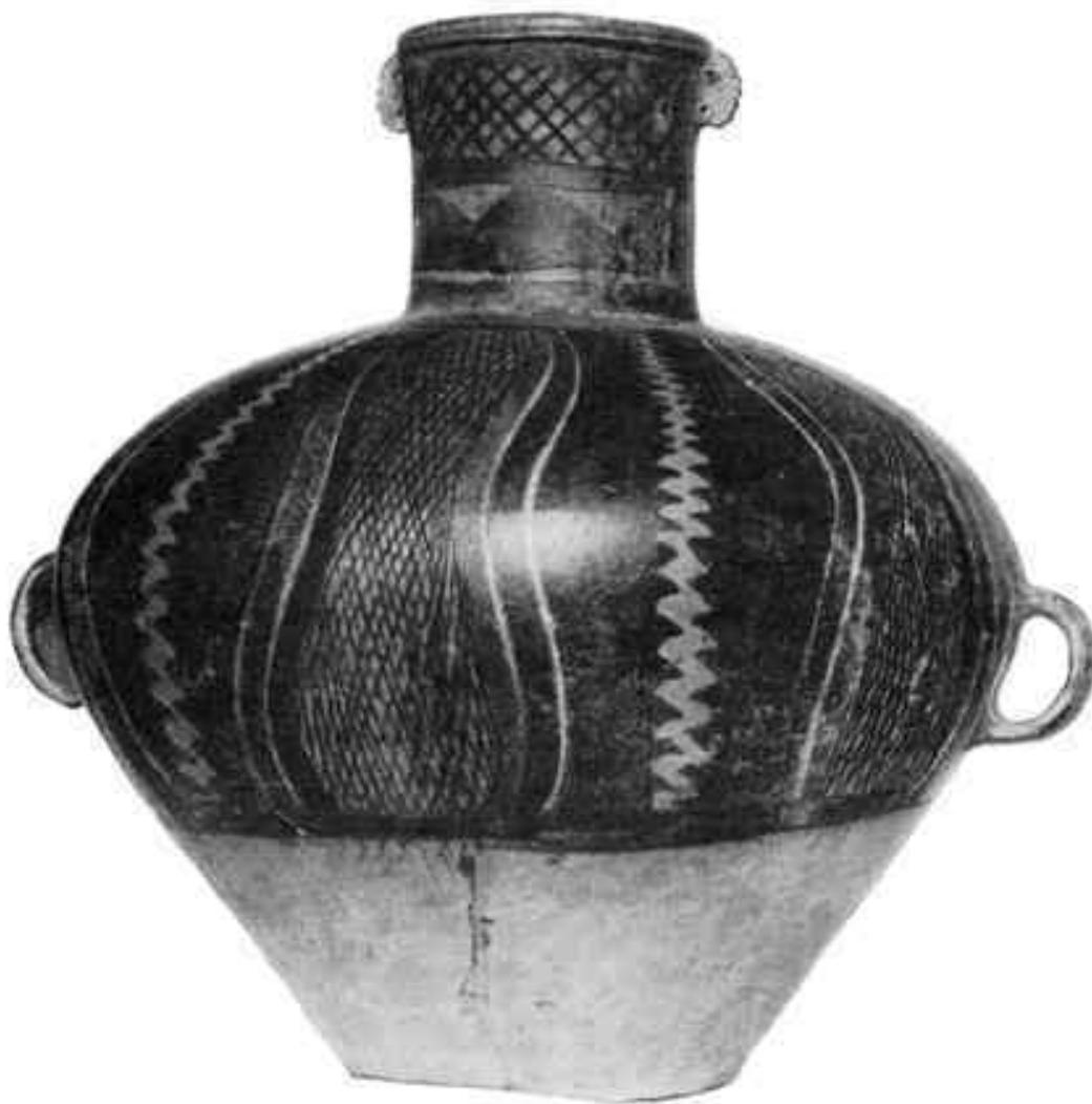
Расписной глиняный кувшин, эпоха неолита

Если верить преданиям, населению Желтой страны пришлось испытать первую большую войну. Против полчищ таинственных великанов с головами буйволов выступило войско под предводительством Хуанди.