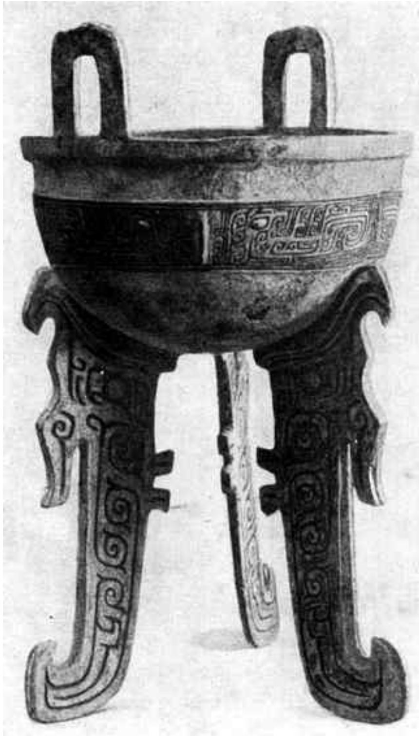
Ритуальный треножник. Бронза, эпоха Инь

Тем не менее коренные жители не просто существовали, а жили, придерживаясь собственных племенных законов. Так же как и раньше, они выбирали старейшин, сообща обрабатывая землю. Однако теперь большую часть урожая вместе с охотничьими трофеями и тканым шелком забирали князья. Рабам запрещалось вкушать пищу господ – молоко и мясо, пить любимый ариями хмельной напиток сома (кит. юй чан). Невольники сидели скрестив ноги, что считалось неприличным у господ, которым надлежало опускать свои благородные зады на