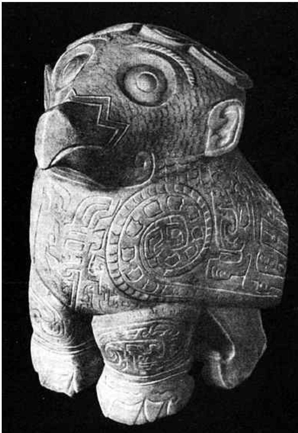
Сова. Мраморная статуя, эпоха Инь