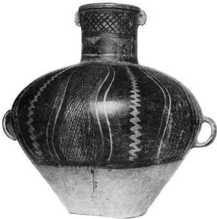
Расписной глиняный кувшин, эпоха неолита

Если верить преданиям, населению Желтой страны пришлось испытать первую большую войну. Против полчищ таинственных великанов с головами буйволов выступило войско под предводительством Хуанди.