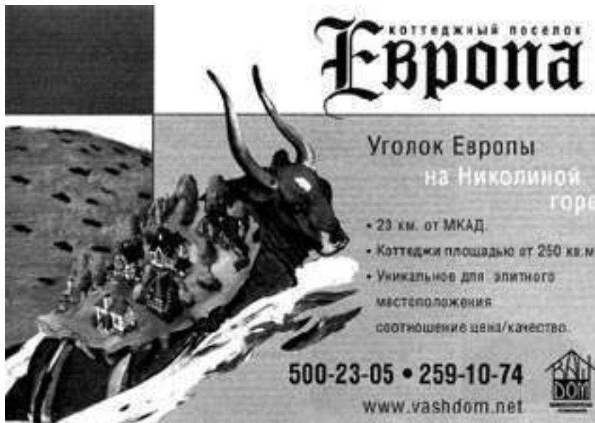
Иллюстрация 2. Реклама для потребителей-«европейцев»

На иллюстрации 2 – объявление для тех, кто в определенной степени хотел бы ощущать себя европейцем.