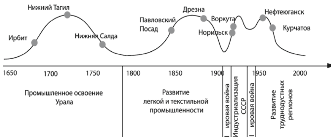
Рис. 1. Периоды развития монопрофильных городов.

никновение и развитие монопрофильных поселений в России обусловлено экономико-политическими и научно-техническими реалиями того или иного исторического периода (рис. 1).