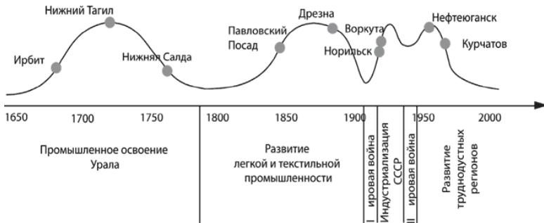
Рис. 1. Периоды развития монопрофильных городов.

Начало первой волны создания монофункциональных городов, по мнению авторов [12], относится к XI веку. Именно тогда Новгород выступает инициатором активной колонизации Северо-Востока, носившего в те времена название Заволочья, богатого пушниной, рыбой, солью, моржовой костью, жемчугом. Новгородцы возводили города – Вологду и Тотьму. Главным опорным центром новгородского влияния была Вологда, основанная в 1147 г. В XIII веке усиление Московского княжества, стремившегося расширить свое присутствие на Европейском Севере, обусловило ухудшение конкурентной среды для Новгорода. Вологда переориентировалась на обслуживание московских связей. Большую роль в московской колонизации Севера сыграл Устюг, основанный в начале XIII века и служивший форпостом для Москвы в борьбе с Новгородом. Великий Устюг главенство-