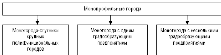
Рис. 3. Типология моногородов.

Выделяются несколько типов моногородов по структурным особенностям (рис. 3).