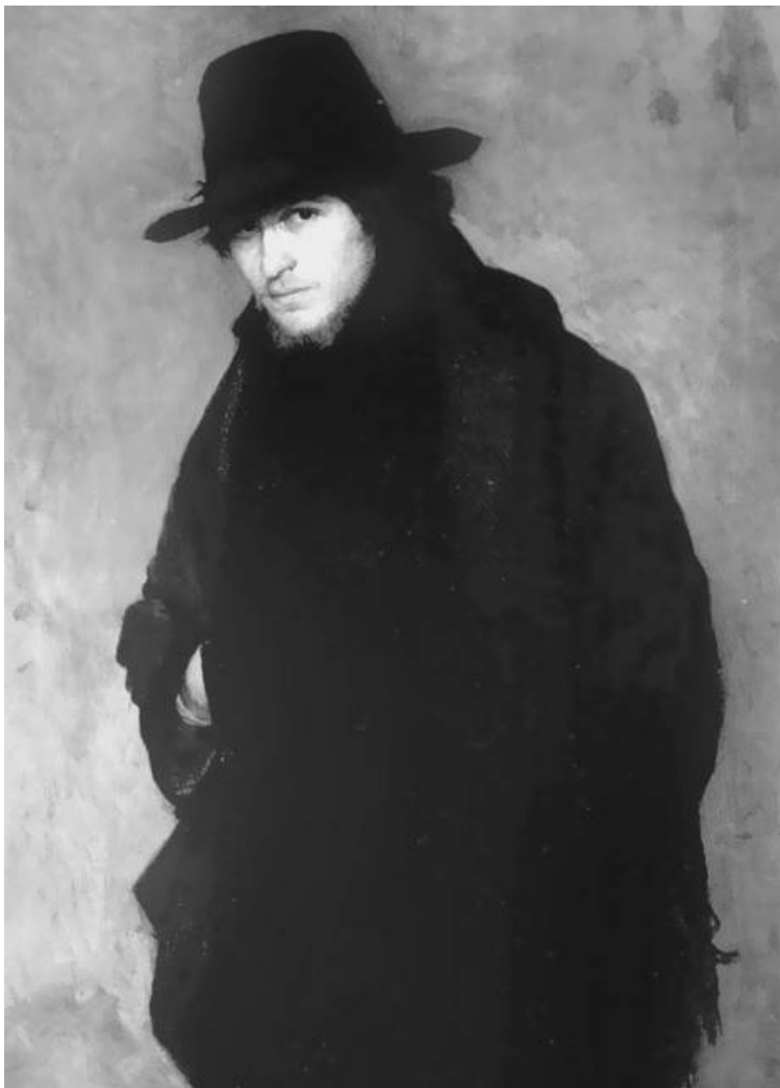
Студент. Художник Н.А. Ярошенко