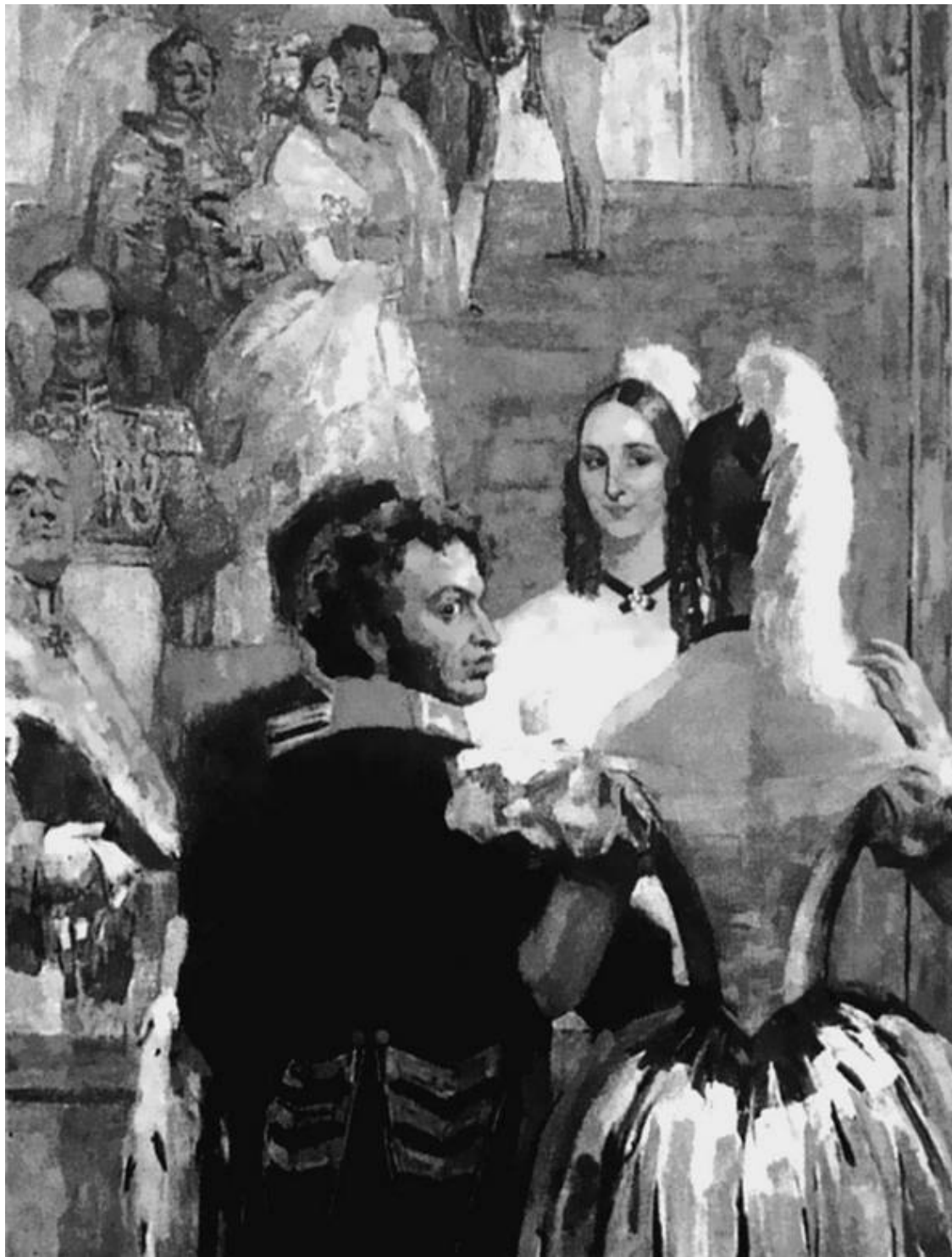
Пушкин с женой на придворном балу. Художник Н.П. Ульянов

Приезжая в Москву после женитьбы и переезда в Петербург, Пушкин останавливался в доме родителей жены вблизи Тверского бульвара. Все эти жизненные обстоятельства и дали основание Обществу любителей русской словесности при Императорском Московском университете в 1899 году установить первый памятник Пушкину именно на этом бульваре, откуда его при советской власти передвинули на вершину Тверского холма.