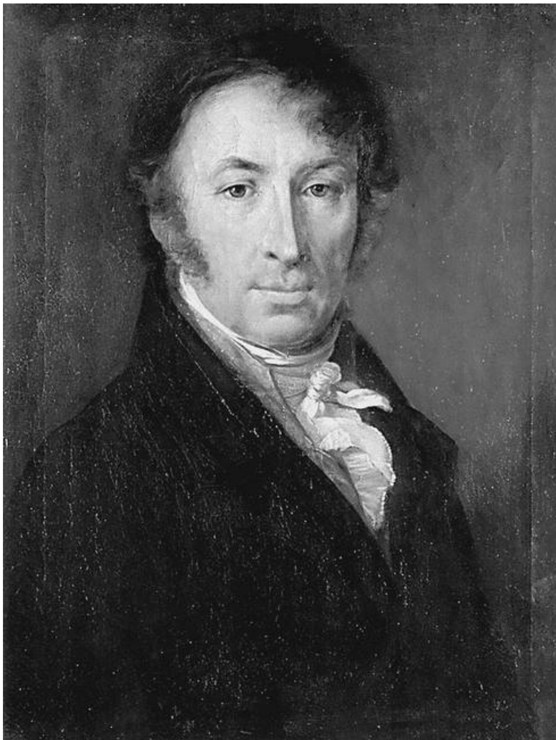
Н.М. Карамзин. Художник В.А. Тропинин

Первым о Тверском бульваре заговорил Николай Карамзин, когда это название к нему окончательно не пристало и само слово “бульвар” резало русское ухо. Карамзин и Батюшков установили традицию в русской литературе – писать о Тверском бульваре в прозе и стихах.