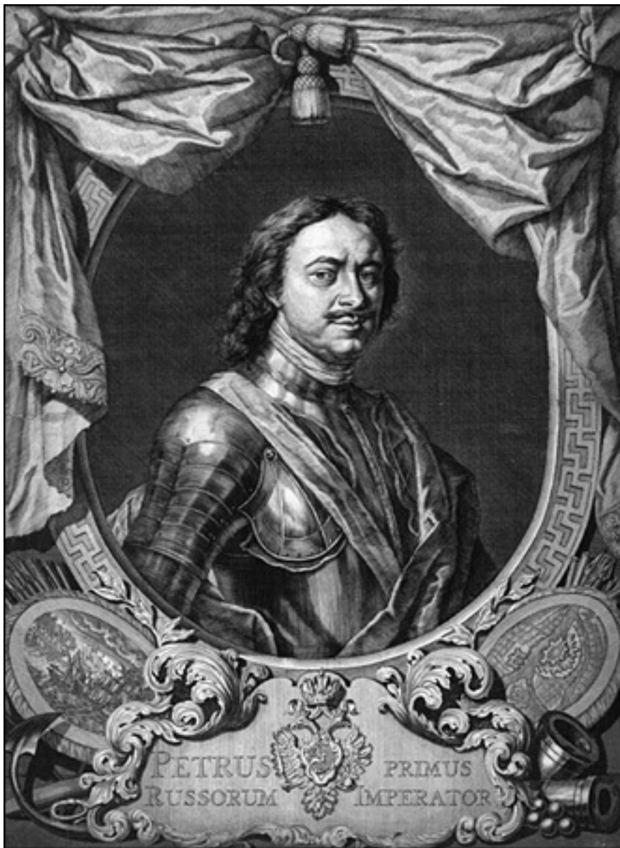
Пётр I. Гравюра XIX в.

Первый российский император Пётр I Великий (1672–1725) прославился как реформатор, приобщивший российское дворянство к европейской цивилизации и приблизивший российский государственный аппарат к западноевропейскому. Как полководец, Пётр прославился победой над Швецией в Великой Северной войне, созданием российского флота и завоеванием Ингерманландии, Эстляндии и Лифляндии, что обеспечило России выход к Балтийскому морю.