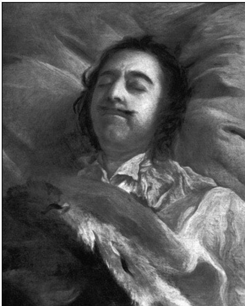
Пётр I на смертном одре. Художник И.Н. Никитин. 1725 г.