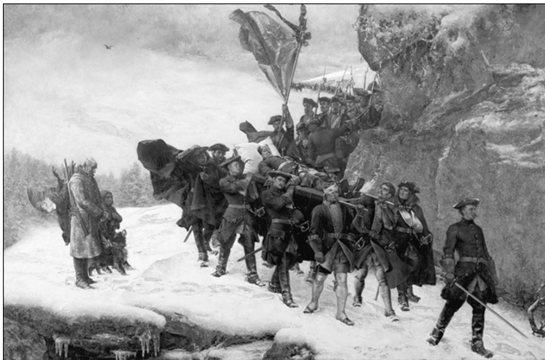
Траурная процессия с телом Карла XII. Художник Г. Седерстрём. 1884 г.

На наш взгляд, более вероятной представляется версия гибели короля Карла от датской пули. В случае, если бы выстрел в Карла производили в упор из пистолета, голова короля оказалась бы опаленной, однако никаких указаний в источниках на это нет, хотя свидетели не могли не заметить ожога такого рода. Прицельно же выстрелить в Карла из траншеи, в которой он находился, оставаясь от него на некотором расстоянии, было затруднительно, принимая во внимание окружавшую Карла толпу. Версия, будто убийца лежал у траншеи, дожидаясь Карла, кажется абсурдной. Ведь он не мог знать, какую именно траншею и когда посетит Карл. Да и в Норвегии в декабре на снегу долго не лежишь. Версии об убийстве исходили из кругов, не симпатизировавших королю-воину, который, как они думали, вверг Швецию в бесконечную и безнадежную войну. Хотя войну ведь начал не Карл, а противостоявшая ему коалиция. Карл же только оборонялся, причем довольно удачно, хотя в конце концов и потерпел поражение.