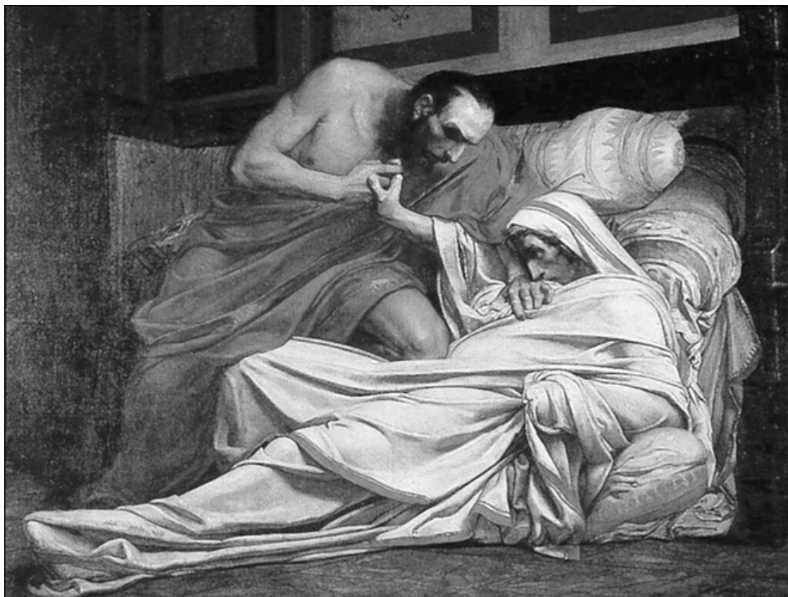
Смерть Тиберия. Художник Ж.П. Лоран. 1864 г.

После казни Сеяна Тиберий больше не был в Риме, живя на Капри или на вилле в Кампании. В начале 37 года здоровье императора начало быстро ухудшаться, и 16 марта 37 года он умер на своей вилле в Мизене, в Кампании, в присутствии Макрона и Калигулы. Как именно умер Тиберий, существуют различные версии. Согласно Тациту, когда присутствующие решили, что Тиберий умер, и уже приносили поздравления Калигуле, император внезапно открыл глаза, что повергло всех в ужас. Но находчивый Макрон, не утративший самообладания, приказал задушить Тиберия, набросив на лицо или подушки, или, как полагал Дион Кассий, ворох одежды. Светоний считал, что Тиберия задушил Калигула, хотя допускал, что в действительности император был отравлен тем же Калигулой. Тот же Светоний выдвинул и еще более экстравагантную версию, согласно которой Тиберия умили голодом после приступа лихорадки. Тиберий завещал разделить власть между Калигулой и Тиберием Гемеллом, однако Калигула, придя к власти, вскоре умертвил Гемелла.