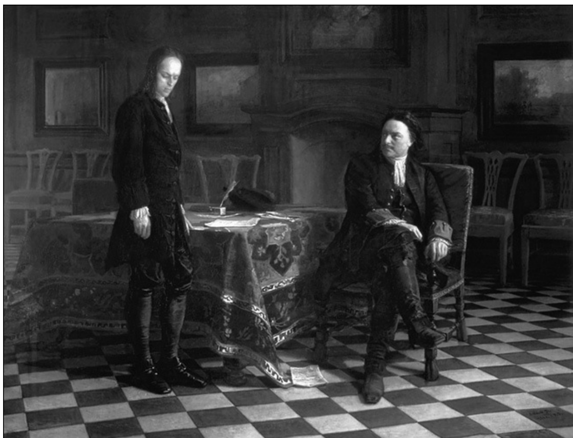
Пётр I допрашивает царевича Алексея в Петергофе. Художник Н.Н. Ге. 1871 г.