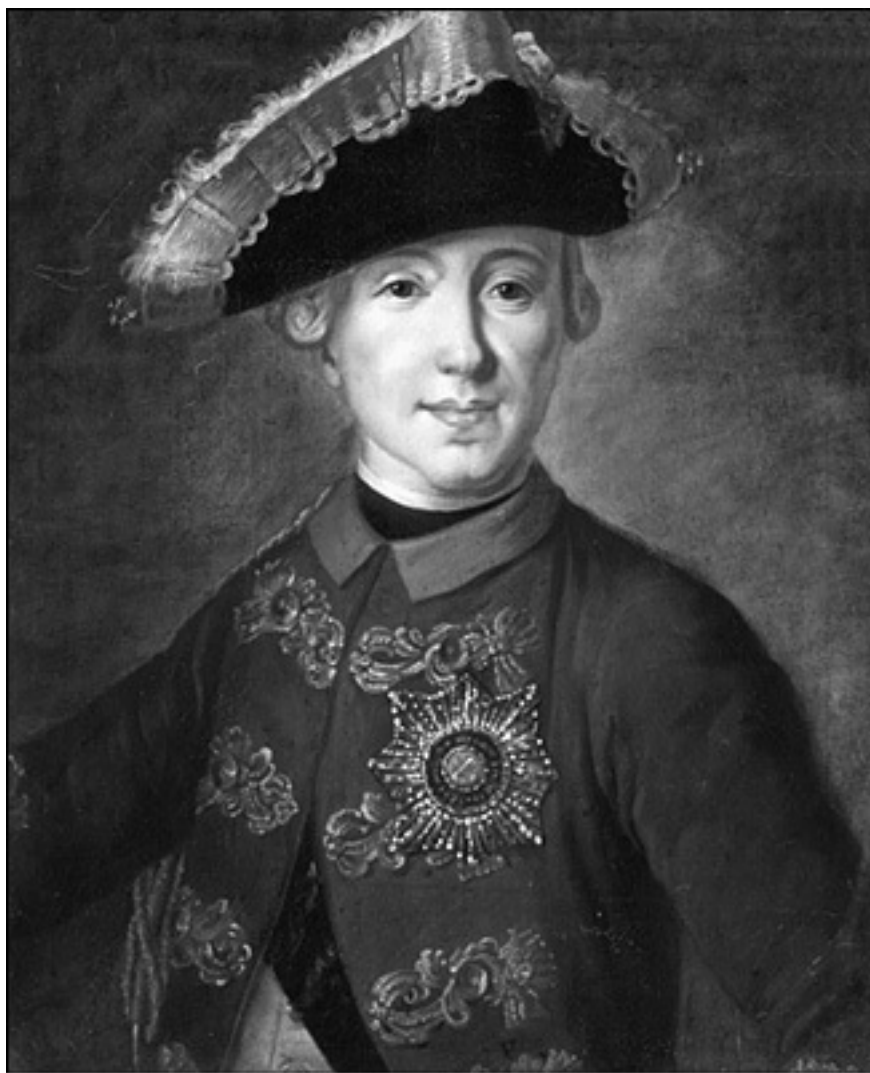
Пётр III. Художник Ф.С. Рокотов. XVIII в.

Императору Петру III (1728–1762) сильно не повезло в русской истории. Царствовал он очень недолго, всего полгода, затем был свергнут своей властолюбивой и любвеобильной супругой, названной впоследствии Екатериной Великой. Её величие, признанное современниками и потомками, заставляло историков искать убедительное в глазах публики оправдание свершенной Екатериной узурпации престола. Поэтому в их трудах Пётр III предстает слабым дегенератом, не способным к государственному правлению, да к тому же глубоко презирающим все русское.