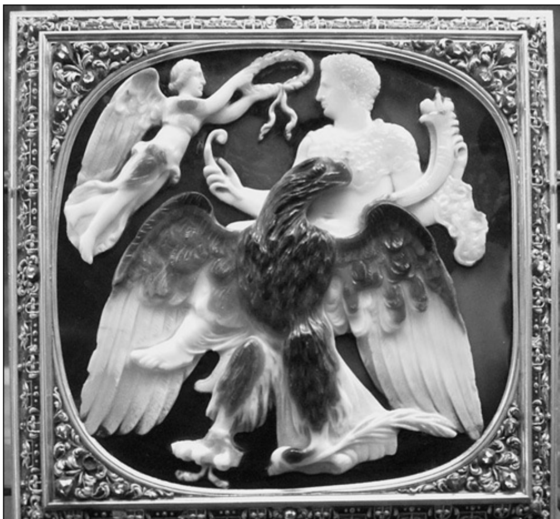
Апофеоз Клавдия. Резная камея

В 48 году Мессалина составила заговор, чтобы возвести на престол своего любовника Гая Силия. После разоблачения заговора Мессалине было предложено покончить с собой, но она не смогла этого сделать, и тогда её заколол кинжалом посланный императором легат. За ужином Клавдию доложили о смерти супруги. Он лишь попросил налить ему больше вина.