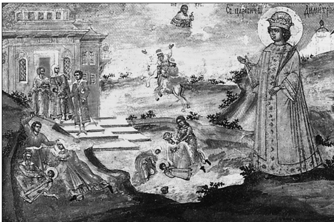
Царевич Димитрий и изображение сцены убийства. Икона XVII в.

Фактический правитель государства после смерти Ивана Грозного при царе Федоре Борис Годунов, на чьей сестре Ирине Федор был женат, опасался, что родственники матери Дмитрия, царицы Марии, Нагие вместе с оппозиционными Годуновым Шуйскими могут в случае смерти Федора лишить его, царского шурина, власти, возведя на престол Дмитрия. Вот почему и совершается убийство царевича. Обычно современники и позднейшие историки в качестве убийцы указывали на дьяка Михаила Битяговского, опекавшего вдову Грозного и её сына и, в частности, распоряжавшегося выделяемыми на их содержание денежными суммами. Нагие, постоянно конфликтовавшие на этой почве с Битяговским, натравили на него толпу горожан, и несчастного буквально растерзали.