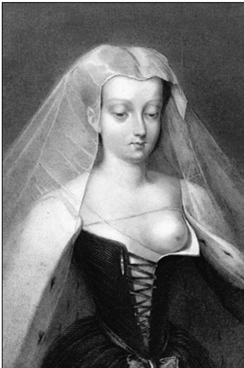
Агнесса Сорель. Гравюра XVIII в.

Агнесса Сорель (1422–1450), прожившая короткую жизнь (в момент смерти ей, по всей видимости, не было и 28 лет), была любовницей французского короля Карла VII. Она родилась в дворянской семье в деревне Фроменто в Турени. Агнесса была фрейлиной Изабеллы Лотарингской, герцогини Анжуйской, и очаровала короля своей красотой. Агнесса считалась официальной фавориткой и имела от Карла трех дочерей – Марию Маргариту Валуа (1444–1473), Шарлотту Валуа (1446–1477) и Жанну Валуа (1448–1467). Будучи беременной в четвёртый раз, Агнесса внезапно умерла 9 февраля 1450 года, перед смертью родив ребенка, который, по всей видимости, не выжил. Первоначально предполагалось, что она скончалась от дизентерии, но потом в её убийстве был обвинён Жак ле Кёр, советник короля Карла VII и крупный бизнесмен, благодаря обширной торговле в Леванте наживший огромное состояние и заведовавший королевскими финансами. Ему были должны крупнейшие вельможи, и это было весомым