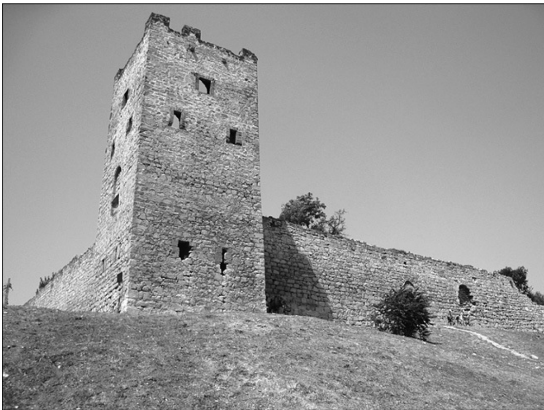
Генуэзская крепость Кафа – место, где закончил свою жизнь Мамай

Насчет обстоятельств гибели Мамаю существуют и иные версии. Автор первого университетского курса по истории России финско-шведский историк XVIII века Х.Г. Портан полагал, что он был убит прямо на Куликовом поле. А современный историк В.Л. Егоров считает, что «Мамай был настигнут погоней Тохтамыша и убит». Однако более правдоподобной выглядит версия, о которой пишут русские летописи, что он пал от рук генуэзцев.