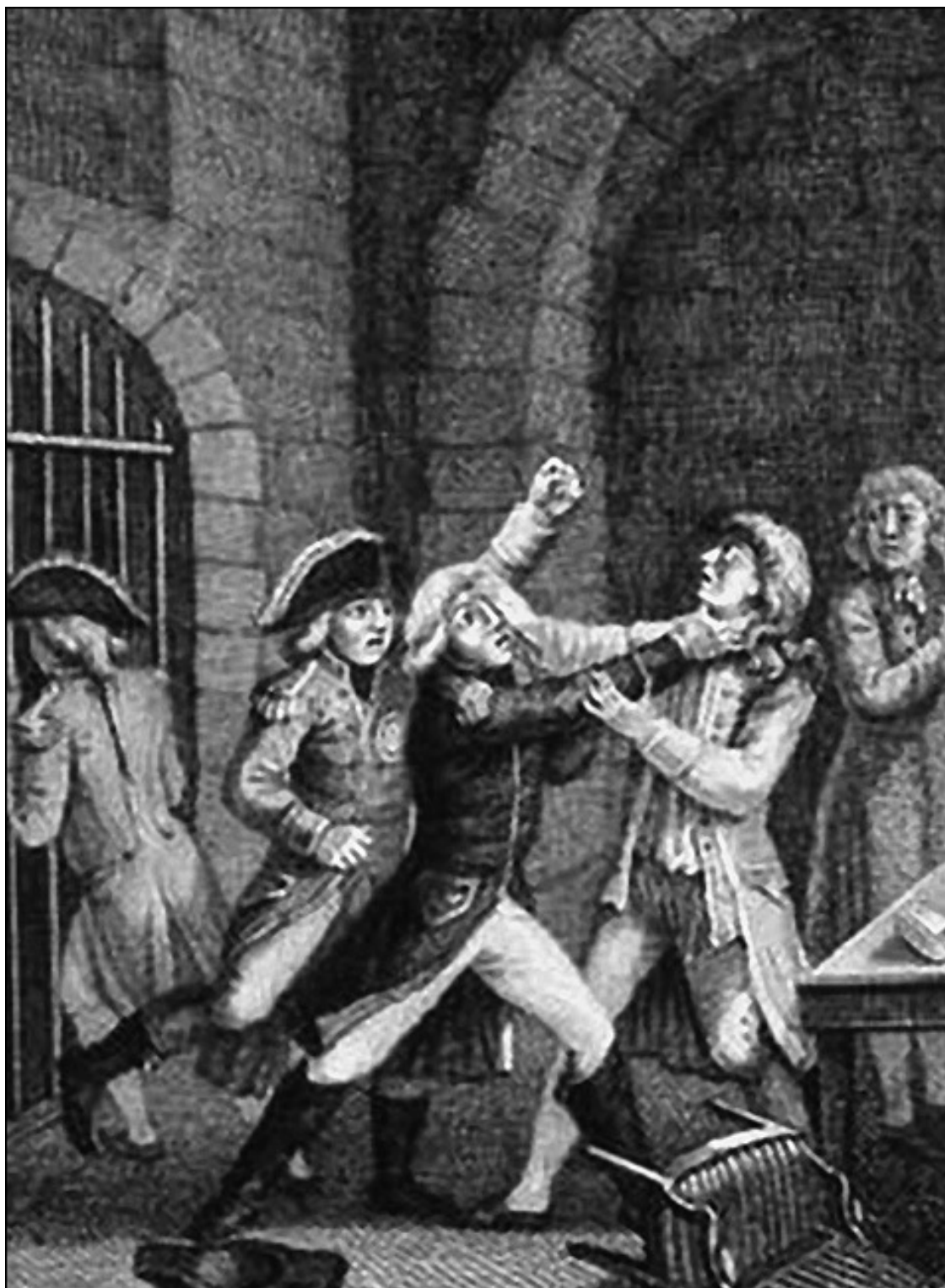
Убийство Петра III. Гравюра конца XVIII в.