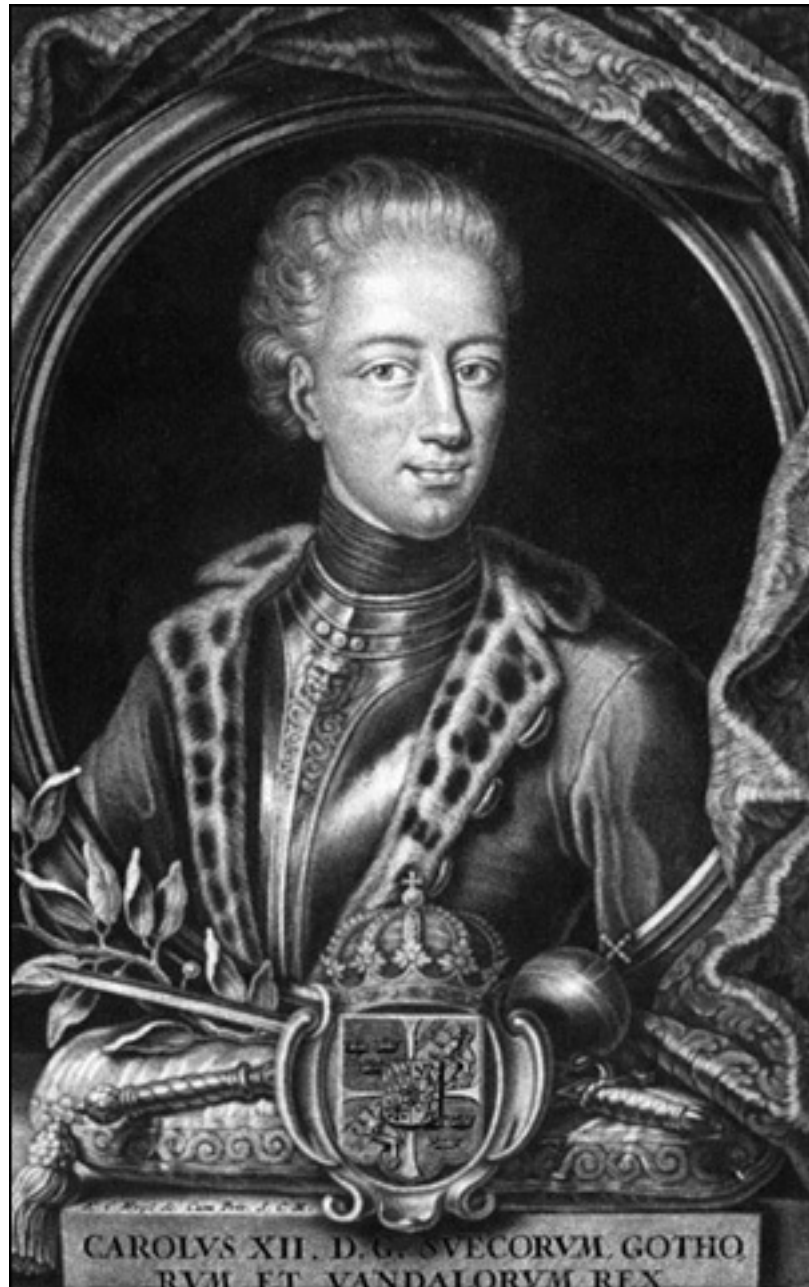
Карл XII. Гравюра начала XVIII в.

В этой траншее уже погибло почти 60 шведских солдат. Карл дождался полной темноты. Но стены крепости все равно освещались факелами. К тому же датчане периодически стреляли зажигательными бомбами, освещавшими окрестности. Хотя рядом с королем находилось много солдат и офицеров, сам момент выстрела никто не запомнил. Наиболее вероятной считается датская версия. Карл, безусловно, находился в досягаемости ружейного огня датчан, оборонявших Фредрикстен, но дальность прицельного выстрела тогда не превышала 60 метров, так что смертельное ранение Карла было, по сути, случайным. Хотя стрелок и мог стараться попасть именно в короля, но сам по себе точный выстрел был делом случая.