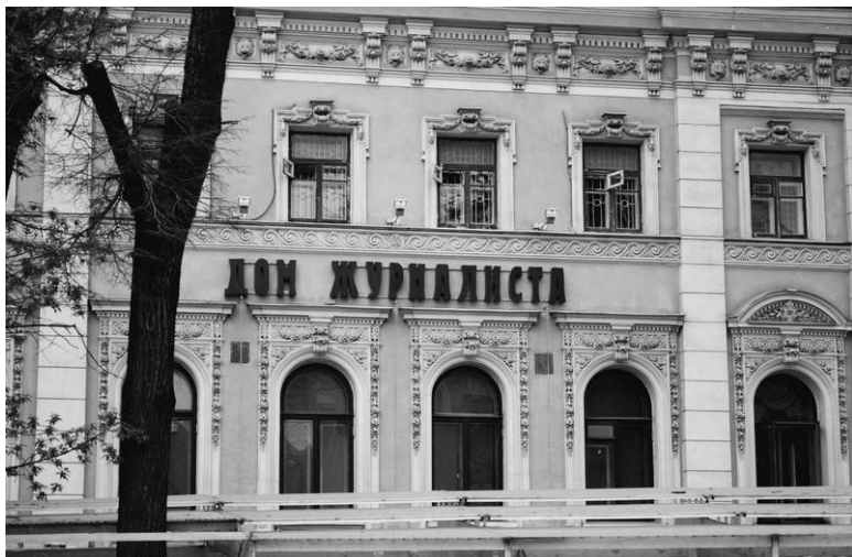
Центральный дом журналиста, бывший дом Голицыных,

После аудиенции Крылов возвращается в Москву, поступает личным секретарем к князю Сергею Голицыну, живет летом в его поместье, зимой в доме на Никитском бульваре, где учит его младших сыновей русскому языку.