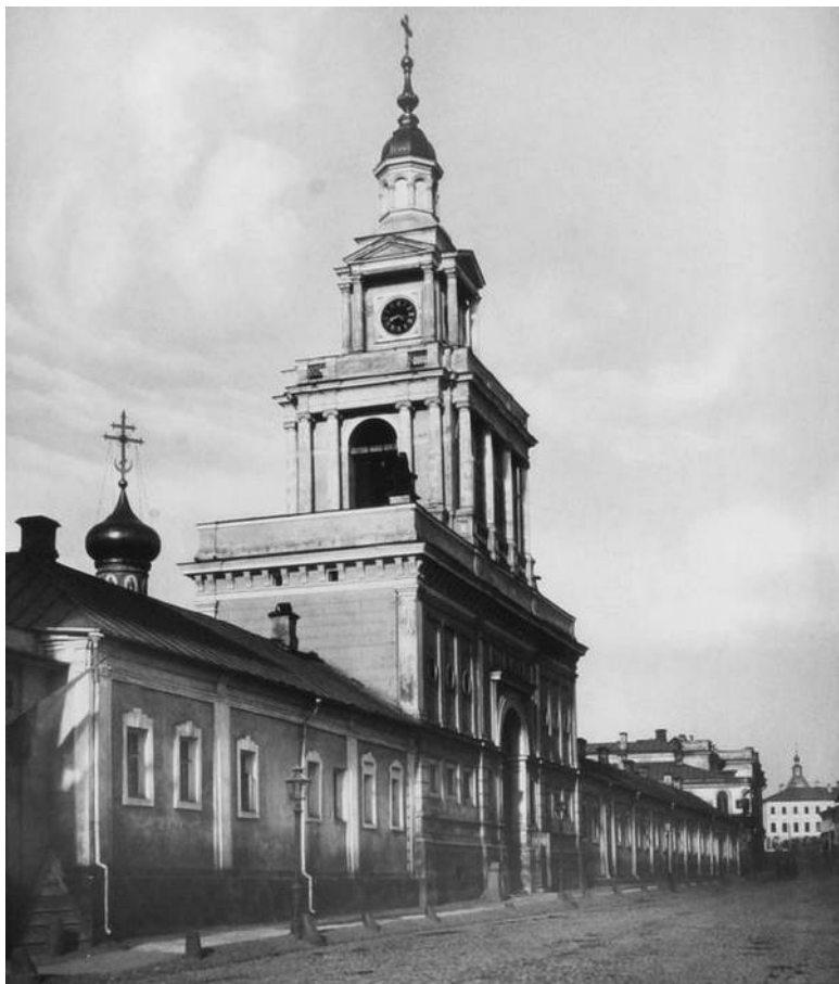
Колокольня церкви Воскресения Словущего

В середине стены во второй половине XIX века вырос-