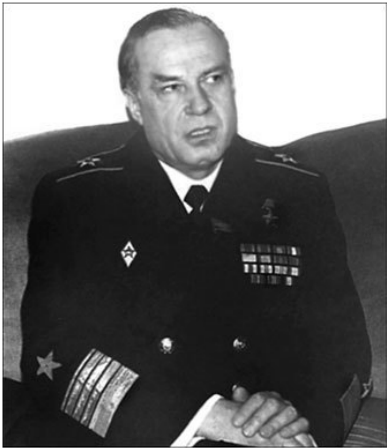
Адмирал флота В.Н. Чернавин, главком ВМФ СССР в 1985 – 1992 гг., – один из первых осознал необходимость изучения ДОП в интересах флота