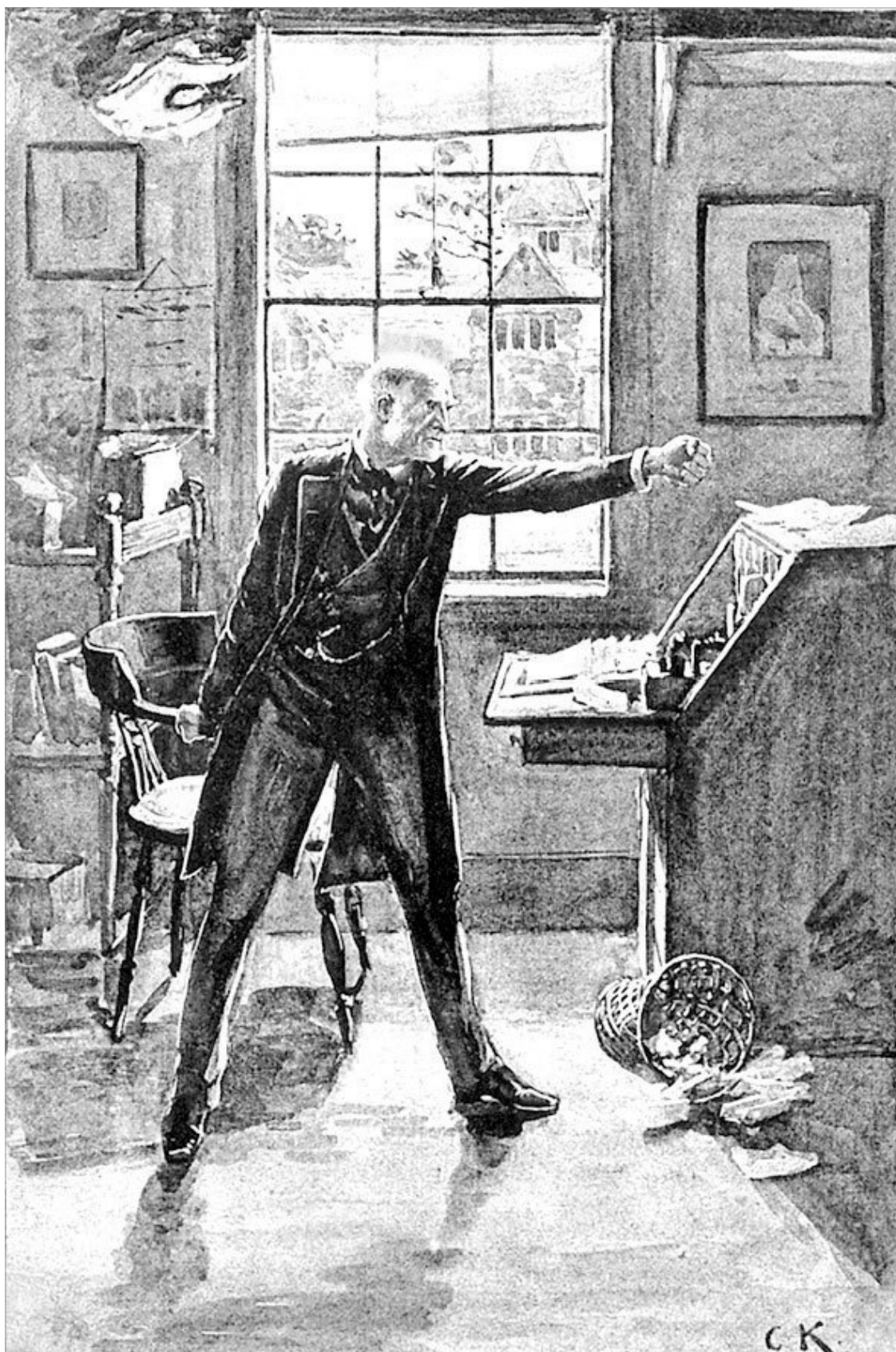
Он сжал кулаки и потряс ими в сторону закрывшейся двери