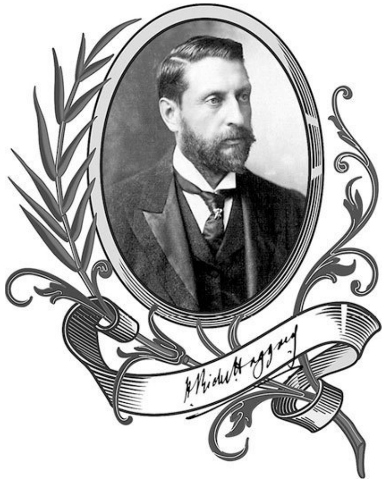
Генри Райдер Хаггард