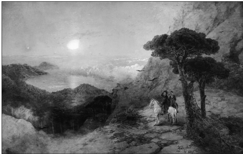
А.С. Пушкин на вершине Ай-Петри при восходе солнца. Художник И.К. Айвазовский

На Ай-Петри множество мест, представляющих интерес для туристов. С вершины горы, со смотровой площадки на скале Шишко, с «Серебряной беседки» открывается изумительная панорама моря, предгорий, Ялты, поселков. Рядом с тропой растет 1000 летний тис ягодный высотой 10 м и обхватом ствола 2,6 м, с которого туристы, как козы, ободрали всю кору и обломали нижние ветки. Есть и буковый лес, еще старше этого тиса. В небольшом озерце – «ванне молодости» Кара-Голь – в темной холодной воде, насыщенной йодом, фосфором и сероводородом, люди сводят бородавки,