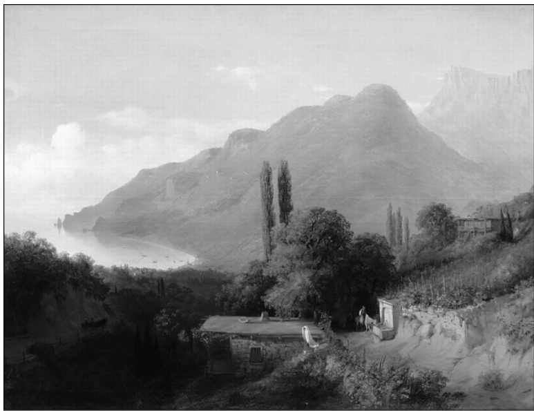
Крымский пейзаж. Художник Л.Ф. Лагорио

древние люди – тогда уровень моря был ниже на 30 м сегодняшнего. В одном из гротов режиссеры В. Чеботарев и Г. Казанский в 1961 г. снимали эпизоды фильма «Человек-амфибия».