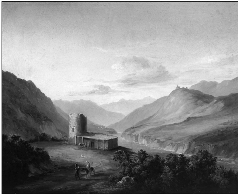
Военно-Грузинская дорога близ Мцхеты. Художник М.Ю. Лермонтов