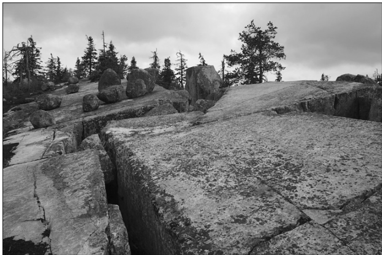
На горе Вотто-Вааре

тел кипятка. Дух устроил землетрясение (по другой версии, шторм на море), но отступил и больше человеческих жертв не требовал. На вершине горы есть озеро в центре амфитеатра, в образцах грунта которого найден пласт фосфора, образование которого связывают именно с жертвоприношениями.