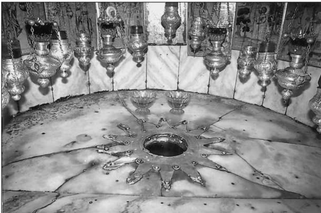
Серебряная звезда на месте рождения Иисуса Христа в храме Рождества Христова

Храм Рождества Христова является самым древним христианским храмом, сохранившимся во всей Палестине. Согласно церковному преданию, это был единственный храм, не разрушенный персами-зороастрийцами во время их вторжения в страну в VII в. Он остался невредимым благодаря изображениям волхвов на его стене (позднее они были утрачены). Их персы считали за изображения зороастрийских жрецов, что спасло храм. В эпоху Средневековья два боковых входа в храм были замурованы, а высота центрального была настолько уменьшена, что человек мог войти в храм, только сильно наклонившись. По этой причине вход называется теперь Вратами смирения.