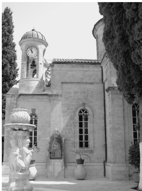
Храм Святого Георгия Победоносца в Кане Галилейской

Именно здесь, по Евангелию от Иоанна, Иисус совершил свое первое чудо. Сюда, по церковному преданию, на брак своего брата Симона, сына праведного Иосифа, пришел Господь с Матерью и учениками. Здесь Он претворил простую воду в великолепное вино.