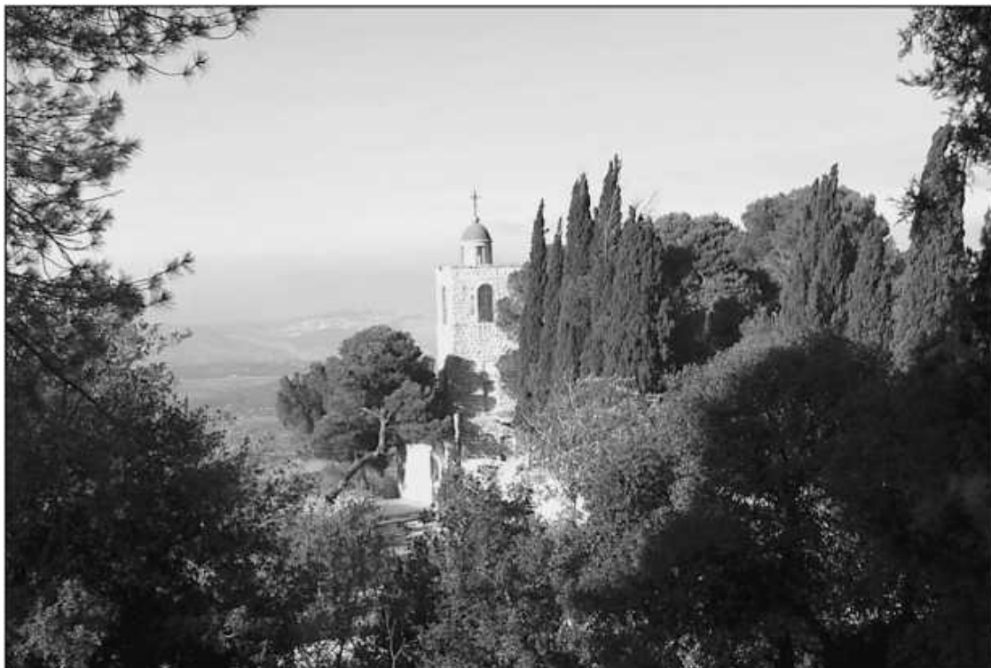
Храм Преображения Господня на горе Фавор