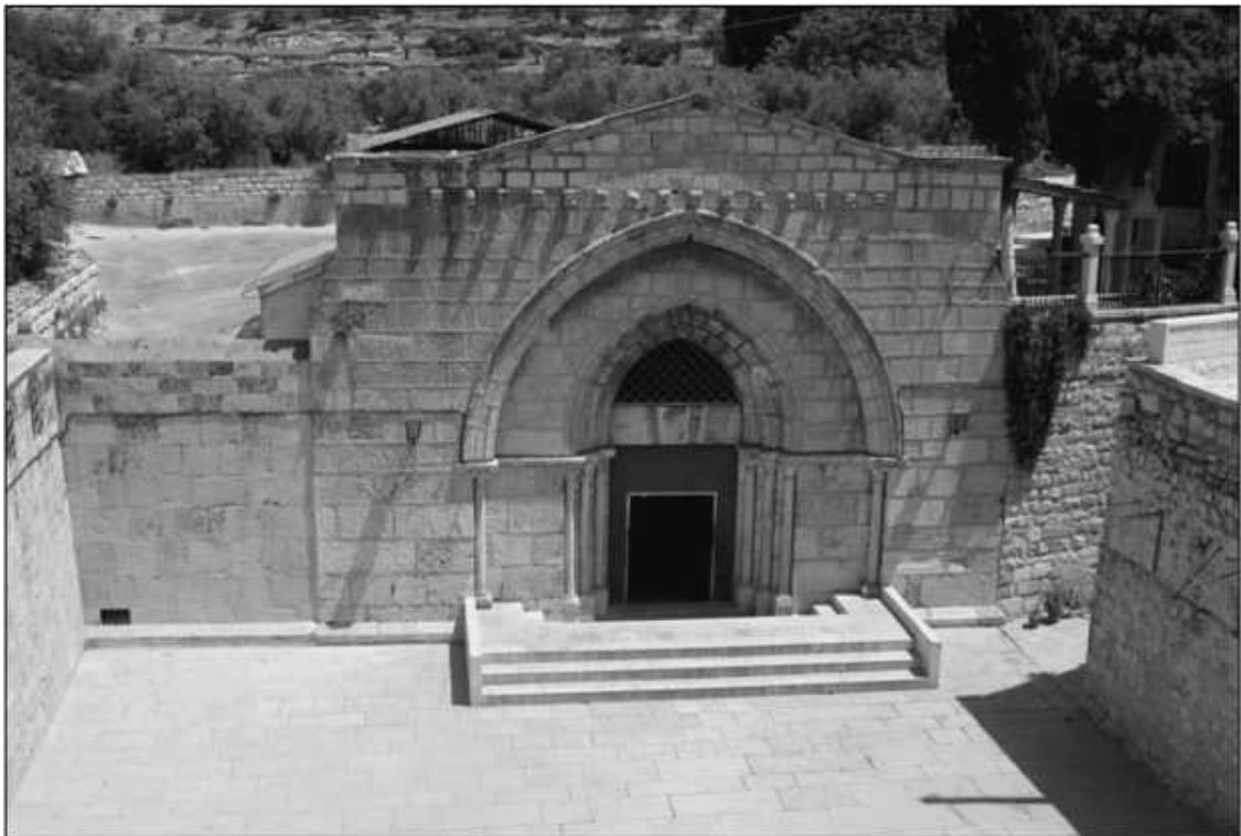
Храм Успения Богородицы

Название «Гефсимания» происходит от арамейского слова, буквально означающего «масличный пресс». Эта местность, у подножия западного склона Елеонской горы в Иерусалиме, также в переводе звучащая как «Маслиничная гора», в древности была густо засажена серебристыми оливами, из которых приготавливалось драгоценное масло. Во времена Христа вся Елеонская гора утопала в зелени виноградников, олив, фиговых и тутовых деревьев.