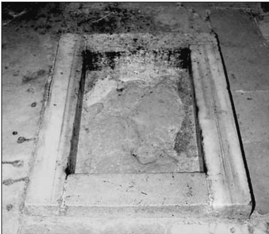
Отпечаток стопы Иисуса Христа в часовне Вознесения на Масличной горе

О первоначальном строительстве церкви на священном месте Вознесения Господня сведения сохранились достаточно противоречивые. Большинство исследователей считает, что она была построена царицей Еленой, но некоторые относят ее возведение и к более позднему сроку. Но в самом конце IV в. она уже упоминается под наименованием «Имвомон», вероятно, от греческого «холм».