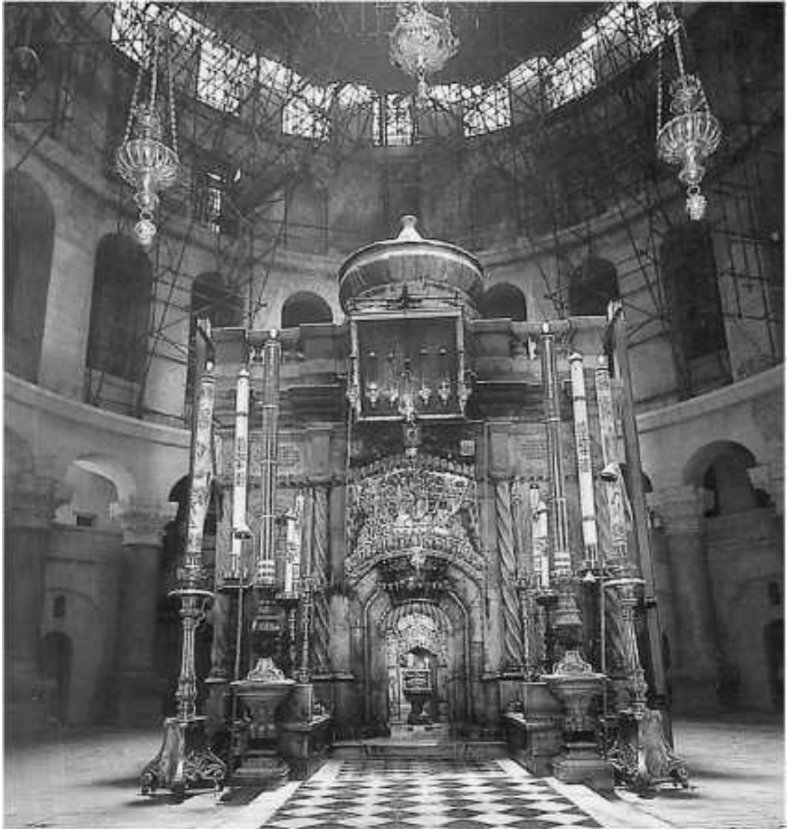
Храм Гроба Господня. Кувуклия

Первым разрушениям храмы в Иерусалиме подверглись во время персидского нашествия 614 г. Много христиан было убито. Все храмы у Гроба Господня были разрушены, а Святой Крест вывезен в Персию. Но скоро огнепоклонники персы разрешили восстановление святынь.