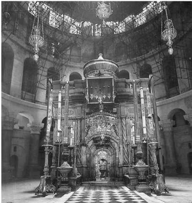
Храм Гроба Господня. Кувуклия

Первым разрушениям храмы в Иерусалиме подверглись во время персидского нашествия 614 г. Много христиан было убито. Все храмы у Гроба Господня были разрушены, а Святой Крест вывезен в Персию. Но скоро огнепоклонники