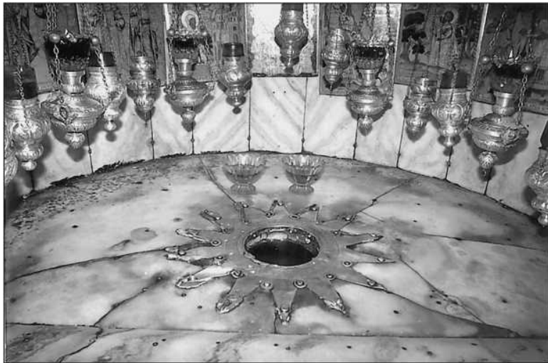
Серебряная звезда на месте рождения Иисуса Христа в храме Рождества Христова

Храм Рождества Христова является самым древним христианским храмом, сохранившимся во всей Палестине. Согласно церковному преданию, это был единственный храм, не разрушенный персами-зороастрийцами во время их вторжения в страну в VII в. Он остался невредимым благодаря изображениям волхвов на его стене (позднее они были утрачены). Их персы считали за изображения зороастрийских жрецов, что спасло храм. В эпоху Средневековья два боковых входа в храм были замурованы, а высота центрального была настолько уменьшена, что человек мог войти в храм,