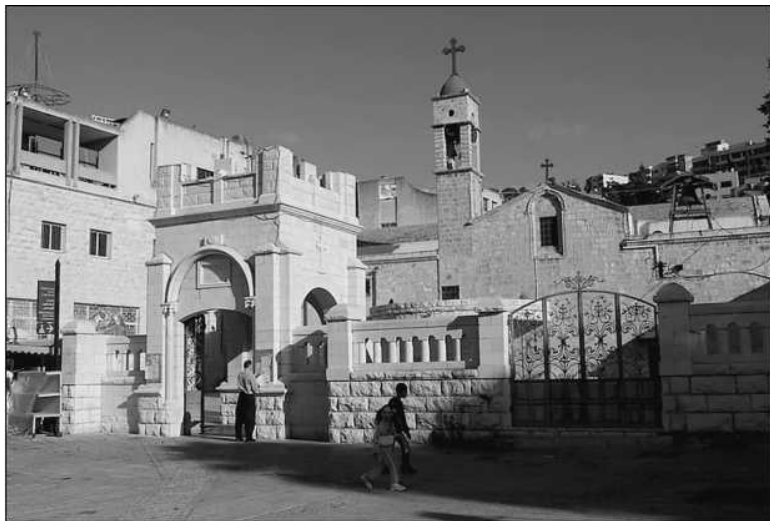
Храм Архангела Гавриила в Назарете

Архангел Гавриил всегда являлся важнейшим лицом в евангельских событиях, поэтому именно ему посвящается данный храм в Назарете. В иконографии он изображается с райской ветвью или со светящимся фонарем и зеркалом в руках.