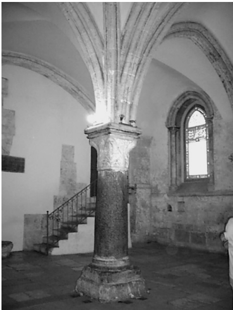
Сионская горница – «мать всех церквей»

В IV в. на этом святом месте была воздвигнута Сионская церковь, или церковь Святого Сиона, именовавшаяся также византийцами Матерью всех Церквей. Огромную роль она играла в тот период, являясь местом прохождения всех процессий по городу. Гора Сион со всеми святынями была включена в городскую территорию. Храм был позднее разрушен персами, а в эпоху крестоносцев восстановлен заново.