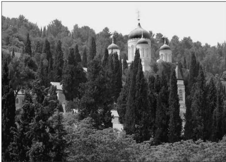
Склон горы с Горненским монастырем

Уже в 1881 г. на живописном склоне был воздвигнут небольшой храм во имя Казанской иконы Божией Матери, который и теперь приветливо принимает всех верующих. Храмовая чудотворная Казанская икона, спасшая монастырь когда-то от эпидемии чумы, стала одной из святынь обители, которой ежедневно, на протяжении более столетия, по заведенной традиции, насельницы обносят монастырь, свято веря в ее охранительную силу. Перед входом в храм установлен столб от дома праведных Елисаветы и Захария, а также камень, на котором святой Иоанн Предтеча, согласно преда-