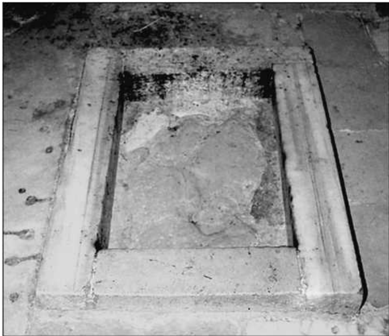
Отпечаток стопы Иисуса Христа в часовне Вознесения на Масличной горе

Церковь «Имвомон» полностью разрушается в 614 г. при персидском нашествии под предводительством Хозроя. Но уже через 15 лет здесь возводится открытая, круглая ротонда, без купола, чтобы взорам молящихся была открыта дорога в небо, куда вознесся Спаситель. Такой часовня просуществует до X в.