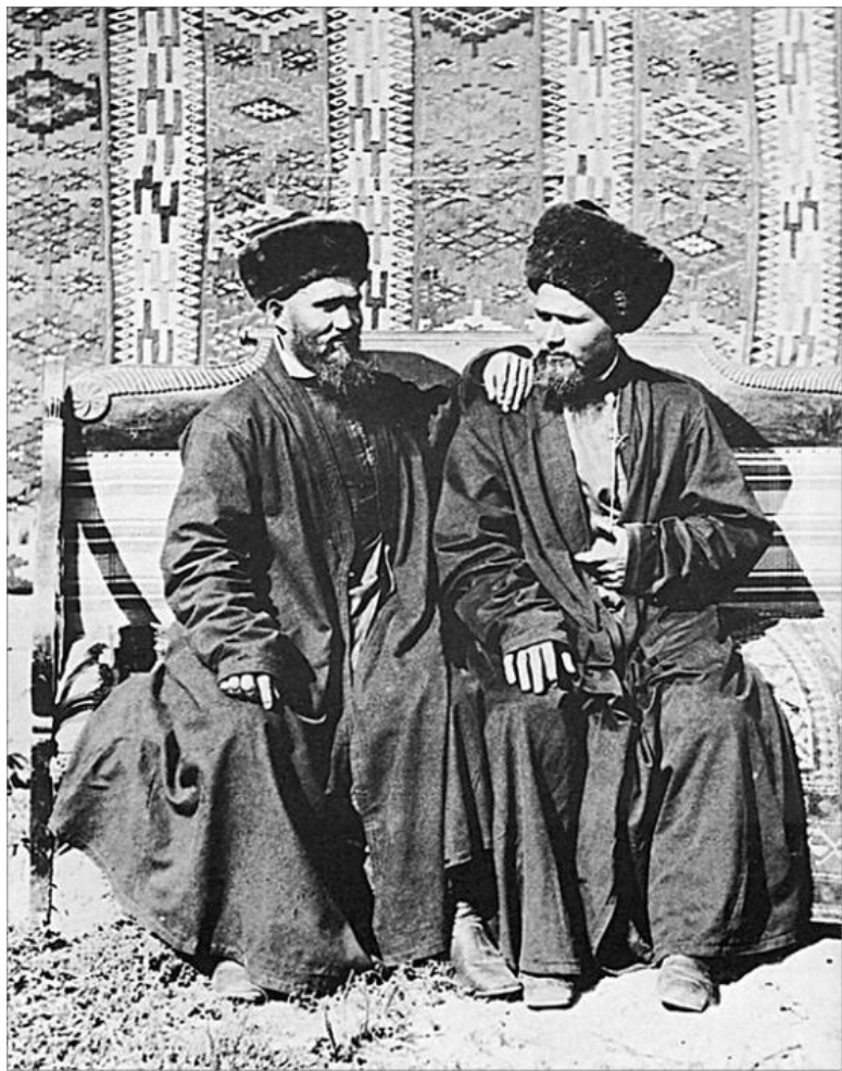
Казанские татары. Фото 1885 г.