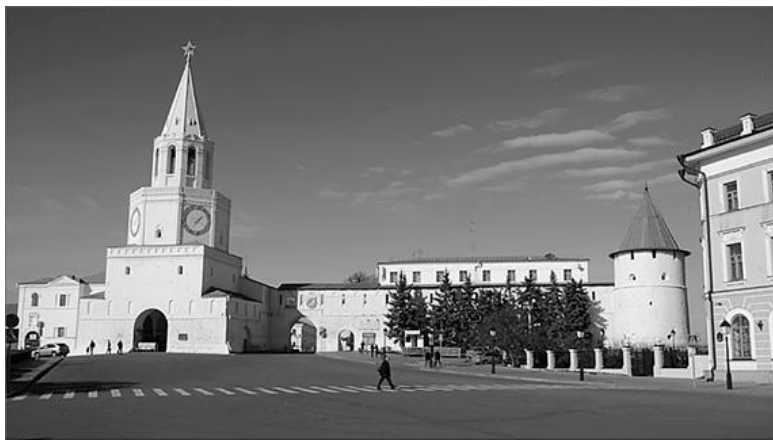
Вид на Казанский кремль

Проехаться на казанском метро , вступившем в строй в праздничные дни Тысячелетия; эта транспортная подземная магистраль позволяет быстро перенестись из центра в районы новостроек.