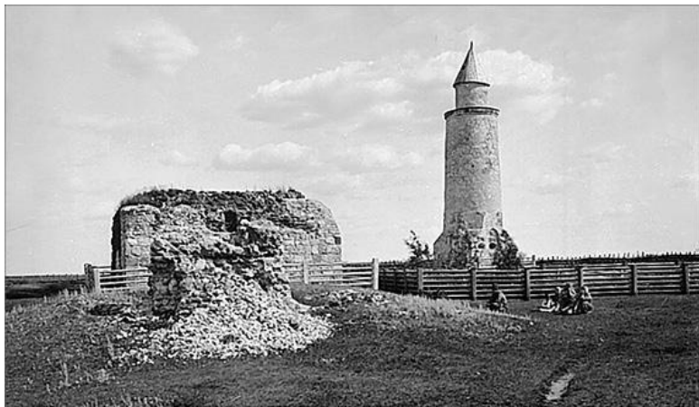
Древний Болгар. Старое фото

времени его правления, или по более широкой трактовке – вечность жизни и непрерывность движения. Сам же гербовый герой символизировал избранность, благородство, счастье. После принятия Волжской Булгарией ислама на гербе появились знаки святости: вместо рога – крылья.