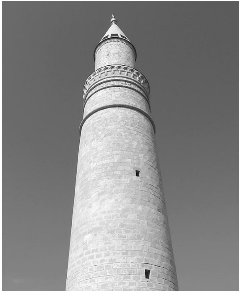
Минарет Волжского Болгара