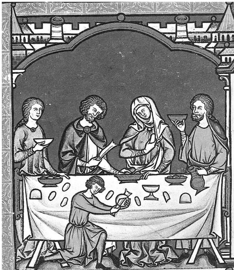
Левит и его супруга. MS M.638, fols. fol. 15 r. (фрагмент) Библия Мацеевского, ок. 1250 г., Библиотека Пирпонта-Моргана (Нью-Йорк)