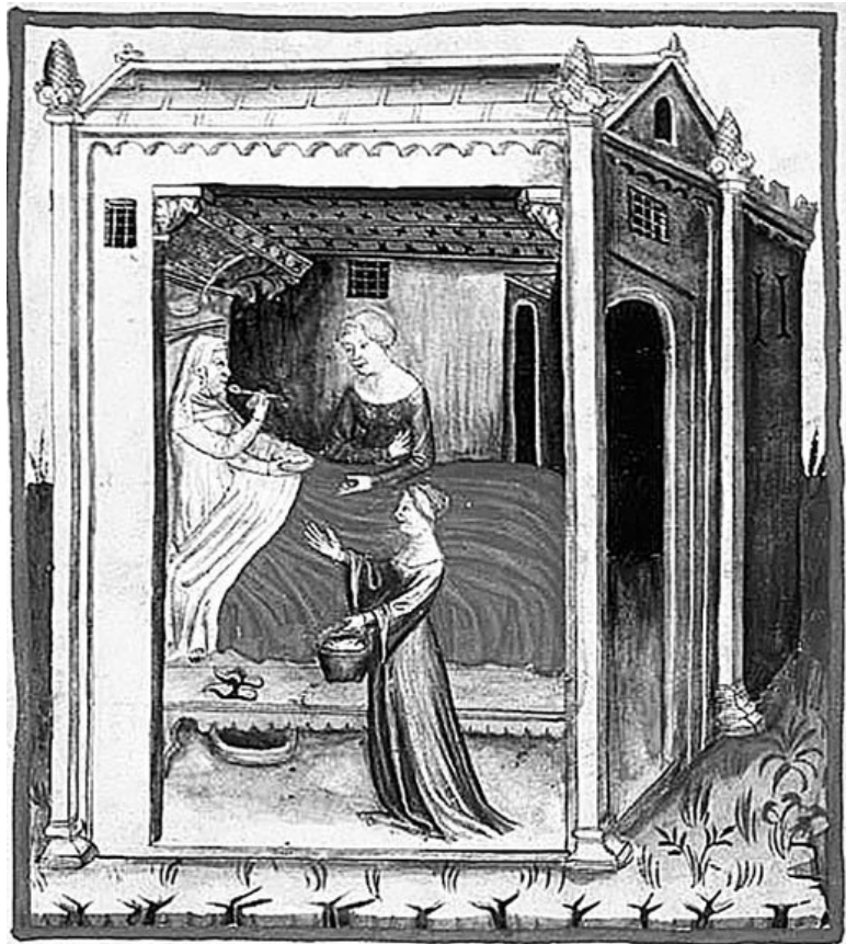
Неизвестный художник. Лечение больного посредством овсяного отвара – Tacuinum Sanitatis (Codex Vindobonensis), series nova, 2644 f. 44v., конец XI