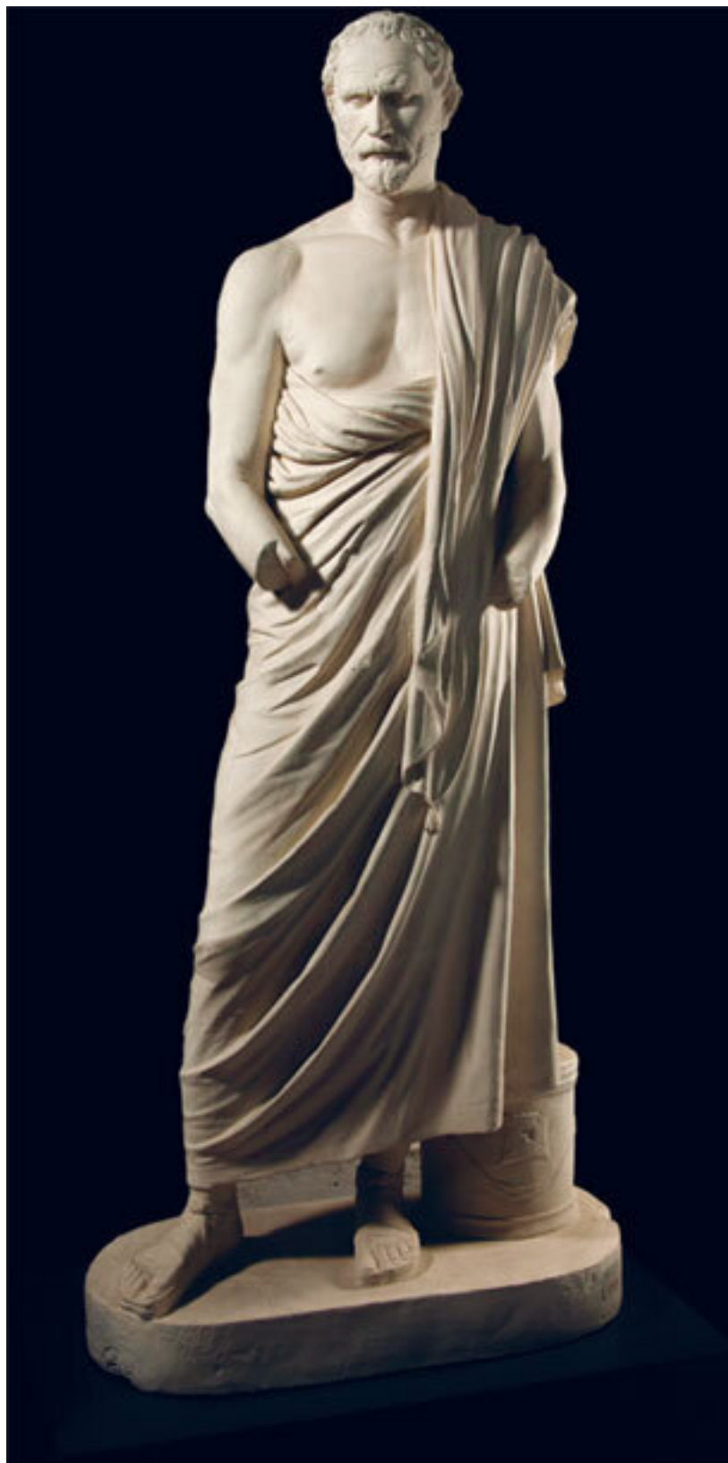
Статуя Демосфена, копия бронзовой статуи, воздвигнутой в 280 году до н. э. в Афинах. Новая Карлсбергская глиптотека, Копенгаген

«Диоген не нуждался в кабинете и в теплом помещении; там и без того жарко. Лежи себе в бочке да кушай апельсины и оливки. А доведись ему