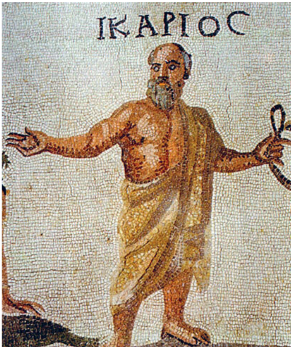
Икарий. Дом Диониса, конец II века н. э. Археологический парк Пафоса