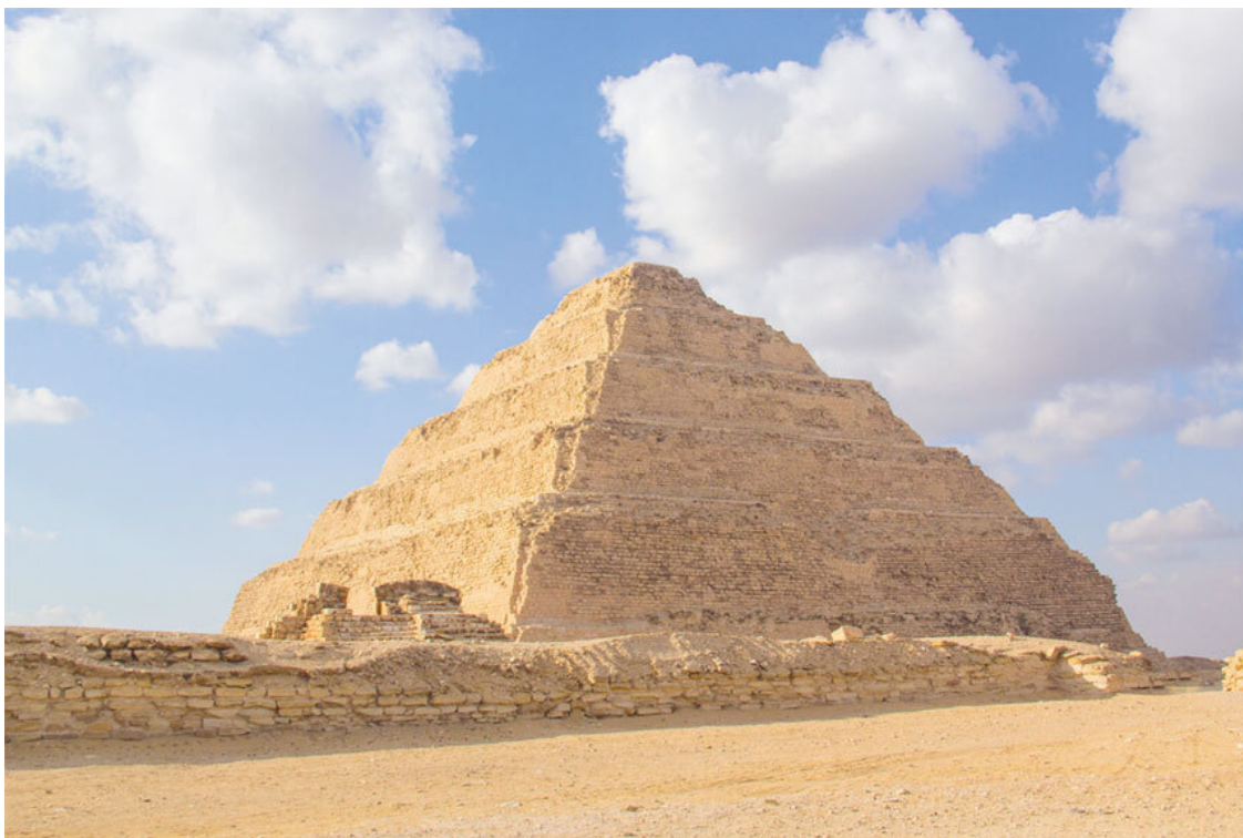
Ступенчатая пирамида Джосера, около 2650 года до н. э. Саккара