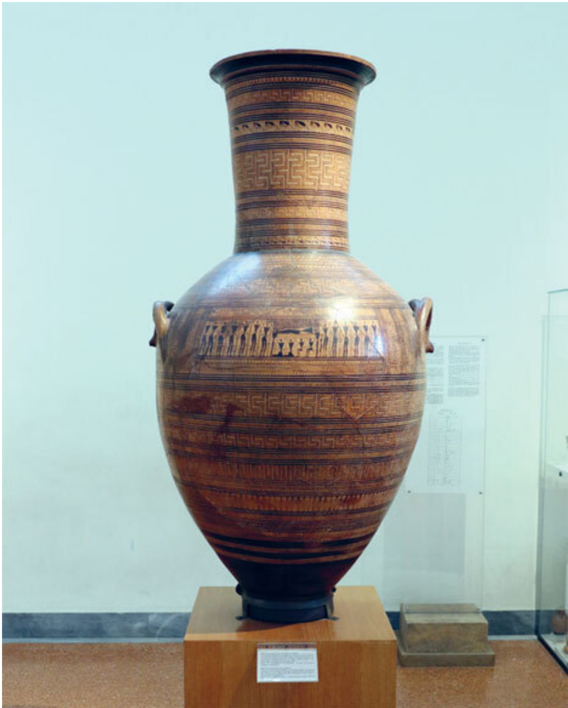
Большая дипилонская амфора, около 760–750 годов до н. э. Национальный археологический музей, Афины