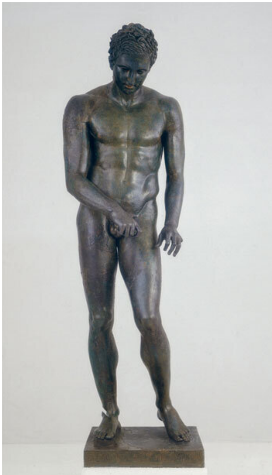
Хорватский Апоксиомен, II или I века до н. э. Мали-Лошинь, Хорватия