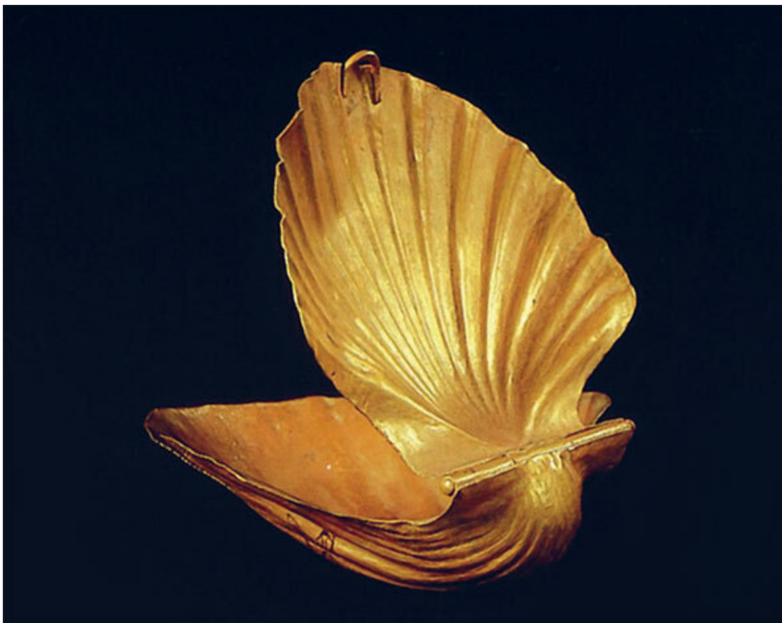
Пудреница в виде золотой ракушки. Обрядовый дар в гробницу Сехемхета. Египетский музей, Каир