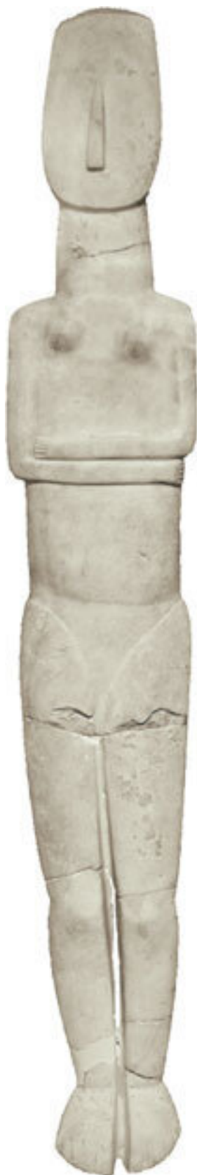
Кикладский идол, около 2800–2300 годов до н. э. Музей кикладского искусства, Афины