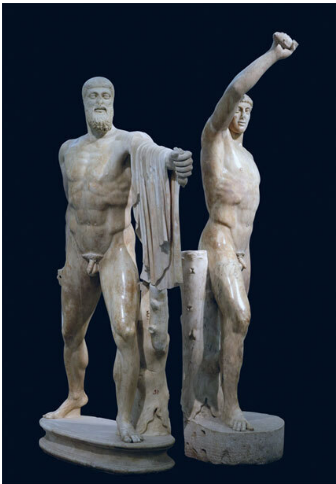
Тираноборцы. Римская копия 117–138 годов н. э. с греческого оригинала. Археологический музей, Неаполь

Индивидуальность в жестком сословном древнегреческом обществе подавлялась выборочно. Если человек становился слишком известен, его могли подвергнуть остракизму – изгнанию в результате голосования.