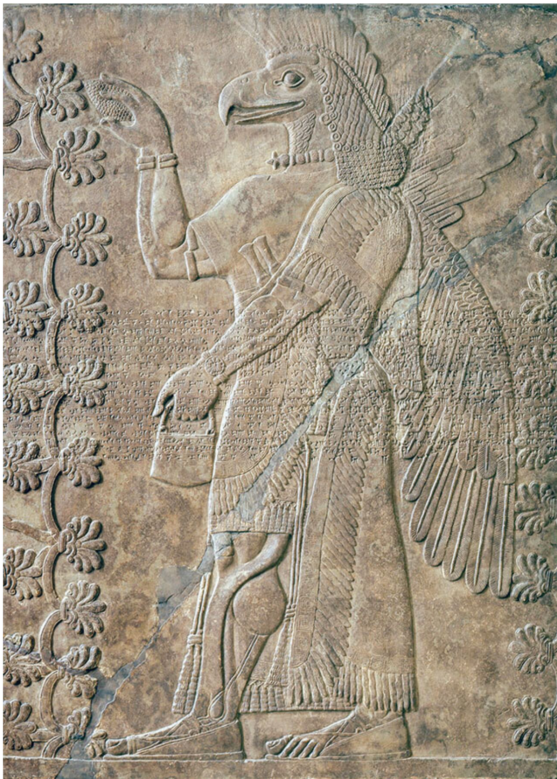
Божество с головой орла из Нимруда. Неоассирийский период, IX век до н. э. Музей искусств округа Лос-Анджелес