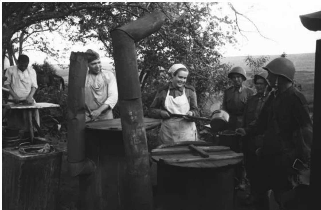
Выдача горячей пищи на советской полевой кухне. 1943 г.

Ситуация с довольствием разведподразделений изменилась 19 апреля 1943 г., когда вышел упомянутый приказ НКО № 0072. Он содержал указание установить за разведчиками питание по норме № 9, предназначенной для всех военных училищ сухопутных и воздушных сил, а также для рядового и младшего начсостава авиадесантных войск Красной Армии. Однако новая норма продержалась за разведчиками недолго. 22 июня 1943 г. вышел новый приказ НКО № 0384, отменивший нововведение: