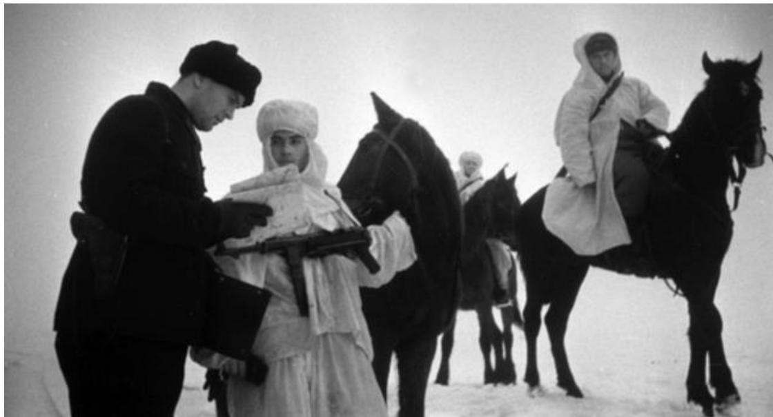
Советские конные разведчики получают задание от командира в степи под Сталинградом, Ноябрь-декабрь 1942 г.

Наставление полевой службе штабов, утвержденное начальником Генштаба Красной Армии Шапошниковым 17 марта 1942 г., содержало общие положения по разведке, касавшиеся командиров и начальников штабов соединений, частей и отчасти начальников разведывательных отделений