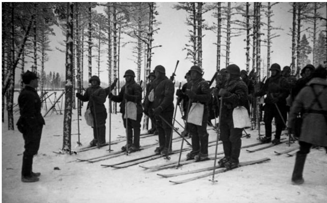
Лыжники РККА перед разведвыходом. Карельский перешеек.

Советско-финская война. Разведчики экипированы для лыжного похода, одеты в валенки, имеют ватное обмундирование и белые мешки на поясе неизвестного назначения