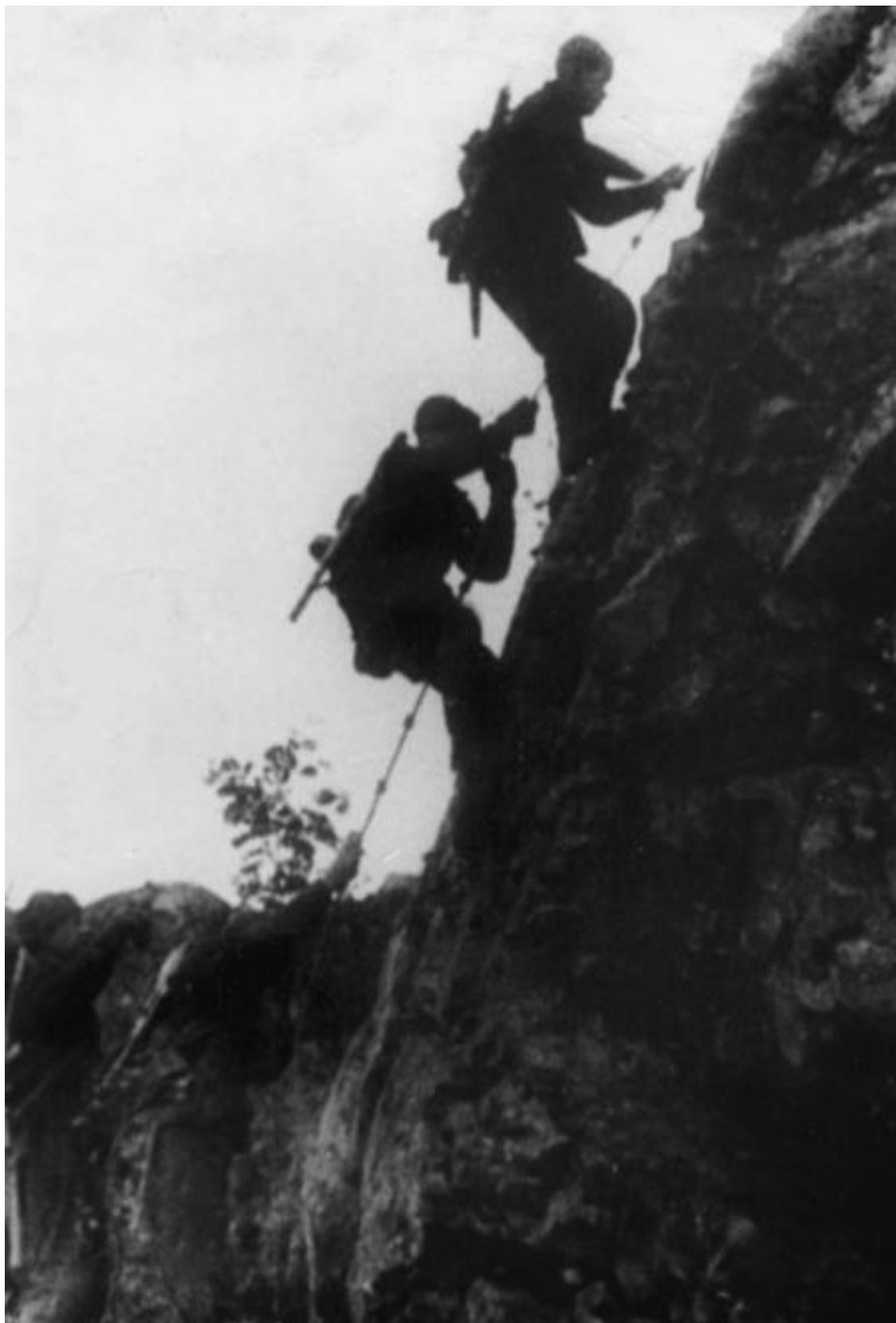
Советские разведчики на склоне хребта Муста-Тунтури. Заполярье. 1943 г.