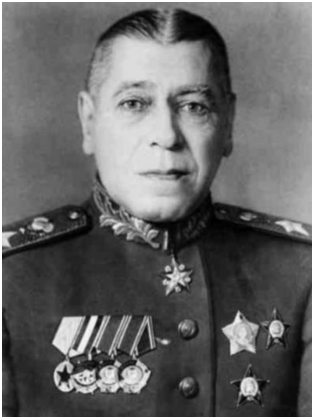
Маршал Борис Михайлович Шапошников

Чтобы понять качество подготовки разведчиков, обратимся к примерам Юго-Западного (далее – ЮЗФ. – Прим. автора. ) и Волховского (далее – ВолхФ – Прим. автора. ) фронтов конца 1942 – начала 1943 г.