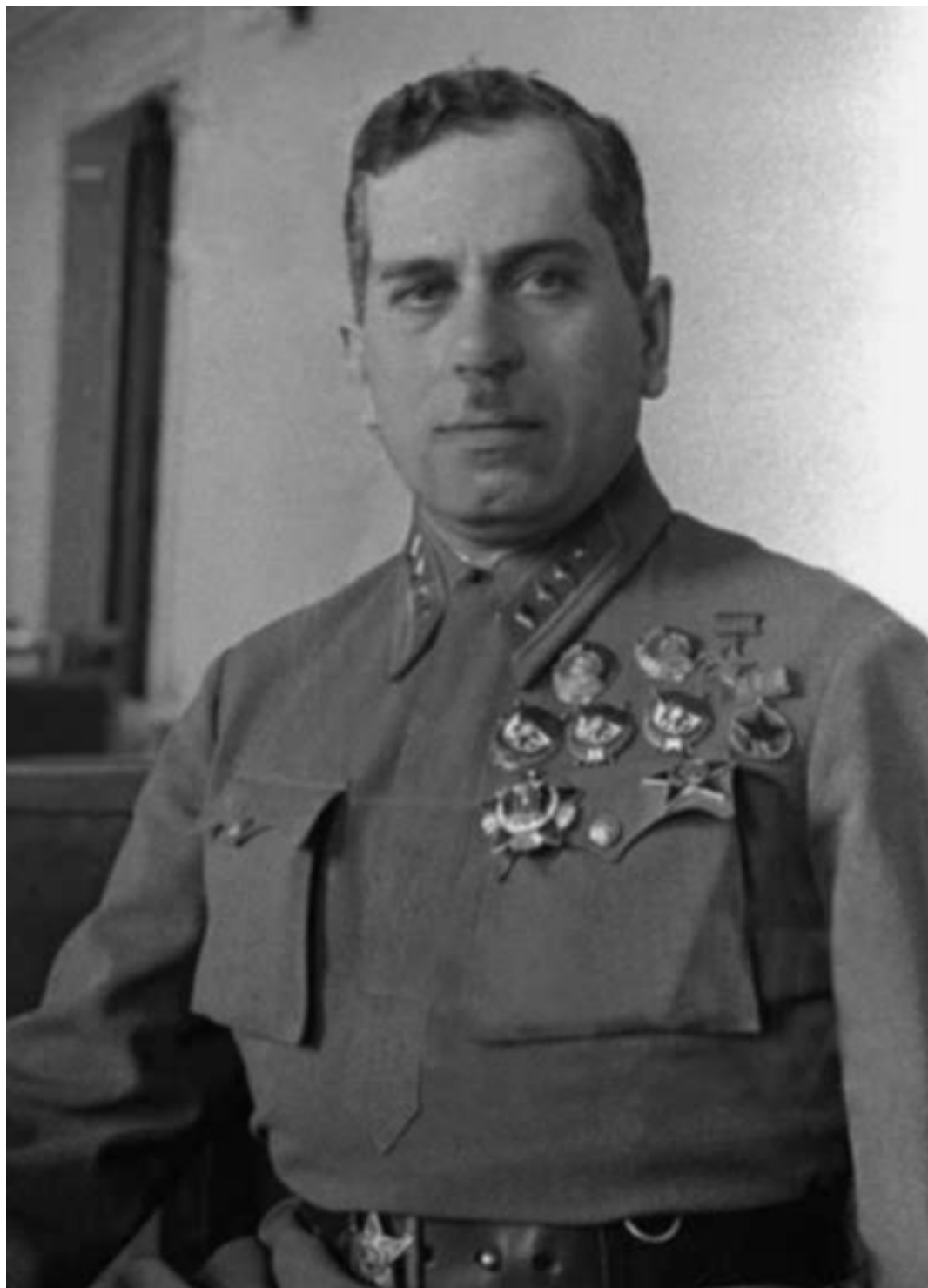
Генерал-полковник Григорий Штерн. Репрессирован и расстрелян 28 октября 1941 г. Посмертно реабилитирован

Другой причиной были кадры. На момент войны стрелковой дивизии полагалось иметь разведывательный батальон, в штат которого входили 273 человека, 16 танков, 10 бронемашин, 7 мотоциклов. В штат стрелковых полков входили пеший и конный разведвзводы – 32 и 53 человека. Но гладко это выглядело только на бумаге, так как в реальности разведподразделения частей и соединений были недоукомплектованы личным составом, а имевшийся не всегда был качественным. В результате уже летом 1941 г. в Красной Армии отказались от разведбатов, заменив их разведротами.