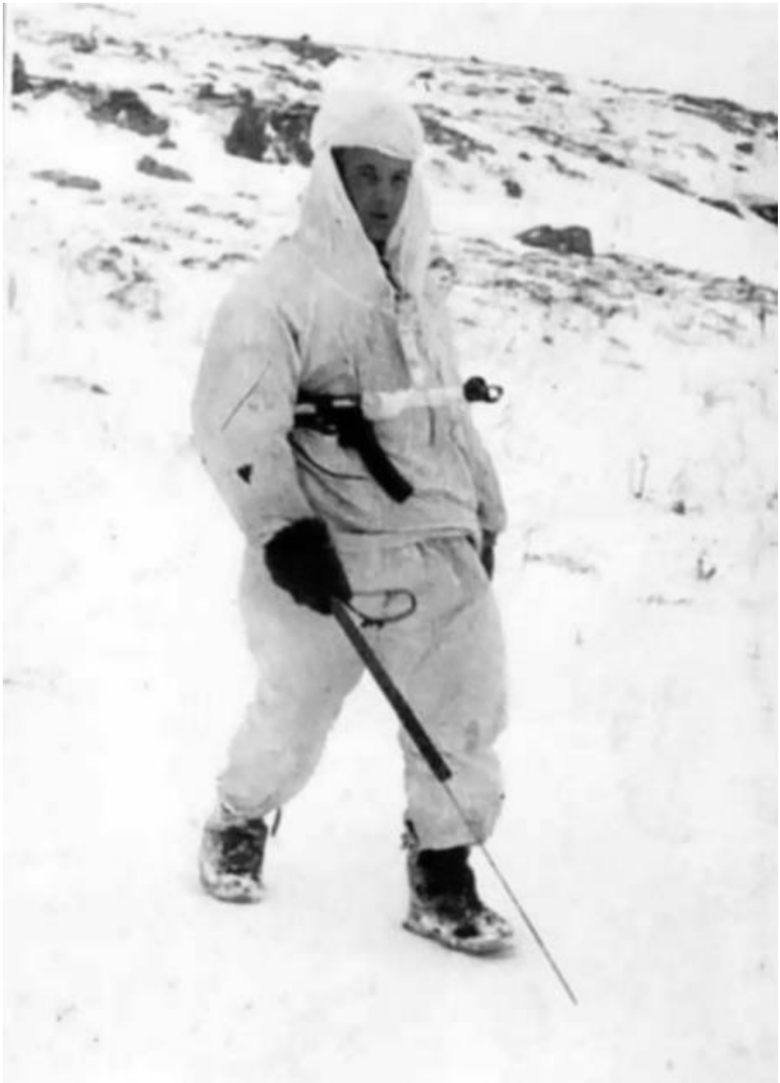
Советский сапер-разведчик из 35 гв. сп с щупом. Заполярье, 1944 г.

Если в разведку отправляется разведывательная партия силою взвод, рота с задачей вести в тылу врага бой (в целях разгрома штаба, узла связи, склада, захвата населенного пункта, моста, узла дорог и т. д.) то она обеспечивается также и групповым оружием –