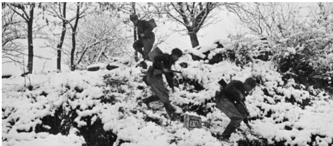
Советские разведчики спускаются по склону в Карпатах. 1944 г.

Отдельно отметим, что, собираясь в разведку, приходилось уделять внимание разным мелочам. К примеру, разведчикам нужно было взять с собой тонкий прочный шнур, который использовался для связи внутри ядра группы в ненастную погоду. Когда видимость и слышимость ухудшались, то «сигналы передаются натяжением или ослаблением шнура, а также резким дерганием его» . Кроме того, шнур мог быть использован для связывания пленных. О том, что в разведке мелочей не бывает, свидетельствует уже упомянутый подполковник Поташников: