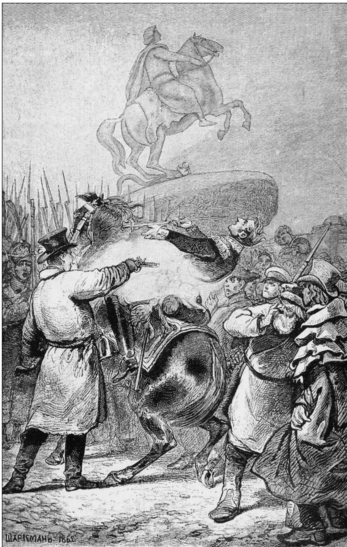
Выстрел в Милорадовича. Старинная гравюра