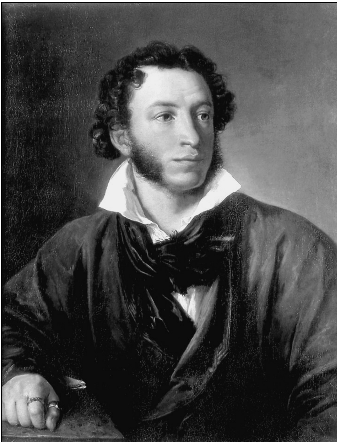
А.С. Пушкин. Художник В.А. Тропинин