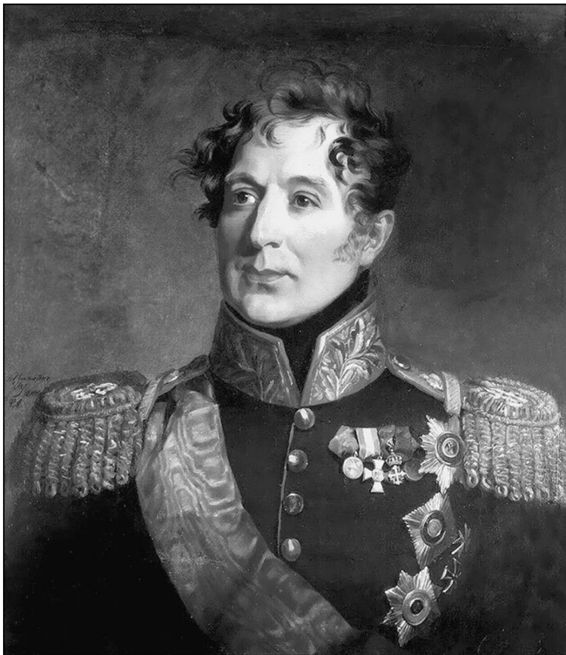
М.А. Милорадович. Художник Дж. Доу

Ну и что было делать Екатерине Телешевой? Возможно, Грибоедов и тронул ее сердце. Но она была в руках Милорадовича, который сделал ее, как судачили злые языки, «султаншей петербургских театров».