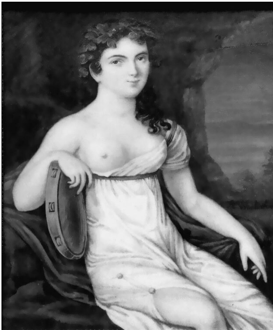
Авдотья Истомина. Художник А.Ф. Винтергальтер

Вот эта самая округлость форм в зрелые годы сыграла с ней злую шутку, но в юности она не только не портила фигуру, но делала еще более привлекательной.