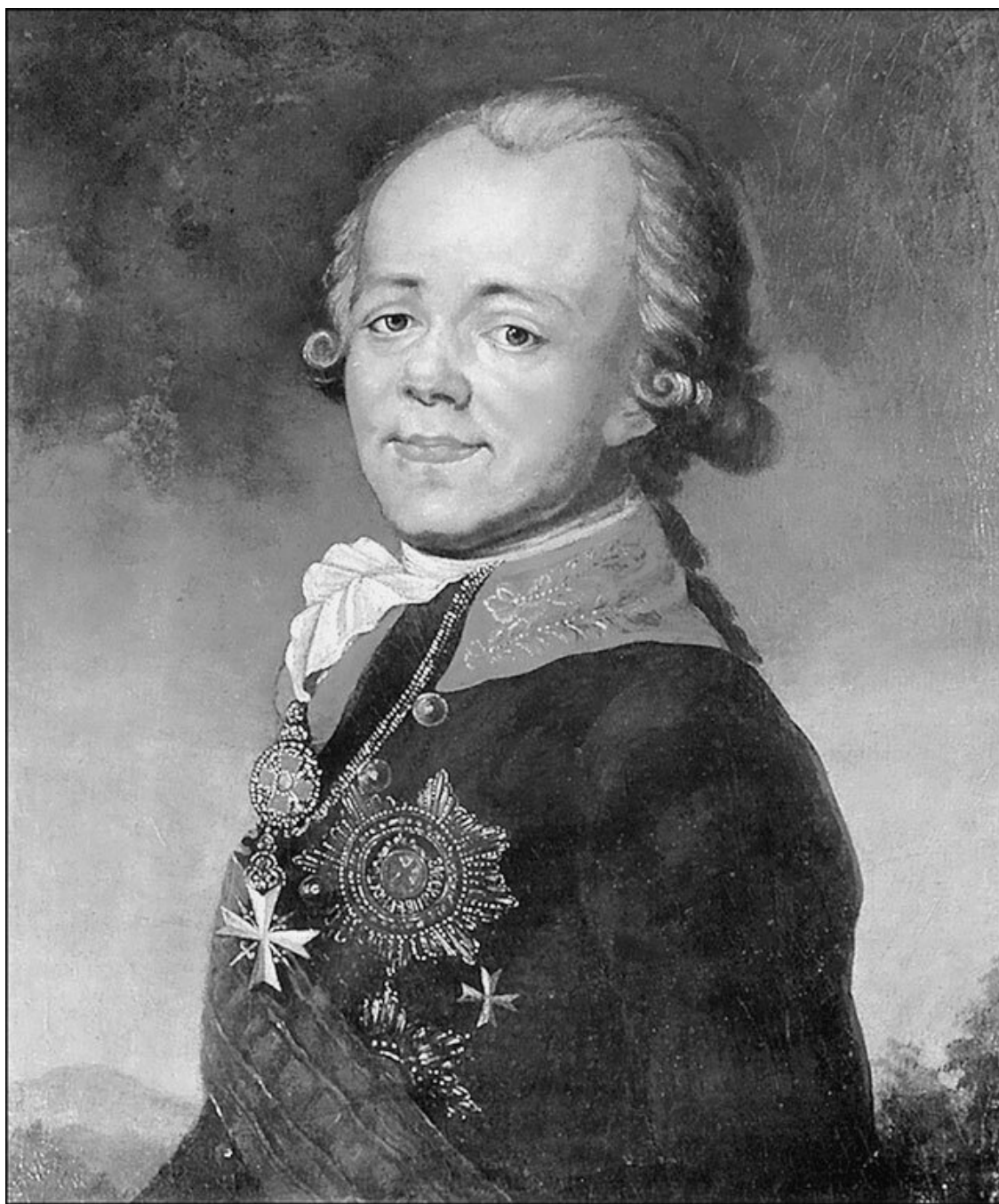
Павел I. Неизвестный художник

Ну и актрис, разумеется, пугали. Вот, мол, станцуешь плохо, несдобровать. А император любил театр. Это было известно. К театру приобщила его еще матушка-государыня Екатерина Великая, столь внезапно покинувшая земной мир, заставив горько оплакивать ее по всей необъятной России. Екатерина Великая сама писала пьесы, правда, вовсе не балетные постановки, а драматические и сатирические.