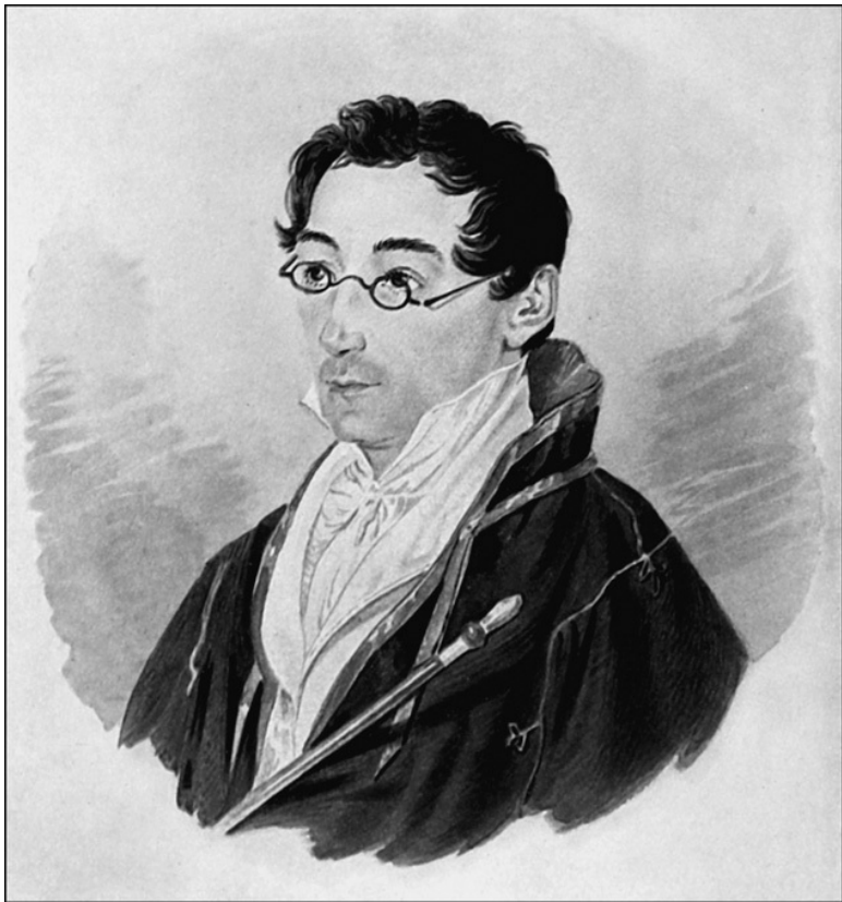
А.С. Грибоедов. Художник В. Мошков

«Якубович, указывая на Шереметева, обратился к Грибоедову с изъяснением того, что в эту минуту им, конечно, невозможно стреляться, потому что он должен отвезти Ше-