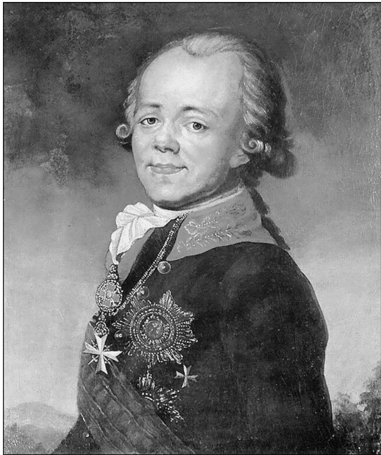
Павел I. Неизвестный художник

Ну и актрис, разумеется, пугали. Вот, мол, станцуешь