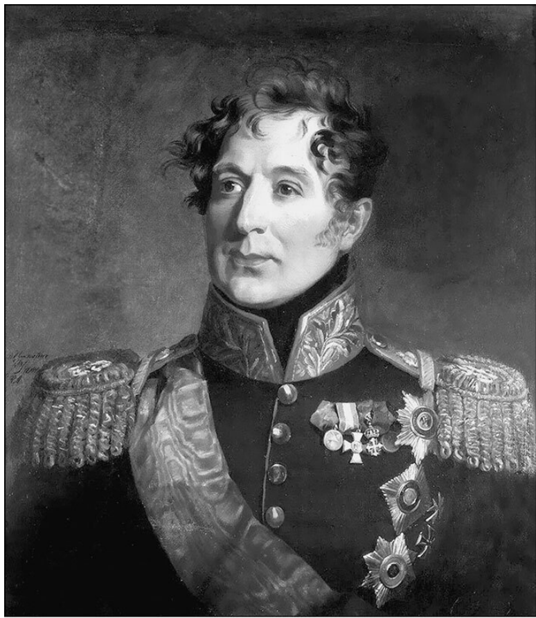
М.А. Милорадович.

Она могла выбирать себе роли, могла требовать даже, чтобы ставили спектакли, которые ей по нраву. Она постепенно