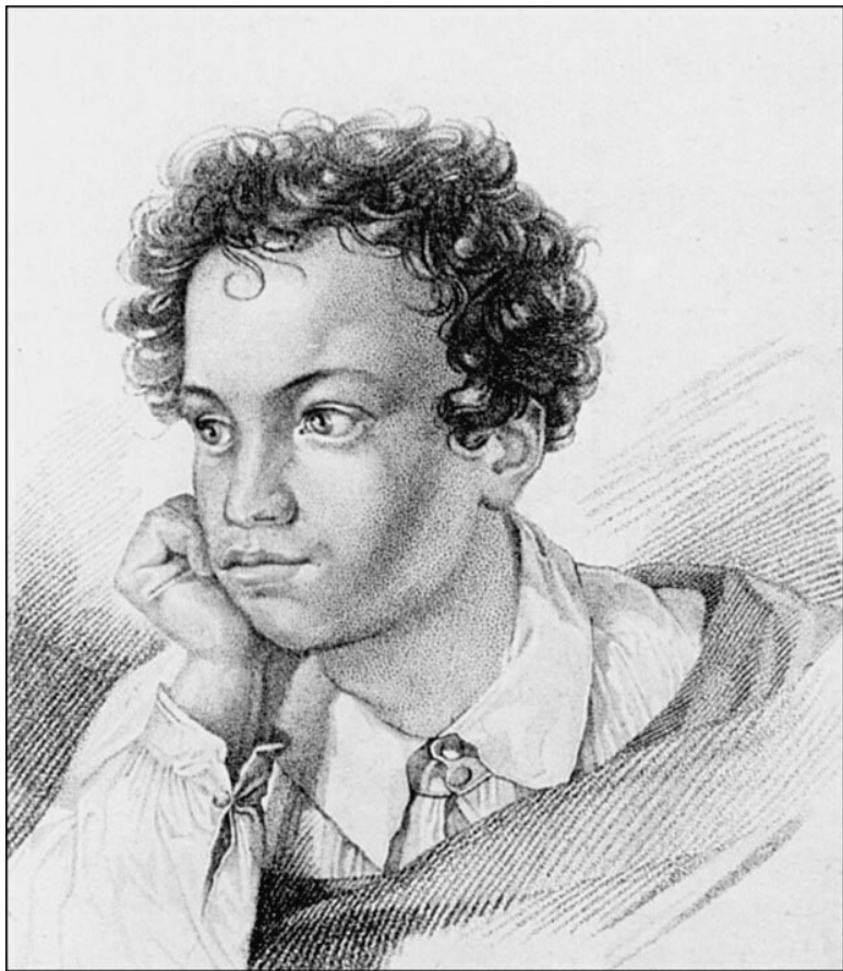
А.С. Пушкин. Художник Е.И. Гейтман

Можно с уверенностью сказать, что Наташа Овощникова