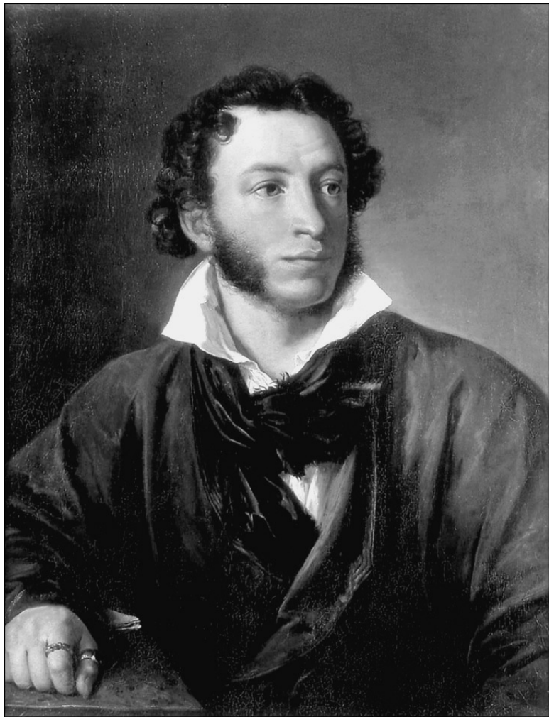
А.С. Пушкин. Художник В.А. Тропинин